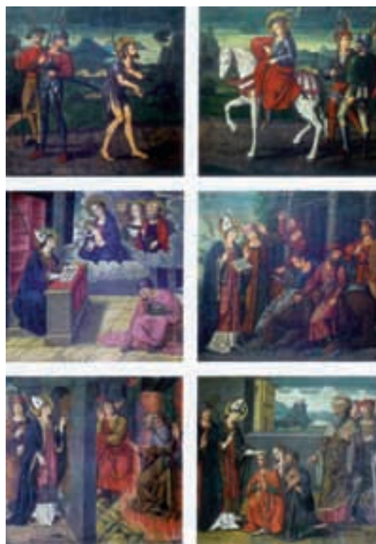
Fig.2.- Nicolás Falcó. Gozos de la Virgen . Pinturas de las puertas de los órganos de la catedral de Valencia