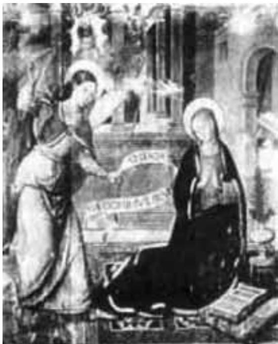
Fig. 12.- Nicolás Falcó: Anunciación . (Colección Calabuig Trénor, Valencia).

como fases del pintor. A estas influencias se añadiría la muy evidente de Paolo de San Leocadio. Es decir, Nicolás Falcó evoluciona desde los últimos epígonos del goticismo tardío hasta la plena asunción de la nueva estética del cuatrocientos italiano.