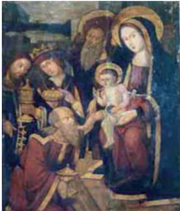
Fig. 13.- Nicolás Falcó: Adoración de los Reyes . Iglesia parroquial de Benissanó (Valencia).