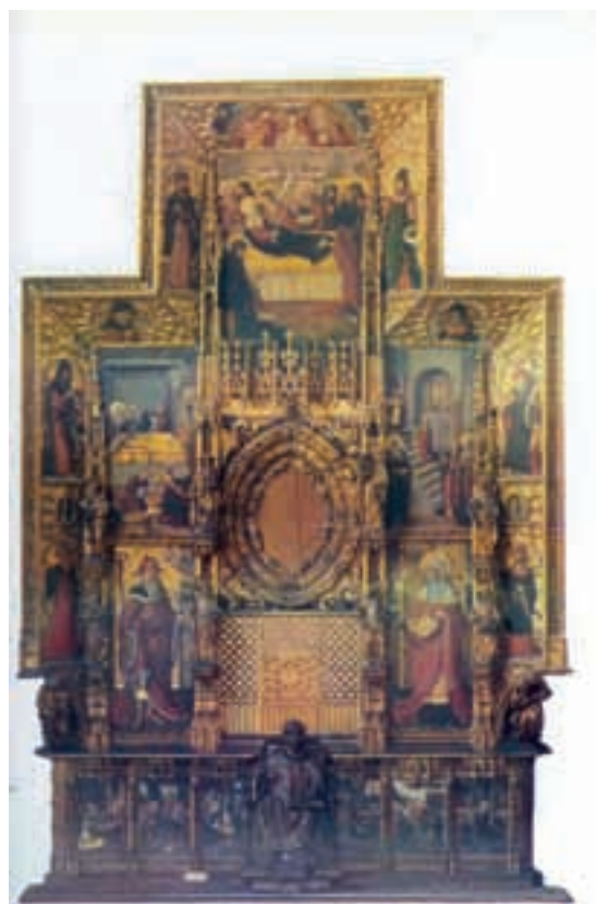
Fig.1.- Nicolás Falcó. Retablo de la Puridad. Museo de Bellas Artes de Valencia.

Conocemos el nombre de un miembro del taller de Nicolás Falcó en 1503. El 16 de octubre