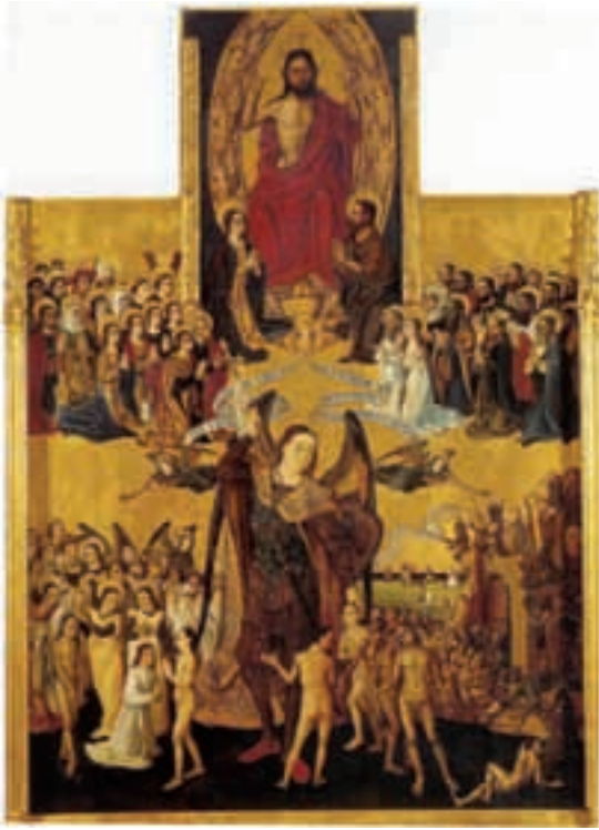
Fig.7.- Nicolás Falcó (atribuido) Retablo del Juicio Final con San Miguel . Museo de Bellas Artes de Valencia.

de Xàtiva, así como la faz plana y angulosa de San Antonio es semejante al personaje de San Nicolás de la Virgen de la Sapiencia . (Fig. 6). El rostro de la Virgen en esta última tabla deriva a su vez de la Virgen con ángeles del Maestro de Artés/ Pere Cabanes en el retablo mayor de San Feliu de Xàtiva 53 .