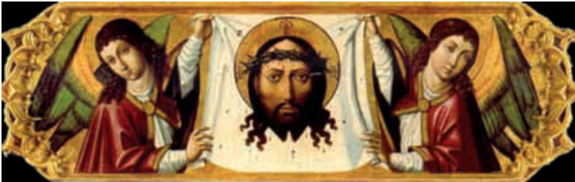
Fig.8.- Nicolás Falcó (atribuido). Santa Faz con ángeles . Museo de Bellas Artes de Valencia.