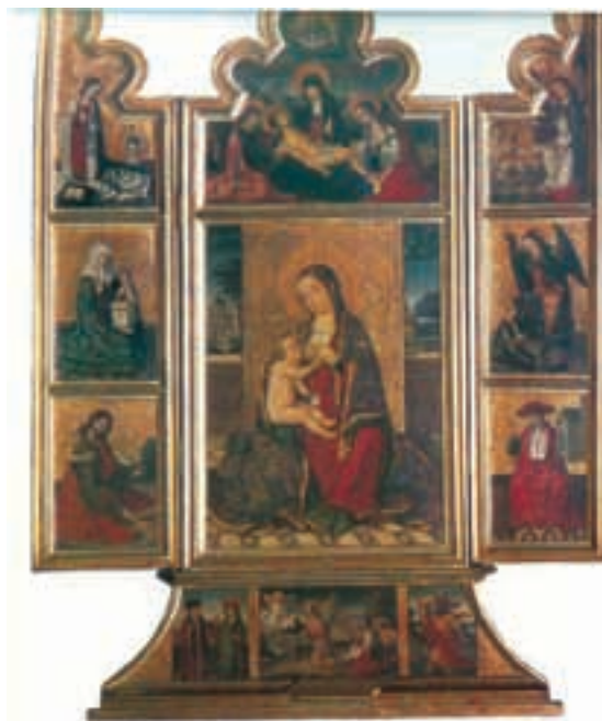
Fig. 14.- Maestro de Martínez Vallejo / Nicolás Falcó: Tríptico de la Virgen de la Leche . Museo de Bellas Artes de Valencia.