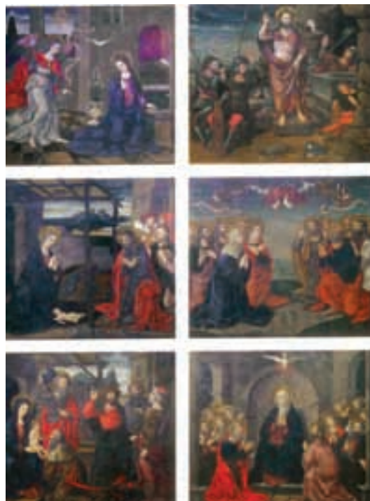
Fig.3.- Nicolás Falcó: Episodios de la vida de san Martín . Pinturas de las puertas de los órganos de la catedral de Valencia