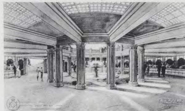
JAVIER GOERLICH, 1931. Mercado de Flores, perspectiva.

se situaban de forma simétrica en el macizo. El conjunto, al que se accedía por grandes escalinatas, era recorrido por una balaustrada entre pilastras; también destacaban grandes candelabros con globos de cristal, situados sobre pilonos, que se encargaban de iluminar la plaza 2 .