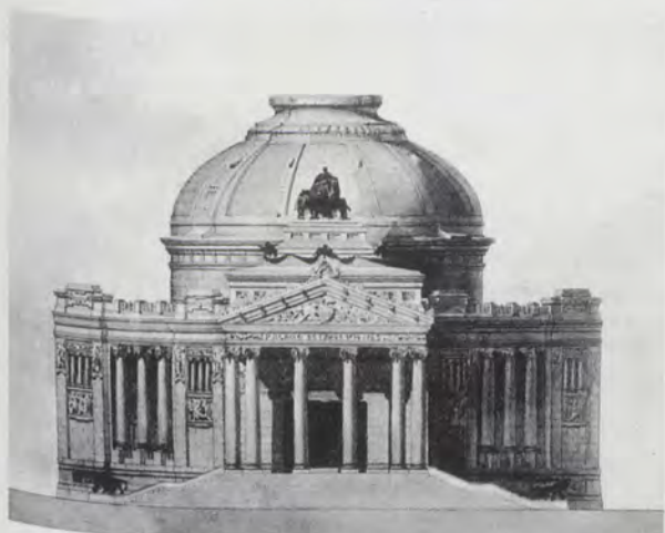
JAVIER GOERLICH, 1917. Palacio de Exposiciones, detalle.

de nueva planta para Palacio de Exposiciones 4 ; dentro del concurso, convocado en septiembre de 1917, por el Círculo de Bellas Artes de Valencia, impulsado por Sorolla y Benlliure. Por otra parte, el monumental proyecto de Goerlich para el Colegio de San Pío V interfería con el no realizado, del arquitecto provincial Luis Albert Ballesteros, para convertirlo en residencia del Jefe del Estado en los Jardines del Real de Valencia (1954) 5 . También, Goerlich realizará, en julio de 1945, el proyecto de restauración de la iglesia de San Agustín y Santa Catalina en Valencia, debido a los numerosos desperfectos que había sufrido en el periodo de guerra, que habrían llegado a plantear su derribo 6 .