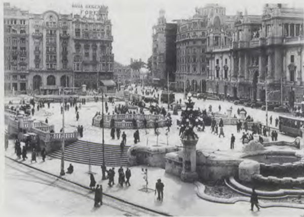
Vista de la Plaza del Ayuntamiento de Valencia, según la reforma de Javier Goerlich.