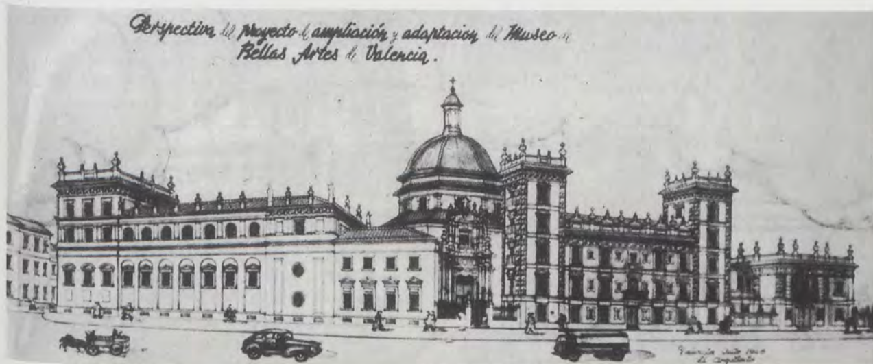
JAVIER GOERLICH, 1948. Perspectiva del proyecto de ampliación y adaptación del Museo de Bellas Artes de Valencia.