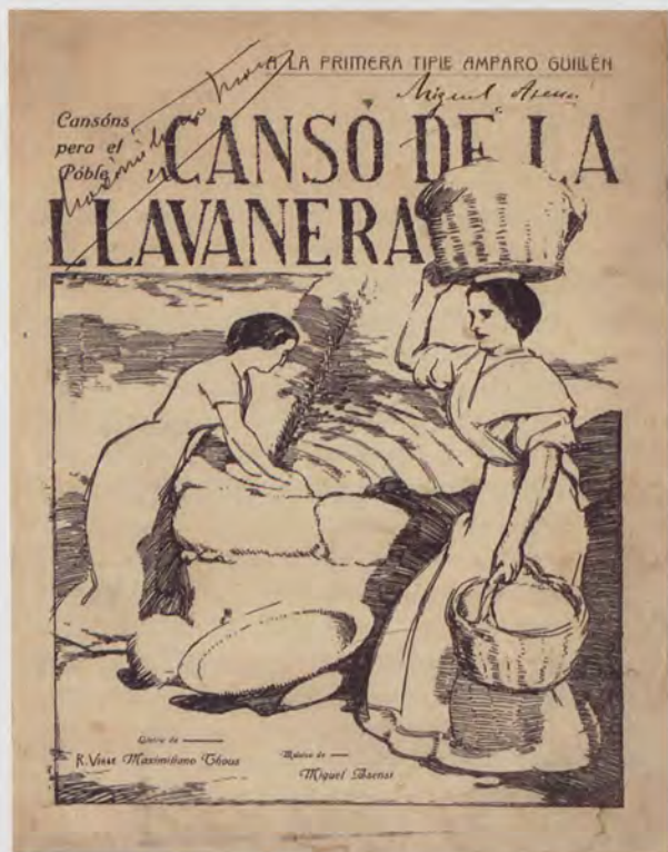
Cubierta de la partitura Cansó de la llavanera compuesta por Miguel Asensi y letra de Maximiliano Thous con firma autógrafa de los mismos.

En primer lugar las Canciones , con 58 obras. Destaca de este apartado el elevado número de canciones valencianas, un gran número de ellas del compositor Miguel Asensi. También hay un número considerable de composiciones de Manuel López-Quiroga, composiciones creación o dedicadas a las más grandes intérpretes de la copla española de los años 40.