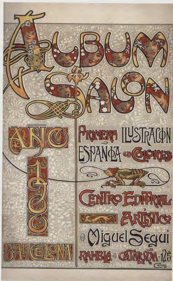
Cubierta de la Revista Album [sic] Salon [sic]. Publicación de 1900

Un primer apartado, Música vocal , dentro del cual se encuentra el subapartado de Canciones , el cual cuenta con apenas dos obras, cada una de ellas bien distinta a la otra. La primera es una obra de Juan Llongueras; es una canción infantil que explica