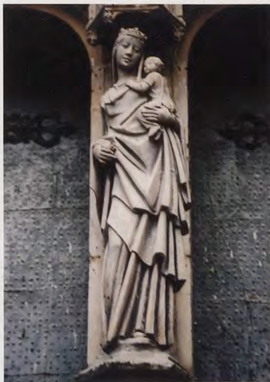
5.- Virgen con el Niño, que decora el parteluz en la portada de la iglesia parroquial de San Martín de Callosa de Segura. Conjunto.

Nuestro escultor ha sabido resolver un problema difícil, y es el de adecuar en la fachada y en el parteluz el espíritu de la antigua imagen desaparecida,