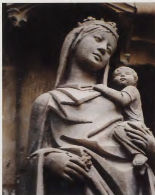
6.- Virgen con el Niño, que decora el parteluz en la fachada de la iglesia parroquial de San Martín de Callosa de Segura. Detalle.