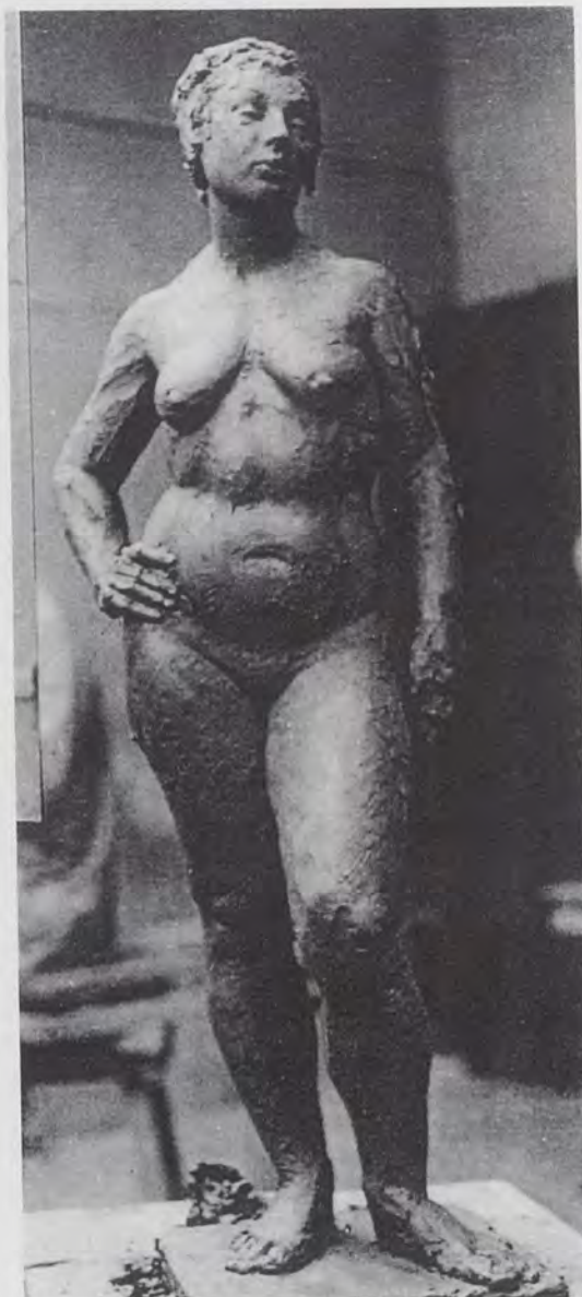
1.- Desnudo de mujer, Escuela Superior de Bellas Artes de San Carlos de Valencia.

Muestra una obra de virtuoso realismo, y de gran destreza en el modelado.