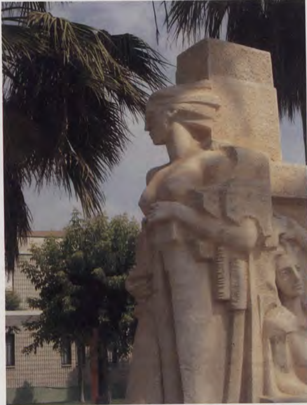
3.- Monumento a la Agricultura. Detalle. Escuela de Ingenieros Agrónomos de Orihuela.

clásico, heredero del arte griego: Policleto, Praxíteles, del "contraposto", en el cual adelanta el pie izquierdo, y retrocede con el derecho para dar más elegancia y prestancia a la escultura, dándole un estilo señorial.