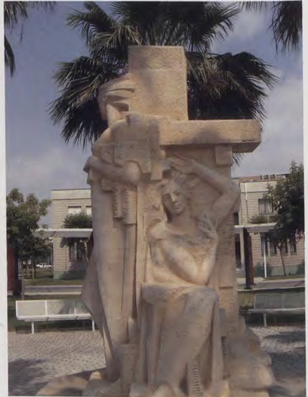
4.- Monumento a la Agricultura. Detalle. Escuela de Ingenieros Agrónomos de Orihuela.

La "Agricultura", con su característica simbología, sentada y de perfil, en actitud indolente, se