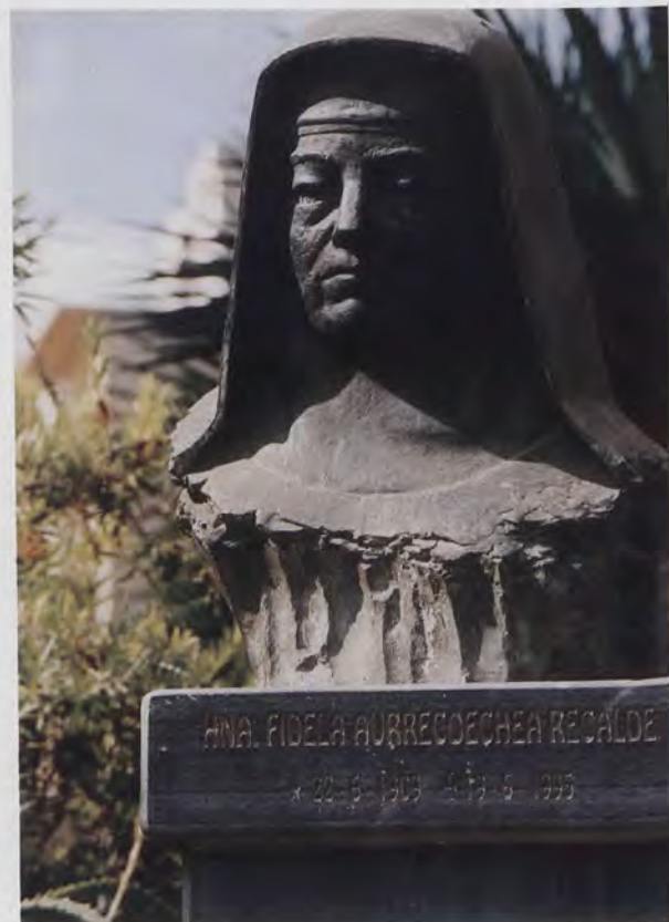
7.- Monumento en bronce a la Hermana Fidela, en Callosa de Segura.

En el año 1997, lleva a cabo para el retablo del altar mayor de la mencionada iglesia, seis relieves en madera, dos puertas laterales, la mesa de altar, altar en mármol y pila bautismal en bronce.