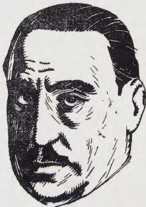
Don Miguel Maura

Fig. 4.- RUANO. Dibujo de Miguel Maura. "La Voz Valenciana", 11-1-1932. Valencia. Portada