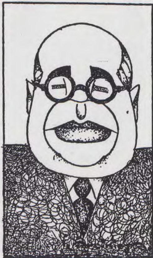
Don Manuel Azaña

Fig. 5.- "Las Provincias". 4-7-1932. Valencia. Portada