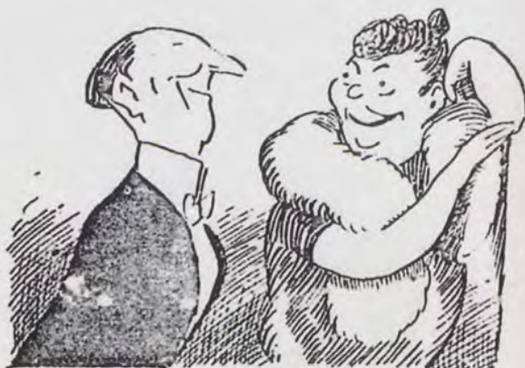
Fig. 6.- XAUDARÓ. "Blanco y Negro". 4-7-1932. Madrid. Portada

Conforme avanzaba la contienda algunos diarios dejaron de publicarse como el periódico Las Provincias a partir de agosto de 1936, solamente volvieron a publicarse algunos números entre abril y mayo de 1939. En abril de ese año dejaron de publicarse caricaturas. El 8 de abril este diario se hizo eco de la destitución del Presidente la República D. Niceto Alcalá Zamora. La mayor parte de las caricaturas fueron realizadas por Emilio Panach, haciendo numerosas viñetas donde reflejaba el momento social y político que se vivía, con títulos como "Aleluyas al instante, de actualidad palpitante". Hay numerosas caricaturas de políticos como Lerroux, Maura o Gil Robles. Emilio Panach pasó a firmar como Milo al acabar la