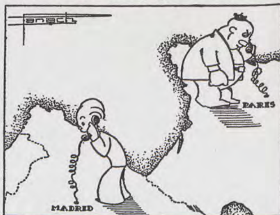
Prieto (desde París).—¿Que he de ir si quiero hacer efectivas mis dietas? El correlligionario (desde Madrid).—¡Exacto! Ven y verás cómo "cobras".

Fig. 7.- PANACH. Caricatura de Indalecio Prieto. "Las Provincias". 16-2-1935. Valencia; p. 2.