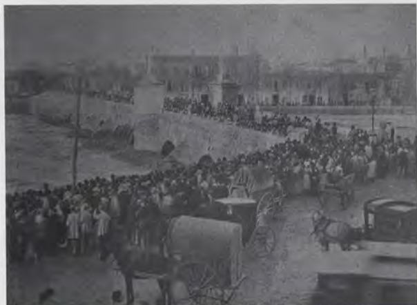
Fig. 10.- Crecida del río Turia, 1897.