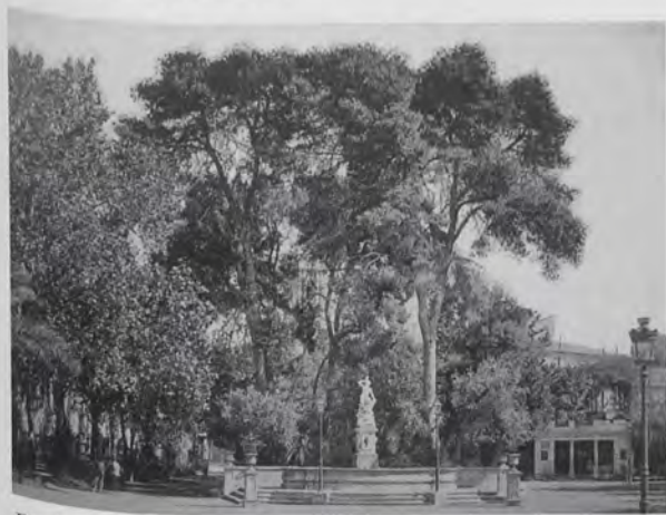
Fig. 9.— Paseo de la Glorieta, 1889 (del álbum Vistas de Valencia ).

El último trabajo importante realizado por el gabinete de Antonio García en la década de los ochenta, y en el que deja constancia de su visión comercial, fue la edición en el mes de julio de 1889 de un álbum de pequeño formato, con doce vistas de Valencia, encuadernado en tela y adornado de oro, que se vendía al precio de 5 pesetas. Según la prensa de la época, resultaba muy útil para los forasteros que visitaban Valencia. La publicación de este álbum, titulado Vistas de Valencia , fue consecuencia directa del éxito editorial que tuvieron las ediciones de los dos tomos dedicados a Valencia, escritos por Teodoro Llorente, que fueron publicados primero en 1887 mediante cuadernos (lo que hoy denominamos fascículos encuadernables) y luego en 1889 como libros, por la editorial Daniel Cortezo y Cia. de Barcelona, dentro de la obra titulada España. Sus monumentos y artes. Su naturaleza e historia .