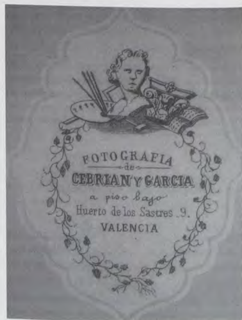
Fig. 2.— Publicidad utilizada por Cebrian y García. La imagen de arriba, es de 1862 y utilizan la expresión "galería de cristales"; la de abajo, es de 1864 y emplean la expresión "Fotografía de ...".