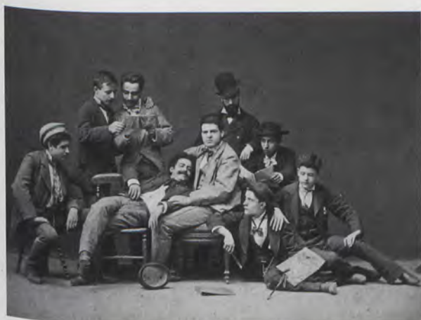
Fig. 5.- Retrato de alumnos de Bellas Artes de San Carlos, curso 1877-78, dedicado a Don Salustiano Asenjo.

Al objeto de ofrecer un dato objetivo que identifique el prestigio alcanzado por Antonio García y cual era su posición en el conjunto de los fotógrafos asentados en Valencia, destacaremos que durante el período 1873-1874, de los diez gabinetes fotográficos establecidos en Valencia, el de García ocupaba el segundo lugar 13 .