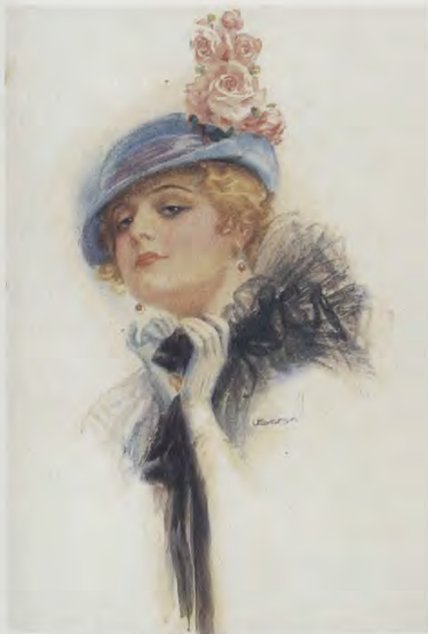
USABAL. Joven muchacha , tarjeta postal, ca. 1918. Colección particular. Valencia

coleccionaciones españolas 6 . En el presente estudio se recogen algunas informaciones sobre su exitosa e interesantísima trayectoria profesional, destacando especialmente su labor pictórica e ilustradora, que demuestra la gran calidad artística de Usabal 7 .