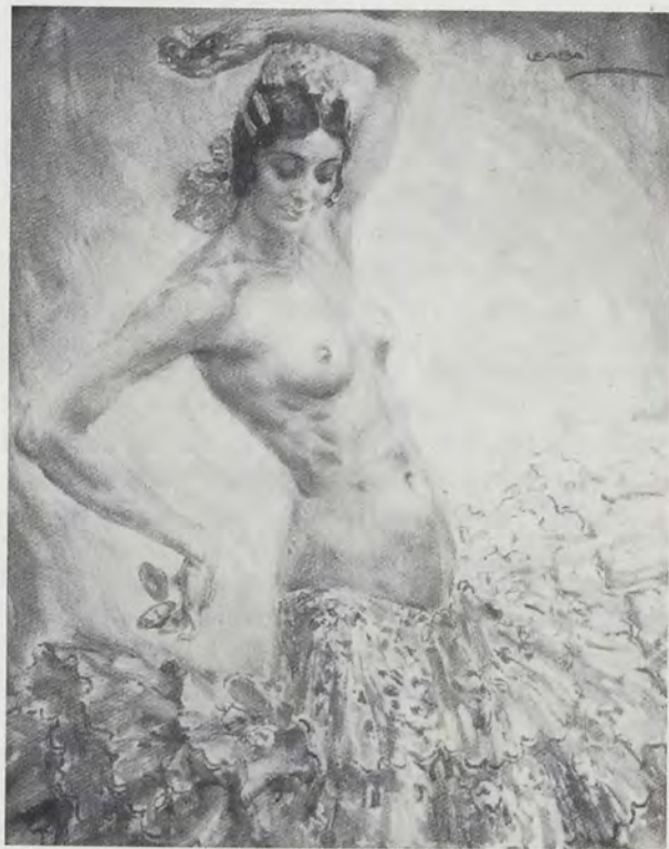
USABAL. Bailarina, Antonia Mercé "La Argentina" , ca. 1934. Paradero desconocido

Usabal se dedicó a pintar retratos de personalidades de la vida política, social y cultural, como la bailarina La Argentina y el arquitecto Baeschlin, entre otras importantes figuras de la época. También pintó algunos paisajes y, en menor medida, siguió cultivando la ilustración. Algunos autores han escrito que colaboró, con dibujos y acuarelas, en otras prestigiosas revistas gráficas nacionales, pero esta