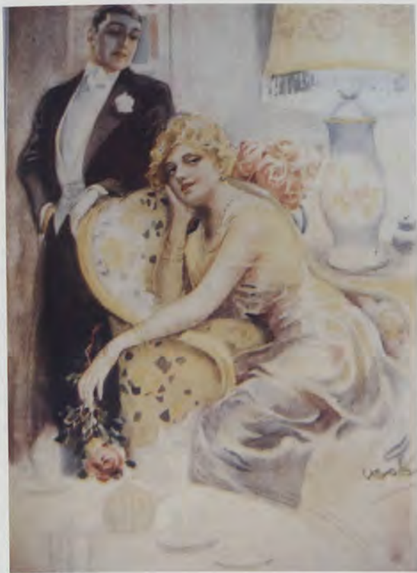
USABAL. Rie tu risa, mujer , revista La Esfera , 13 de marzo de 1920

Por otra parte, en algunas ocasiones, se ha calificado erróneamente a Usabal como un pintor "de corte costumbrista y regionalista" o como cultivador de un género "que podemos denominar typical " 13 . Pero lo cierto es que el pintor combinó sabiamente una técnica casi neoimpresionista al pie de la letra, totalmente ajena a las querencias de la pintura valenciana del momento, con un clasicismo de gusto cosmopolita que incluso en alguna ocasión llegó a ser adjetivado como pompier 14 . Solamente el pintor valenciano José Guiteras Soto (Játiva 1885-1950) utilizó, a partir de 1918, algunos aspectos puntillistas en los celajes de sus composiciones paisajísticas. De lo que no hay duda alguna es que Usabal fue un pintor singular, culto y refinado, viajero incansable y conocedor de las corrientes modernas de la pintura internacional. Y esas características se traslucen incluso en sus obras de temática folclorista, en sus retratos de personajes de la vida pública y en sus particularísimos paisajes, en los que la pincelada neoimpresionista se presenta siempre vibrátil, segura y jugosa de color.