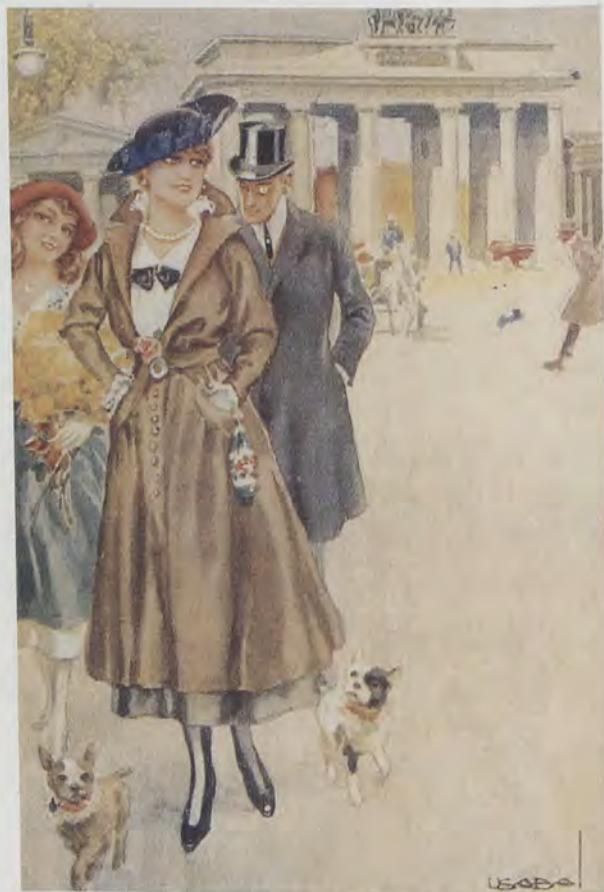
USABAL. Weltstadtleben (La vida cosmopolita) , tarjeta postal, ca. 1918. Colección particular. Valencia

Asimismo era conocido, más de oídas que por visión directa, su gran prestigio como ilustrador, cartelista y dibujante, una situación que le hizo ocupar lugar preeminente entre estos artistas tanto en Alemania como en los Estados Unidos, en las primeras décadas de siglo, debido a la elegancia y soltura de su dibujo y por la vida que otorgaba a sus composiciones 4 . Pero muy poco o casi nada se sabía de este interesante aspecto de su trabajo artístico, siendo levemente citado en la bibliografía especializada. Sin embargo el uso positivo de un medio de comunicación extraordinario como es Internet nos ha proporcionado las herramientas necesarias para poder conocer una gran parte, prácticamente casi un centenar, de sus ilustraciones 5 . Se trata en su mayoría de postales ilustradas, editadas durante los años diez y veinte del siglo pasado por prestigiosas editoriales alemanas y estadounidenses, que actualmente se muestran y venden a través de la red. De este modo tan curioso la obra de Usabal ilustrador ha tomado nuevos derroteros abriéndose, desde las cajas de recuerdos afectivos y familiares, otra vez al mundo que las vio circular a través del correo ordinario. Por ese mismo medio de comunicación electrónico han aparecido reproducciones de algunos de los carteles realizados por el artista, tanto en páginas de subastas como en aquellas destinadas al recreo e información de los coleccionistas de la cartelística y de las artes gráficas de principios del Novecientos.