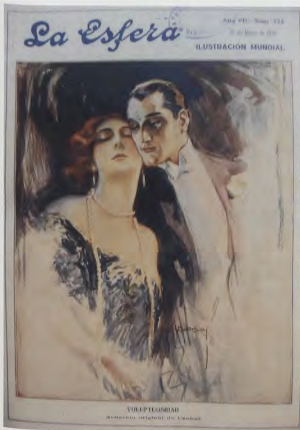
USABAL. Voluptuosidad , revista La Esfera , 20 de marzo de 1920

De esta época hemos localizado, a través de Internet, algunos carteles realizados y firmados por Usabal en este periodo: como el de la marca inglesa de película fotográfica Kinema Color (litografía, 71 x 95 cm, 1908); el del espíritoso champagne alemán Kupferberg Gold (litografía, 1911); los de la galería comercial o Winter Garten , como el titulado Mdm. Chung (litografía, 71 x 94 cm, 1911) o el rotulado Napierkowska (litografía, 72 x 95, h. 1911); el de Pierot et Kolombin (litografía, 54 x 40 cm) y el cartel dedicado a la cantante francesa Yvette Guilbert (h. 1910). Son carteles de gran impacto visual en los que prima la figura humana femenina y la utilización de los colores planos, y en todos ellos queda patente la chispeante alegría de vivir y un desenfadado elegante, exótico y sumamente cosmopolita.