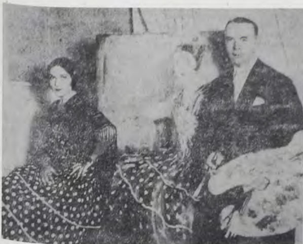
Luis Usabal pintando el retrato de Dolores del Río, ca. 1926

artículos humorísticos de Julio Camba, editado en castellano y con introducción – fechada en 1926–, notas y vocabulario a cargo de Federico de Onís 25 . Dicho volumen pertenece a la colección Contemporary Spanish Texts, Heath's Modern Languages Series y