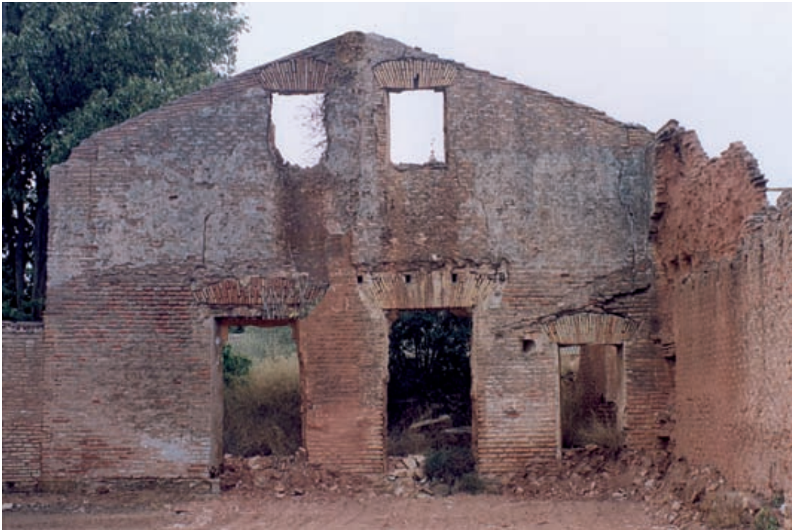
Fig. 8.- Testera recaent al l'hort d'una cel·la d' Ara Christi amb distribució de portes i finestres i restes de cubrició del pas porticat que anava a la latrina