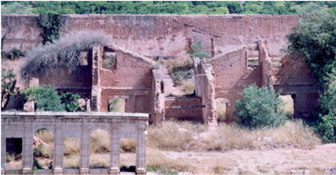
Fig. II.- Panoràmica des del claustre major de les restes de dues celles d'Aracristi amb visió de la seua estructura, espais i obertures

que la casa i hort junts d'un pare, i el seu jardí, que era bastant més gran que l'habitable i segons sembla s'hi accedia baixant unes escales puix que es trobava en un nivell inferior, s'estenia fora dels límits del quadrat que constituïa el conjunt de l'àrea eremítica.