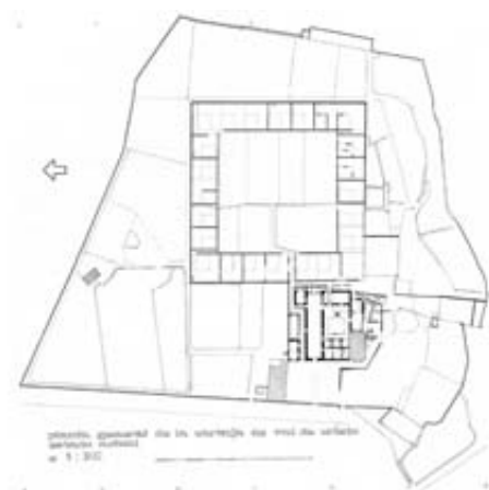
Fig. 3.- Planta de la cartoixa de Valldecrist en estat actual (E. Martín)

El principal investigador del cenobi de la serra Calderona continua referint sobre l'esquema de cella de la Grande Chartreuse: “ Sobre la puerta de entrada... una letra señalaba a cada celda... En el piso bajo hay una pequeña galería para los paseos del religioso cuando el mal tiempo le impide salir al jardín. Una sala grande, dividida en dos partes, comprende la leñera y el taller, donde hay un torno, un banco de carpintero y las herramientas necesarias para el trabajo manual. En el piso de arriba hay dos piezas fundamentales, la antecámara o ‘Ave María’ y el ‘cubículum’, donde el monje pasa la mayor parte de su tiempo. La