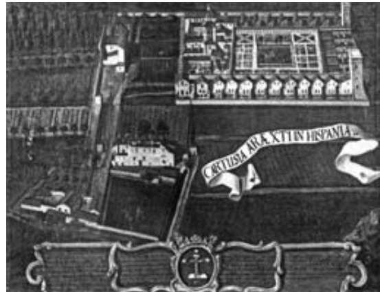
Fig. 2.- La cartoixa d'Ara Christi segons una pintura a l'oli anònima del segle XVIII, collection of the Abbey of Klosterneuburg G.472

no han estat modificats des que foren erigits i que ens serveixen, alhora, per saber com eren la resta dels habitatges on romanien els monjos del Puig i, en conseqüència, els dels pares d'Altura, en les quals s'inspiraren.