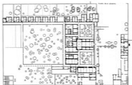
Fig. 4.- Planta de la cartoixa d'Aracristi abans de les intervencions actuals (J. Hernández)

Com s'ha esmentat adés, l'estat lamentable de conservació en què es troben les cel·les de