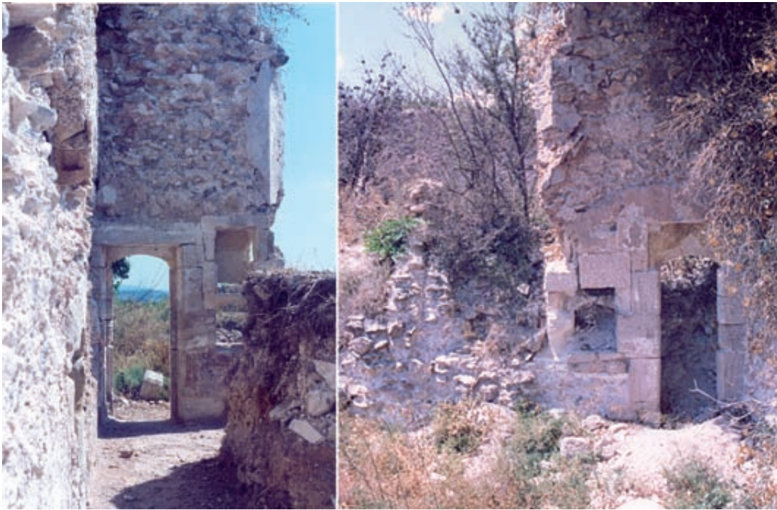
Fig. 10.- Porta d'eixida a l'hort d'una cel·la de Valldecrist. Visió des de dins de la cel·la (esquerra) i des de l'hort (dreta)

podem suposar que foren els mateixos que ho feren alhora en el claustre i l'església major: Miquel Garcia (actiu en la cartoixa d'Altura entre 1395 i 1435) i Pere Balaguer (mestre major de les obres com a mínim des del 6 de febrer de 1398 17 ). Res no sabem dels altres mestres que hagueren de continuar l'obra del gran claustre durant la meitat de la centúria i el tercer quart del segle XV i que –és de suposar– conforme l'alçaven li anaven incorporant noves cel·les.