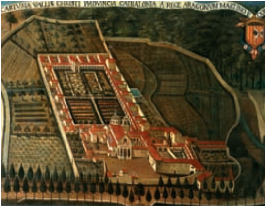
Fig. 1.- La cartoixa de Valldecrist el 1718, pintura a l'oli anònima de la col·lecció de la Grande Chartreuse, clixé Musée dauphinois, Grenoble