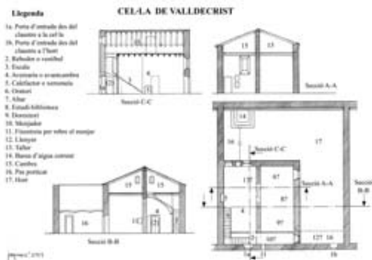
Fig. 5.- Planta i seccions de la cel·la de Valldecríst amb la distribució hipotètica dels seus espais i funcions (J.M. Gómez)

Efectivament, mentre que a l'esquema representat per la cel·la de la casa matriu de Grenoble els espais es distribueixen compensats en dos nivells: planta baixa i superior; el model que presenten les cases cartoixanes de Catalunya, l'esquema del qual correspon aproximadament al del plànol de la Chartreuse de Clarmont (o