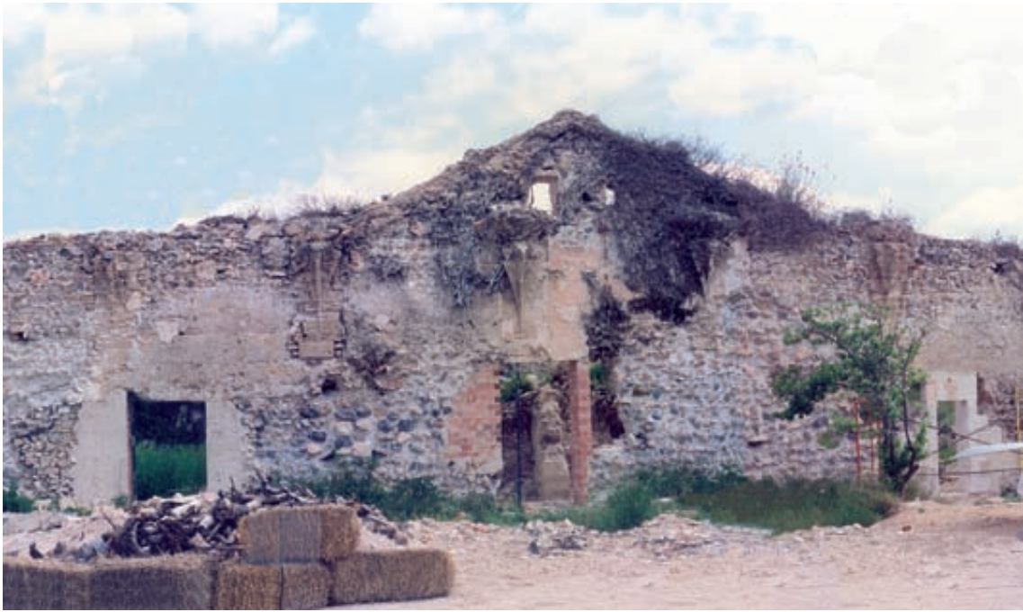
Fig. 7.- Fragment del llenç de mur septentrional del claustre major de Valldecrist amb la testera, finestres i portes d'accés a les celles que hi recauen