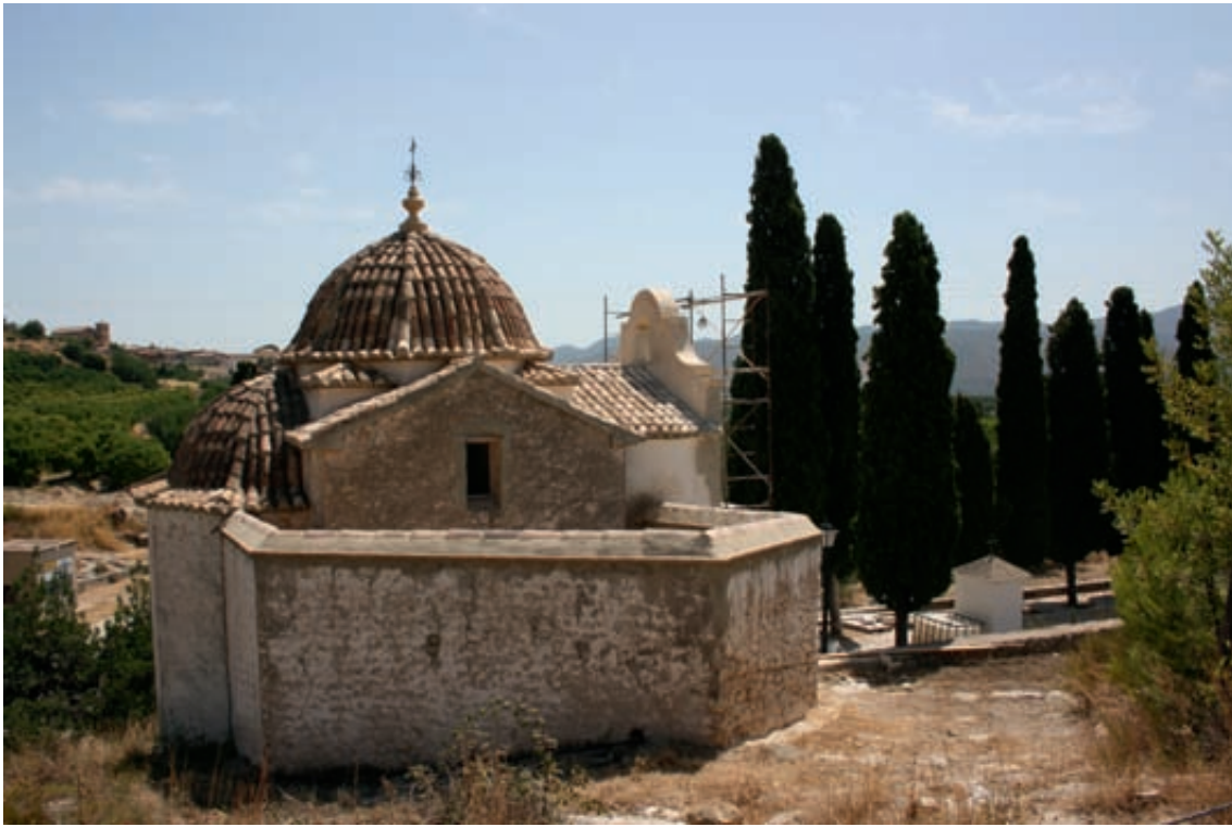
Fig. 1.- Montesa: Ermita del Calvari, vista general, 5 de juliol de 2009.

Tampoc no és massa encertada la descripció que de l'ermita del Calvari de Montesa es va fer el 1999 al volum que inicia la col·lecció Monumentos desaparecidos de la Comunidad Valenciana , on pràcticament se la presenta com a un edifici pràcticament en ruïnes: