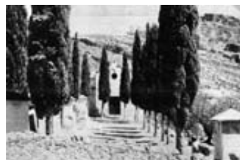
Fig. 5.- Montesa: Ermita del calvari, vista general, 30 d'agost de 1970

donaven testimoni oral alguns major de Montesa. 29 La frontera de remat esglaonat sense campanaret que hi ha hagut fins a la darrera intervenció (figs. 5), degué construir-se en aquell moment,