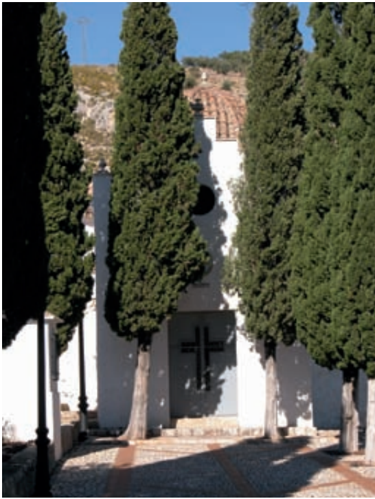
Fig. 6.- Montesa: ermita del Calvari, frontera, 13 de novembre de 2004.