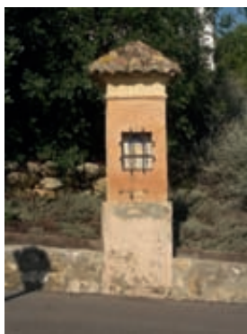
Fig. 4.- Montesa: Calvari, única caseta antiga que es conserva amb la fesomia original.

La següent intervenció de la qual hi ha constància és del 1982. Va consistir a reenteular l'ermita, col·locar-hi un paviment ceràmic actual –encara es conserva, tot i que està previst