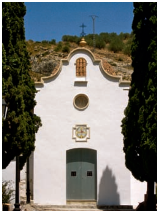
Fig. 9.- Montesa, ermita del Calvari. Frontera, estat actual.

construcció, s'ha lluit de nou amb morter de calç i sorra i s'ha emblanquinat amb calç. L'òcul central s'ha tancat amb pedra d'ònix, per tal de tamissar la llum a l'interior (fig. 9). 44