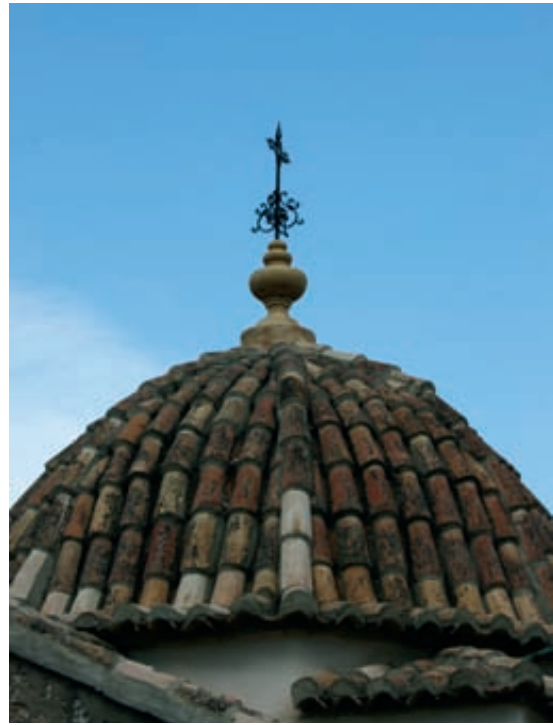
Fig. 7.- Montesa, ermita del Calvari. Cúpula, 9 de juliol de 2009.

estar novament lluída i els escalons que la remataven i la cúpula es van decorar amb unes pinyes i jarros decoratius de ciment emmotllat (fig. 6). 32