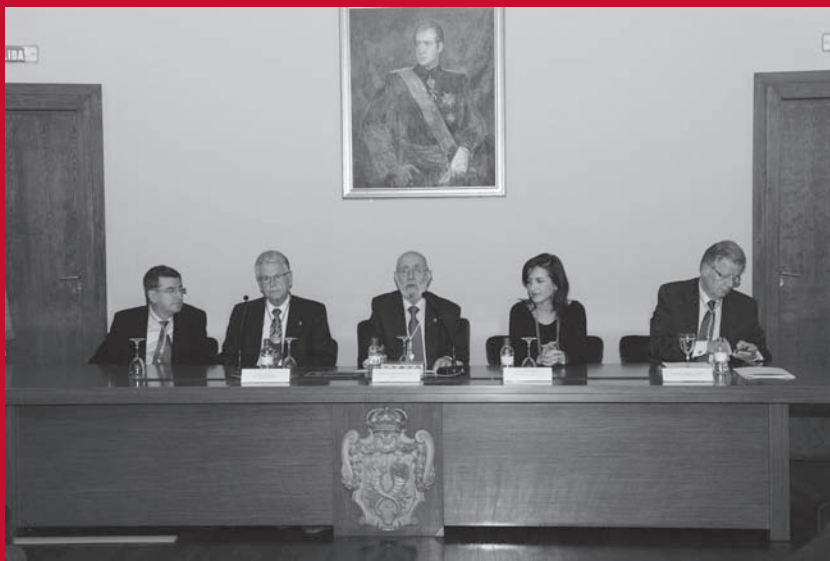
Mesa presidencial de la sesión inaugural del Curso Académico 2011-2012.