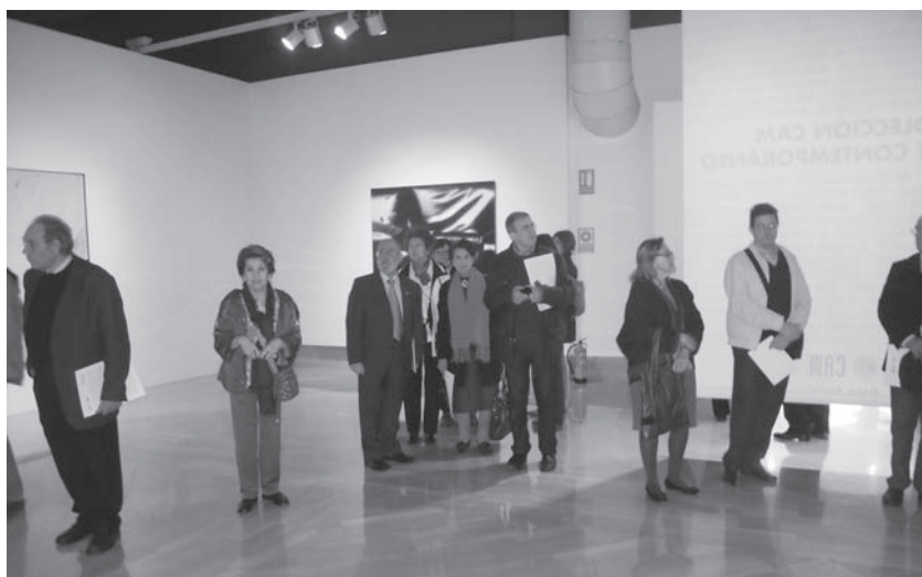
Los miembros de la Academia de Bellas Artes en su visita corporativa, el día 25 de noviembre de 2012, a la Colección CAM de Arte Contemporáneo celebrada en la Lonja del Pescado de Alicante.