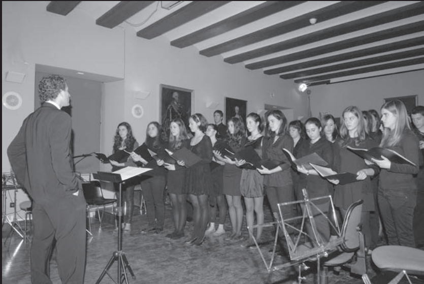
Concierto de Navidad celebrado en el salón de actos de la Real Academia el día 13 de diciembre de 2011 interpretado por la Orquesta, Cámara y Coro del Conservatorio Profesional de Música de Valencia.