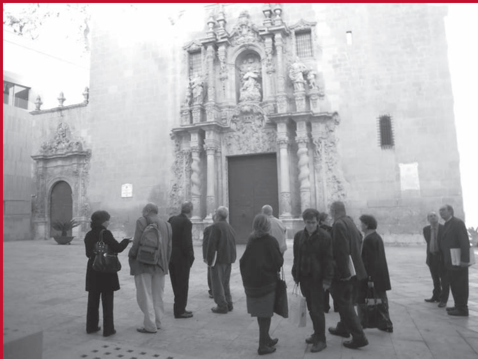
El cuerpo académico en su visita a la iglesia de Santa María de Alicante. (Foto: José Huguet).