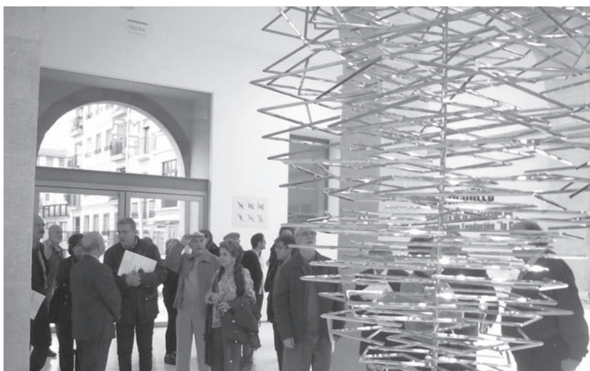
Los académicos de San Carlos en visita girada a la Institución CAMON de Alta Tecnología; y al Museo de Arte Contemporáneo de Alicante (MACA).