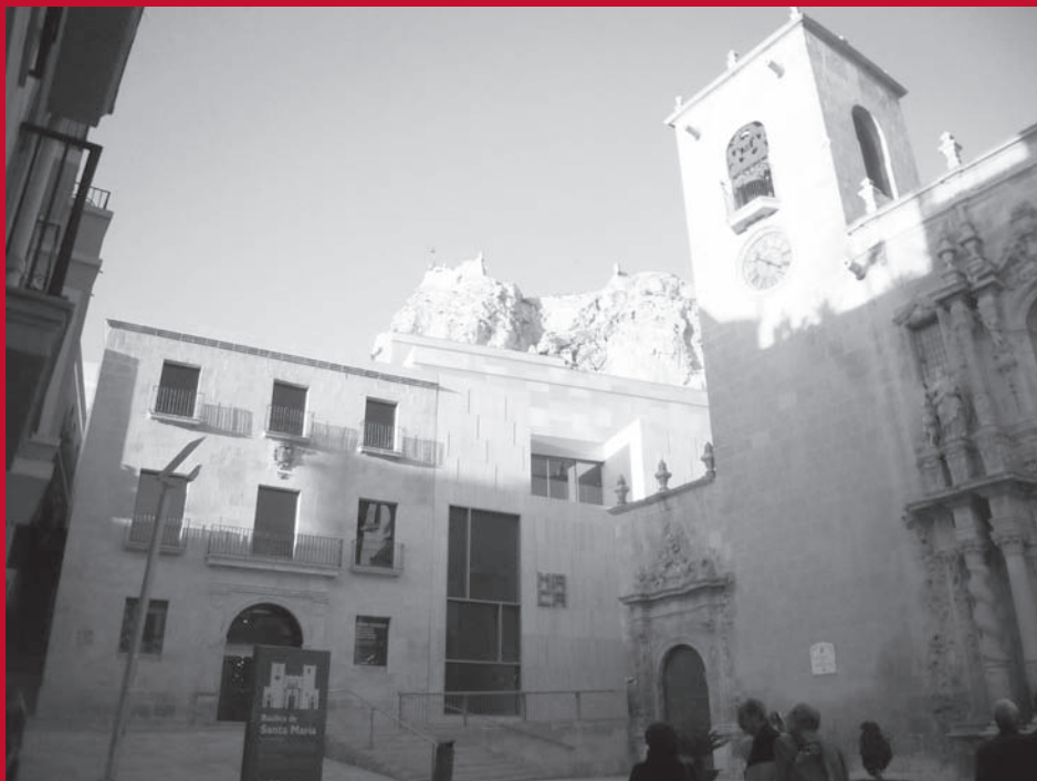
Museo de Arte Contemporáneo de Alicante (MACA).