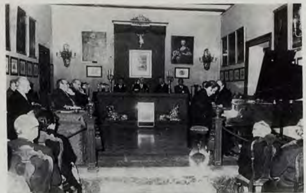
Interpretaciones musicales en la sesión conmemorativa del segundo centenario del músico y compositor Ludwig von Beethoven.