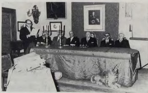
Solemne acto inaugural del ejercicio académico del año 1971

so XIII». Fue una oración brillante, cautivadora por los recuerdos, aleccionadora por las descripciones de más de un centenar de glorias de la pintura, cuya síntesis, por el espacio, es difícil de reseñar, máxime cuando una amplia referencia del trabajo se publica en este número de nuestra revista. El análisis de sus respectivas características fue la base para que, ilustradas por la erudita voz del gran historiador de arte y preclaro prócer, fueran enriquecidas y aparecieran en el relato con amplios datos biográficos y curiosas anécdotas, en su mayoría desconocidos. Una gran salva de aplausos, muy merecidos, premió esta magnífica lección. El presidente de la Academia, Sr. Goerlich, agradeció al ilustre orador la muy brillante oración pronunciada, y acto seguido