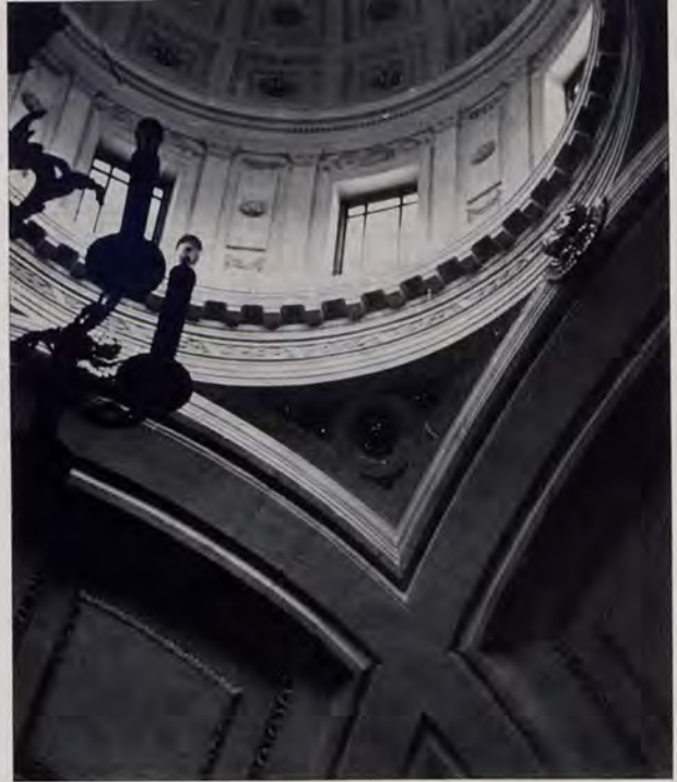
Elche. Iglesia de Santa María. Capilla de la Comunión. Sistema de cubiertas.