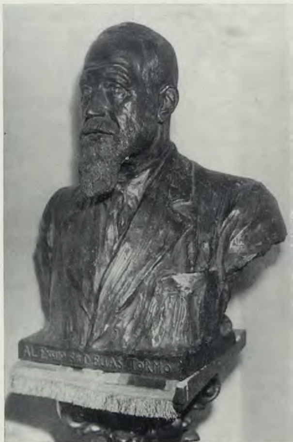
Don Elías Tormo, busto en bronce por Mariano Benlliure

chas, pero en la misma publicación, rige respecto de la fecha de su primera parte, artículo o entrega, no repitiéndose la mención por distantes que estén las demás en el tiempo. Concretamente, en alguna ocasión, que creemos única, de varias reseñas de conferencias del mismo disertante en distintos centros, alternadas o cruzadas, en fechas que una rigurosa