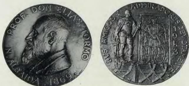
Anverso y reverso de la medalla-homenaje a don Elías Tormo, por Pérez-Comendador.

chas, pero en la misma publicación, rige respecto de la fecha de su primera parte, artículo o entrega, no repitiéndose la mención por distantes que estén las demás en el tiempo. Concretamente, en alguna ocasión, que creemos única, de varias reseñas de conferencias del mismo disertante en distintos centros, alternadas o cruzadas, en fechas que una rigurosa