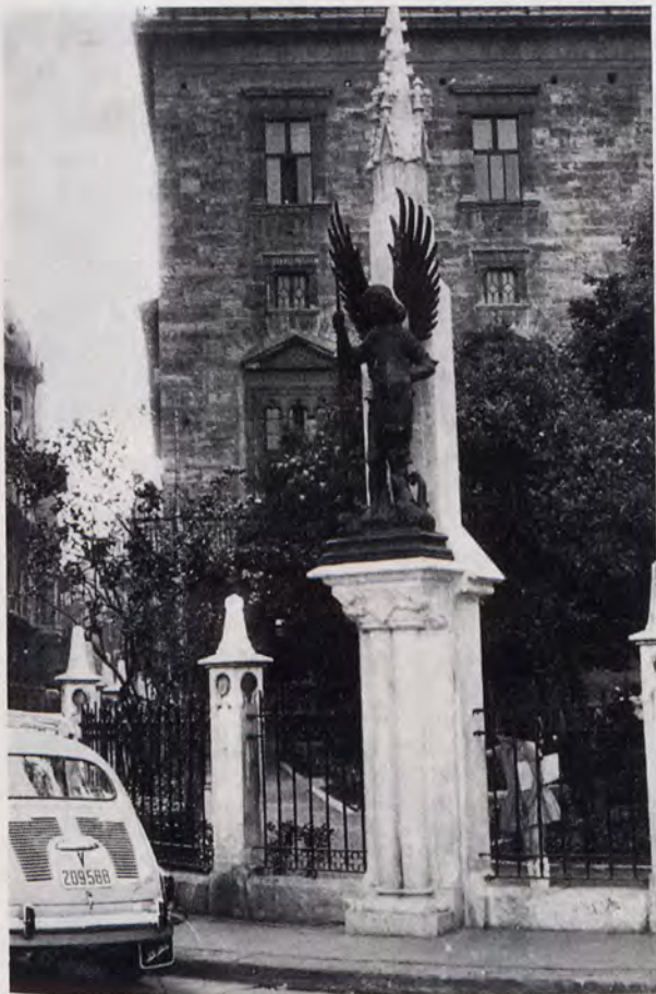
Estatua de San Miguel, versión en bronce de un original en talla gótica existente en el Archivo de la Ciudad, instalada junto al jardincillo del palacio de la Generalidad.

sitivo, que atenúe o compense, si ello es posible, aquellas bajas. Se colocó en el centro de la plaza del Portal Nuevo, frente al puente de San José, una bella estatua en bronce de la Virgen del Carmen, obra de Ramón Mateu, el laureado escultor valenciano, sobre una alta y robusta columna toscana procedente del antiguo y en buena parte, ¡ay!, derribado Hospital; se bendijo esta imagen el sábado día 4 de febrero de 1967. La iniciativa y la belleza de la imagen titular del barrio que allí se asoma al río —quizá un poco elevada para poderse «deletrear» su traza— valoran este espacio urbano y enriquecen positivamente punto tan transitado. También de Ramón Mateu es el monumental Crucificado que donó al Ayuntamiento y éste destinó al lugar principal de la restaurada iglesia gótica de Santa Catalina. Asimismo, en el año 67 se reconstruyó y situó, en la replaza resultante frente a la calle de la Visitación, cierto arco, de estilo y material propios del mudéjarismo, procedente de Tendetes, un