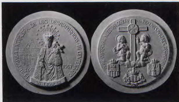
Medalla conmemorativa del III Centenario de la Real Capilla de Nuestra Señora de los Desamparados, obra de Enrique Giner.

Centenario no personal, sino monumental y afectivo, es el del edificio de la Real Capilla, hoy Basílica de Nuestra Señora de los Desamparados, Patrona de Valencia y su Región. La conmemoración, entre otras manifestaciones, dio lugar, en el terreno que más debe registrarse aquí, a una magna exposición, preparada con esmero y valiosas colaboraciones, y prácticamente exhaustiva en su contenido iconográfico antiguo, que fue albergada en los locales de la Casa de la Ciudad, tanto en su gran salón de fiestas del piso principal, como en las salas de exposiciones del Museo Histórico Municipal —antigua iglesia de Santa Rosa—, con entrada por la calle del Arzobispo Mayoral. Su cuantioso y variado con-