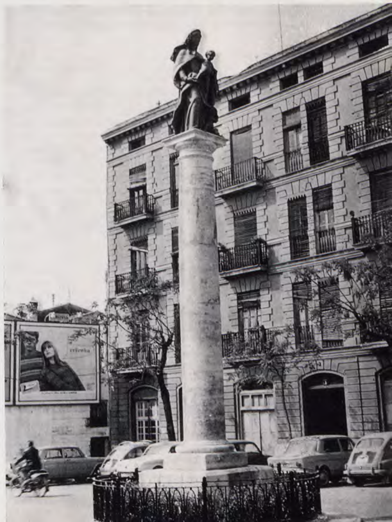
Imagen en bronce de la Virgen del Carmen, obra del escultor Ramón Mateu, instalada en la plaza del Portal Nuevo.

Otra mejora muy apreciable es la nueva fachada del teatro Principal, antes recayente a la pequeña calle de Fidalgo, hoy desaparecida y fundida con la próxima del Poeta Querol, cuyo nombre ha prevalecido y figura en dicha fachada lateral, obra promovida por la Diputación Provincial al quedar el edificio del teatro mucho más visible por la reforma de estas calles. La nueva fachada, dirigida acertadamente por el arquitecto, académico de San Carlos, doctor don Luis Albert Ballesteros, se está llevando a cabo mediante una acertada asociación de ladrillo y piedra, a tono con el neoclasicismo del inmueble, pero matizándolo, animándolo, con dicho