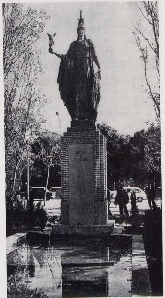
Estatua cerámica de Palas Atenea, en el Paseo al Mar, de Valencia, donada por la Fundación M. Gallego, del Museo Nacional de Cerámica.

Siguiendo la línea de esta sección en años anteriores, habría que destacar, primero, las bellas añadidas en la vía pública durante 1967. Cuando tantas pérdidas se advierten o se altera no poco el que aquí mismo llamábamos, hace pocos años, «el perfil de Valencia», buena cosa será señalar lo po-