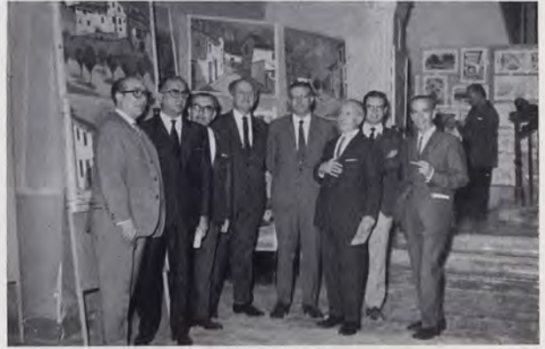
El jurado calificador de la exposición de Paisaje Enguerino, celebrada en la Casa-Ayuntamiento de Enguera.