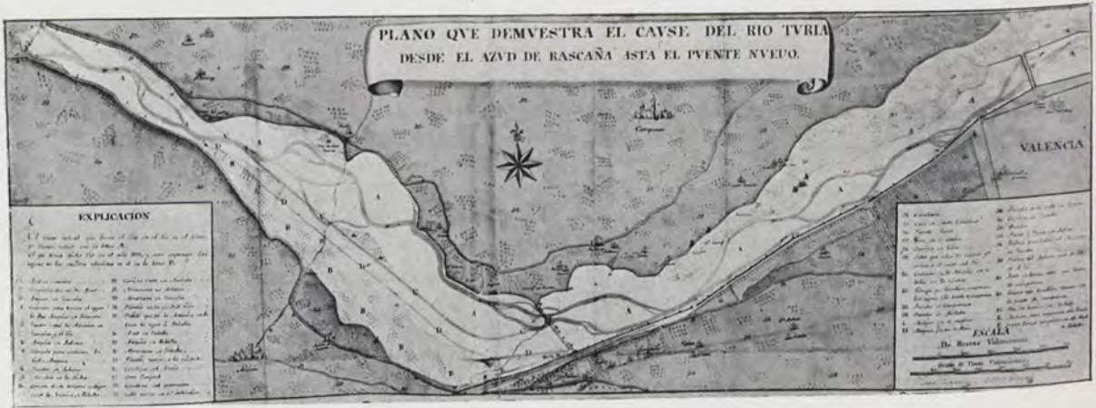
Plano del cauce del río Turia, 1788. (Al número 25 figura esta Cruz)