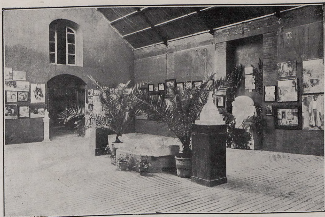
115.—Exposición de trabajos escolares