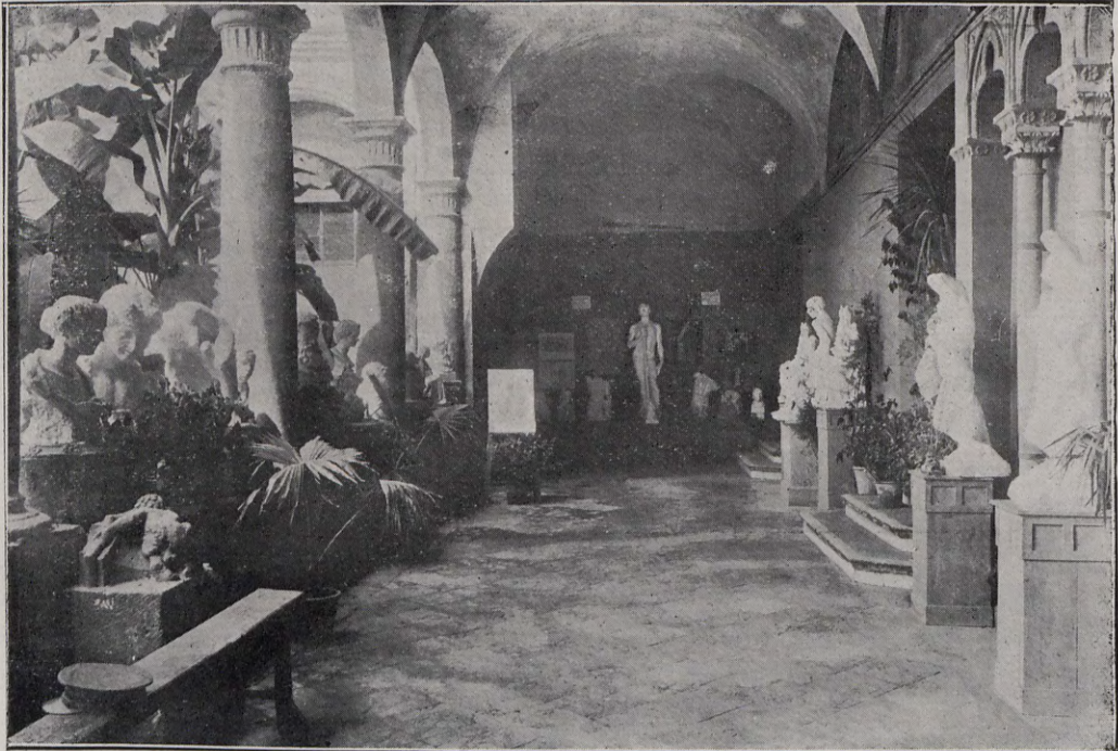
113.—Exposición de trabajos escolares

Formada en conjunto la serie de tanta laboriosidad, ha sido una verdadera revelación para los que creyeron que había sido oscurecida la fama artística de Valencia. Esta exposición ha testimoniado la esperanza de que la serie de nuestros artistas continúa, sobresaliendo en estos momentos de la historia del arte, la escultura valenciana.