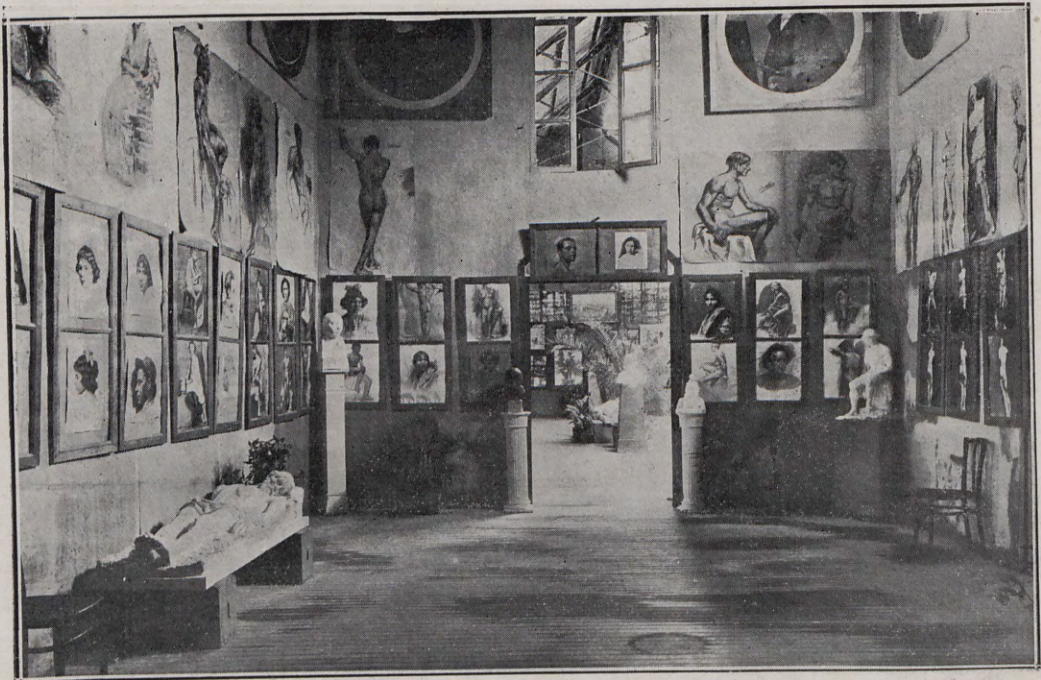
117.—Exposición de trabajos escolares