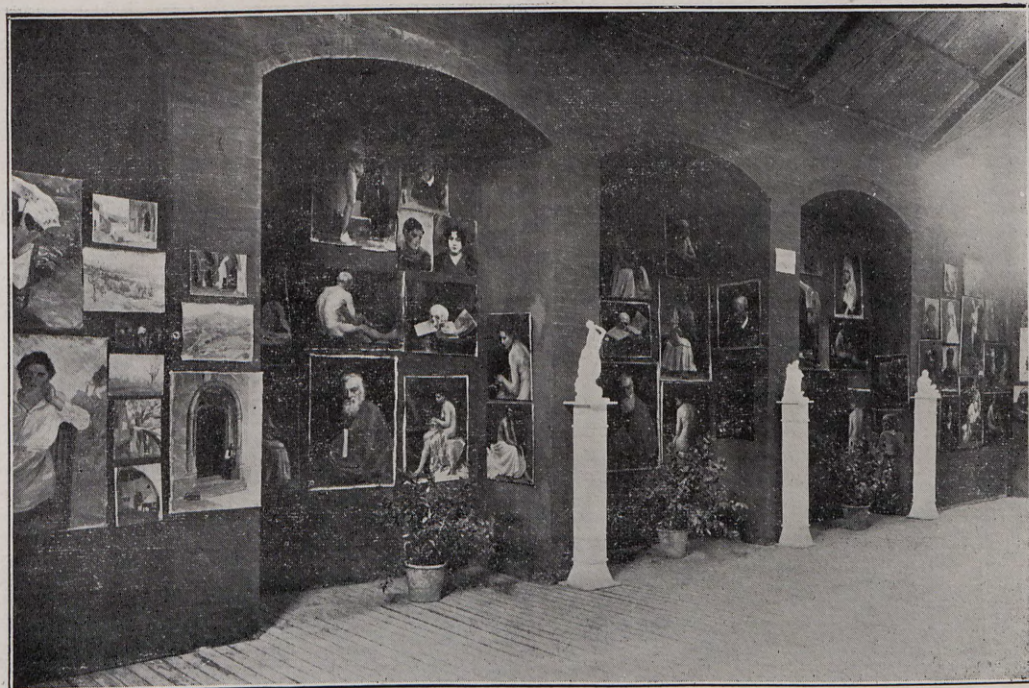
114.—Exposición de trabajos escolares