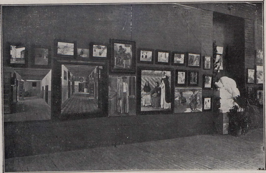
116.—Exposición de trabajos escolares