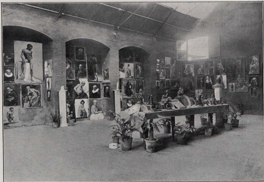
Exposición de trabajos de la Escuela de San Carlos.

admiración en la Exposición universal de arte celebrada en Venecia. El Excmo. Ayuntamiento pidió informe a esta Academia sobre el lugar donde se debía colocar dicho busto con el mo-