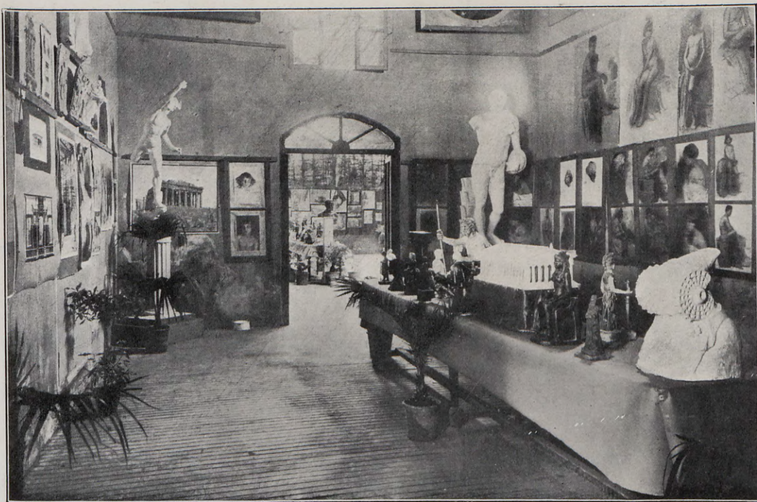
Exposición de trabajos escolares del presente curso.

El joven discípulo de esta Academia e ilustre escultor D. José Capuz, fué elegido por la Real Academia de San Fernando como uno de sus miembros. Esta Academia felicitó entusiasta-