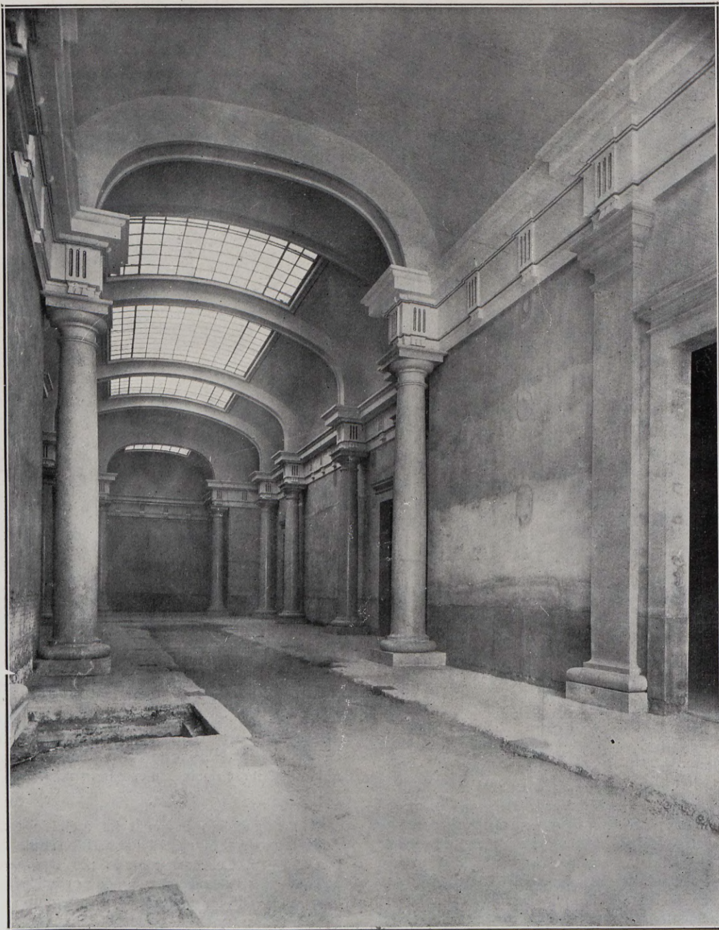
Vestíbulo de las nuevas salas de la Academia para Museo.

Han sido creados Académicos correspondientes: