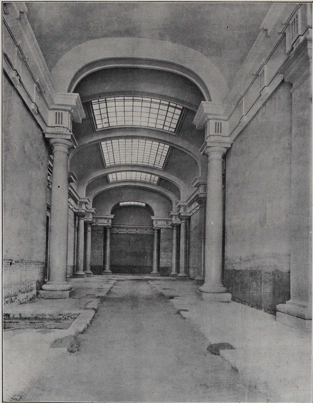
Vista general de la sala central.

D. Teodoro Llorente Falcó, bien conocido por sus continuas campañas en pro del arte y arqueología valencianos.