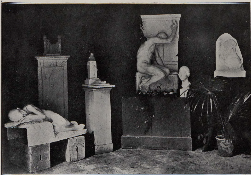
Trabajos escolares del presente curso.

tusiasmo a la manifestación de afecto que el Excmo. Ayuntamiento de la Ciudad tributó a nuestro venerado maestro, Excmo. Sr. D. José Benlliure en el acto de la entrega del título de hijo predilecto de Valencia. A dicho acto se asoció toda la población, acudiendo a la casa del