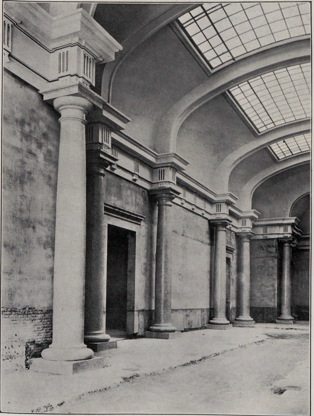
Nuevas salas de la Academia para Museo.