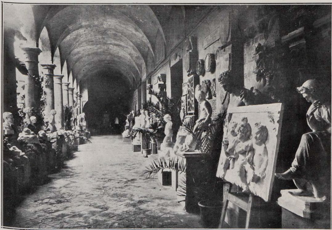
Exposición de trabajos de los alumnos de esta Escuela.

El Comité «Pro Panteón Granero», deseando obtener un acierto en el concurso para la erección de un panteón para el malogrado diestro valenciano, acudió a esta Academia rogando nombrara a uno de sus académicos para formar