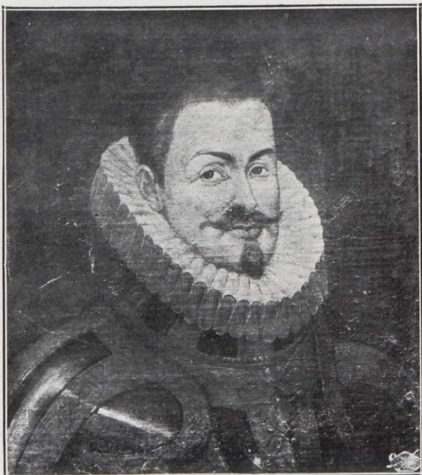
Federico Furió Ceriol, natural de Valencia, Gentilhombre de D. Felipe II.—Gran político, celebrado así por los españoles como por los italianos, ingleses y alemanes.—Murió en Valladolid, en 1592.