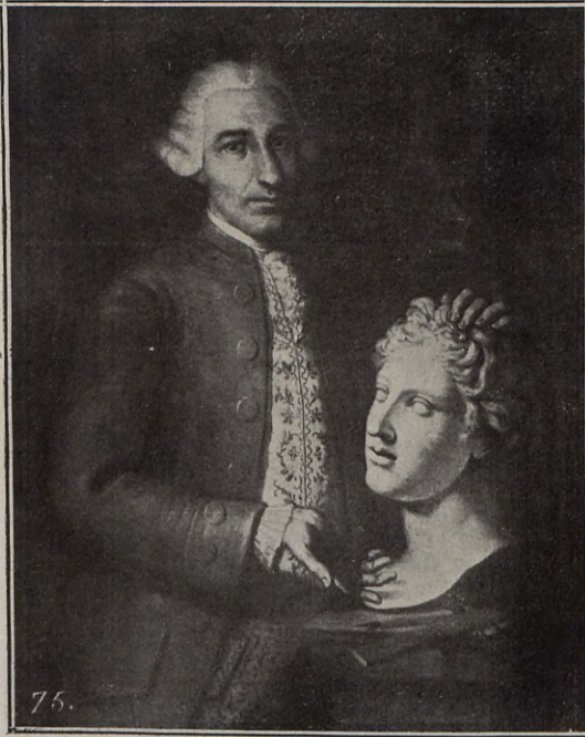
134—IGNACIO VERGARA Retrato pintado por su hermano José (Museo de Valencia)

(Arch. de San Andrés. Lib. fl. 13 v. to , n. o 126. Tm. 10, años 1723 a 34).