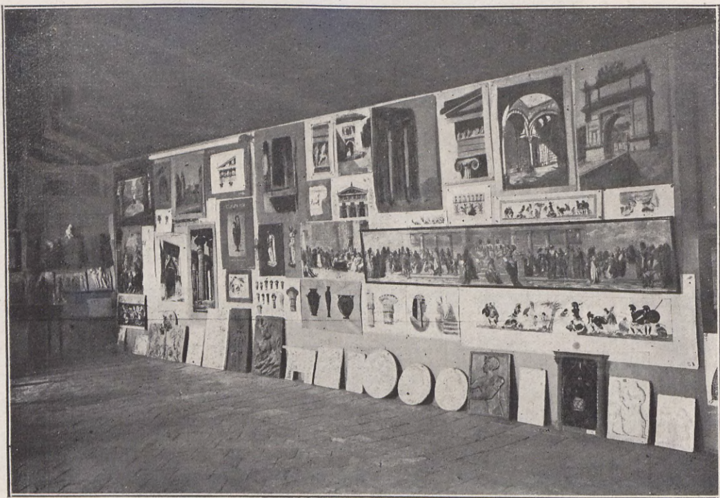
97.—Exposición de trabajos gráficos del curso