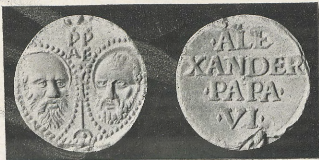
106.—RODRIGO DE BORJA Bula papal. Tipo 2.º

pedro en la barca de pescador, y como leyenda en la parte superior, ALEXANDER · PP · VI.