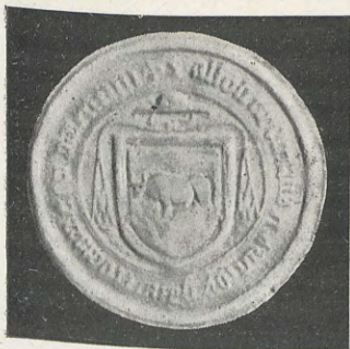
101.—ALFONSO DE BORJA Obispo de Valencia. 1429-1455