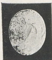
107.—R. BORJA Anillo del pescador

0'022 × 0'018 milímetros, y representa a San