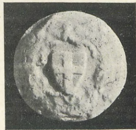
98.—VIDAL DE BLANES Contrasello

Es además uno de los casos más claros en que el sello anuncia el gusto artístico imperante en las obras de la catedral durante el nuevo pontificado. Al mismo arte ojival, con todos los detalles y características que el sello ofrece, corresponde la obra más importante debida a este obispo, la hermosa Aula capitular antigua, «augusto recinto del arte ojival» (5) , que hace sentir fuertemente la religiosidad y espiritualidad propias de este estilo, y que es una de las más preciadas producciones entre las de la catedral valenciana.