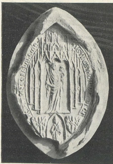
99.—JAIME DE ARAGÓN Obispo de Valencia. 1369-1396

rematadas por delgadas agujas. En la parte inferior del sello un nicho, terminado en arco apuntado, y dentro un obispo, de frente, con las manos unidas en actitud de orante, y báculo apoyado en el hombro izquierdo. A ambos lados el escudo del obispo, cuartelado en soter, el 1.º y 4.º palos, y el 2.º y 3.º flores de lis. La leyenda, en letras ojivales, extendida desde el doselete a los escudos, dice: : SIGILLUM : IACOBI : DI : GRACIA : EPISCOPI : VALECIE .