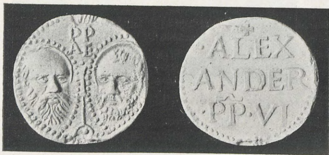
105.—RODRIGO DE BORJA Bula papal. Tipo 1.º

En los del primer grupo (3) las cabezas de S. Pablo y S. Pedro no son los modelos arcaicos de las de Calixto III, sino cabezas en los que se copia el natural; y la leyenda, SPA SPE, no está en línea recta, sino en dos paralelas de letras superpuestas. El reverso, tratado al modo de los de Calixto, dice: \frac{+}{-} | · ALEX | ANDER · | · PP · VI ·