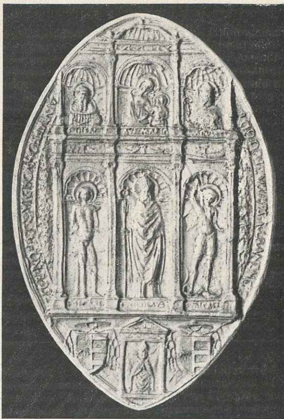
104.—RODRIGO DE BORJA Sello pendiente

El fragmento (7) del sello pendiente lo es del usado durante su legación en España. Es ya conocido, pues ha sido publicado con un detenido estudio por el Sr. Tormo (8), utilizando un ejemplar custodiado en el Archivo Histórico Nacional (9). Es tal su mérito, que en lugar de dar en este trabajo el fragmento de Valencia, se reproduce y estudia el ejemplar de Madrid, no obstante no ser inédito