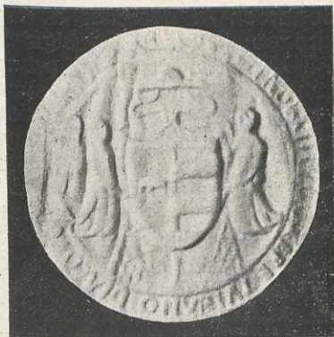
105.—RODRIGO DE BORJA Obispo de Valencia. 1458-1492 Placa

Es el más antiguo en fecha el de placa, en documento expedido en Roma a 17 de Enero de 1466 (4). Es circular, de 045 milímetros; representa