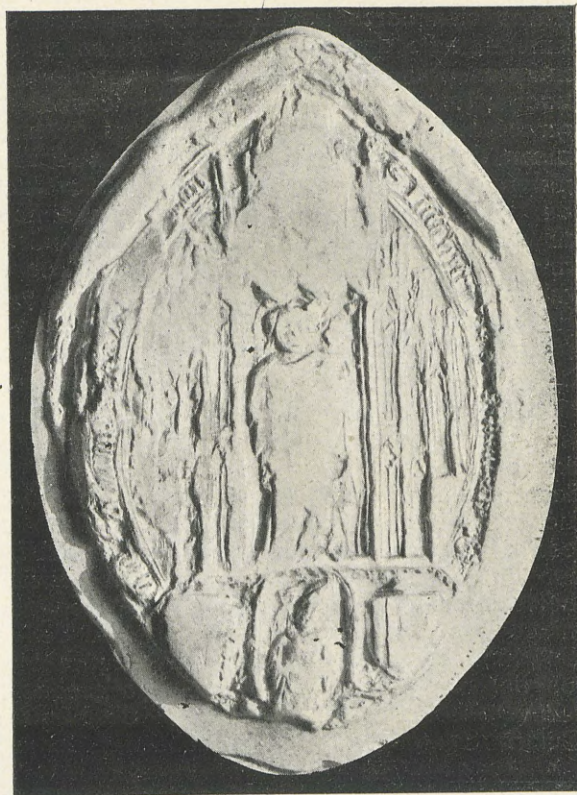
100.—JAIME DE ARAGÓN Cardenal, Obispo de Valencia

Hugo de Lupia y Bages, 1398-1427. —Muerto Jaime de Aragón, estuvo la sede de Valencia vacante algún tiempo y regida por un vicario nombrado por el papa (4) . Transcurridos unos dos años, y accediendo el pontífice a las reite-