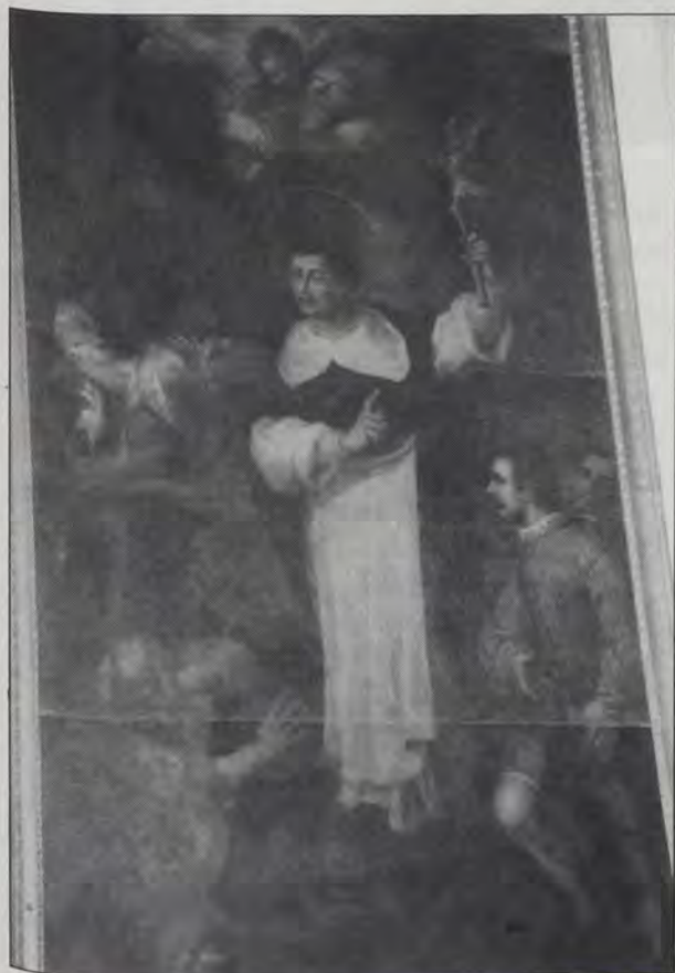
Predicación de San Vicente Ferrer a los judíos. V. Inglés

Siguiendo el criterio de que hay que dejar las cosas como están (25), los repristinadores no continuaron los contrafuertes rematados en pináculos, ni repusieron el gablete