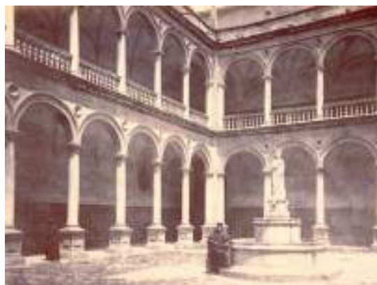
Fig. 2.- La fuente con la añadida figura de “la palletera”, 1870.

En 1562 Álvaro de Bazán iniciaba en El Viso las obras de su “palacio genovés”, siguiendo las trazas de los palacios de Strada Nuova que ha visto se están construyendo en Génova, obra que ha encargado al solicitado Giovanni Battista Castello “el Bergamasco”. Años después, en abril de 1569, cuando ya debe estar casi finalizada la obra y se están acometiendo los trabajos de decoración, se contratan en Genova cuatro nuevos operarios, entre ellos a Jacopo Semería, perteneciente a una conocida familia de artífices genoveses, los cuales al parecer no llegaron a realizar el viaje 42 .