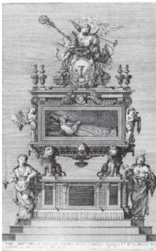
Fig. 3.- Sepulcro del Patriarca Ribera.