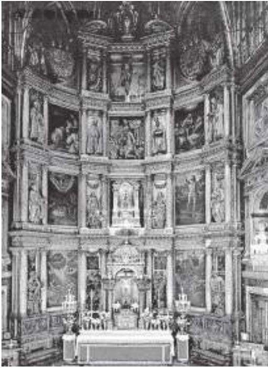
Fig. 4.- Guadalupe. El retablo en la actualidad.