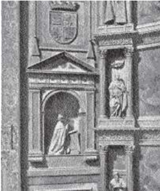
Fig. 5.- La hornacina con el orante Enrique IV, en el lado derecho del presbiterio.