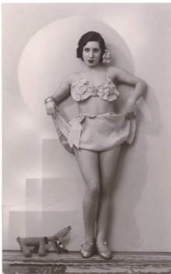
Fig. 9.- Vedette, sin fecha. Biblioteca Valenciana Nicolau Primitiu. Colección J. Huguet.

incorporase a su gabinete. La labor de la galería, al igual que otros colegas de su categoría, la asumía directamente sin delegarla en ninguno de sus colaboradores, siempre era él mismo quien disparaba las instantáneas. Las suscripciones a publicaciones internacionales tales como los magazines LIFE, Harper's BAZAAR y en especial PHOTOGRAPHY le proporcionaban información y mantenían al tanto de lo que se producía en el extranjero. También mantuvo relaciones con destacados artistas de su época ya fueran fotógrafos o pertenecientes a otras disciplinas artísticas.