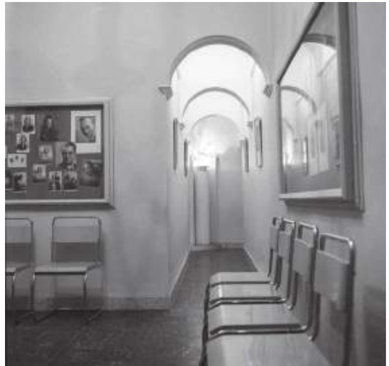
Fig. 2.- Recepción del estudio de Ferri, sin fecha.

y dos prensas de hierro fundido, un caballete de retoque, varias cizallas, una esmaltadora, lupas y demás utensilios, sellos secos o de tinta y paspartús, donde se enmarcaban las fotografías con gran diversidad de diseños. Todo debidamente organizado y a la espera de que las copias de papel reveladas, fijadas, lavadas y ya completamente secas salieran del laboratorio.