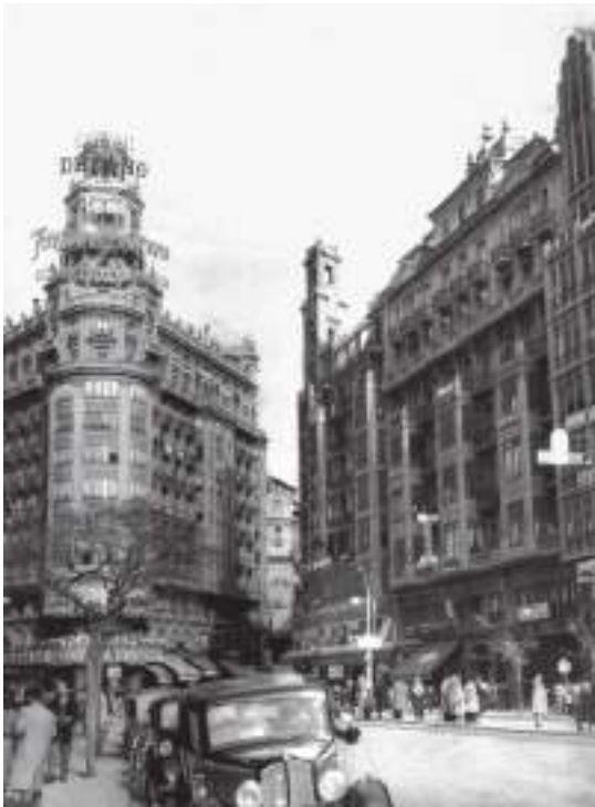
Fig. 1.- Fachada del edificio del estudio de Ferri, sin fecha.