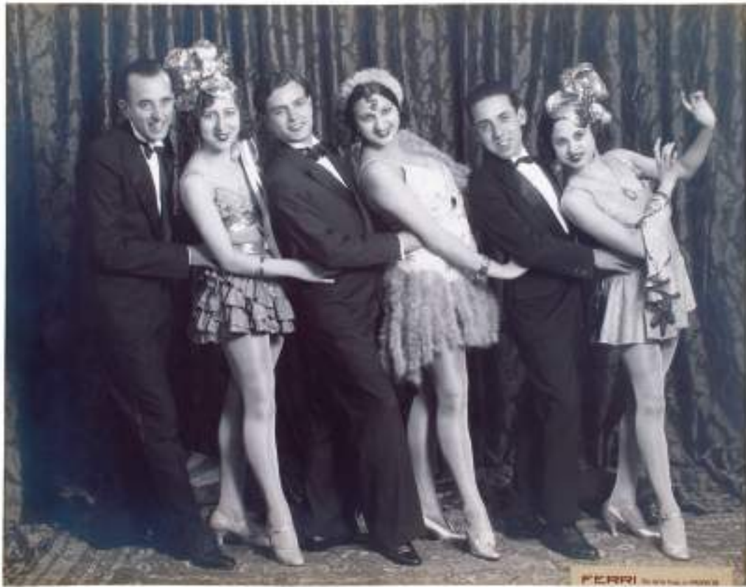
Fig. 8.- Seis bailarines en escena, sin fecha. Colección Juan José Díaz Prósper.

su mejilla y el labio inferior, matiza la expresión justa que precisa la figura del poeta y definen a la perfección su extrema sensibilidad. Este retrato se realizó en el estudio de cine de la calle Palleter en el año 1930.