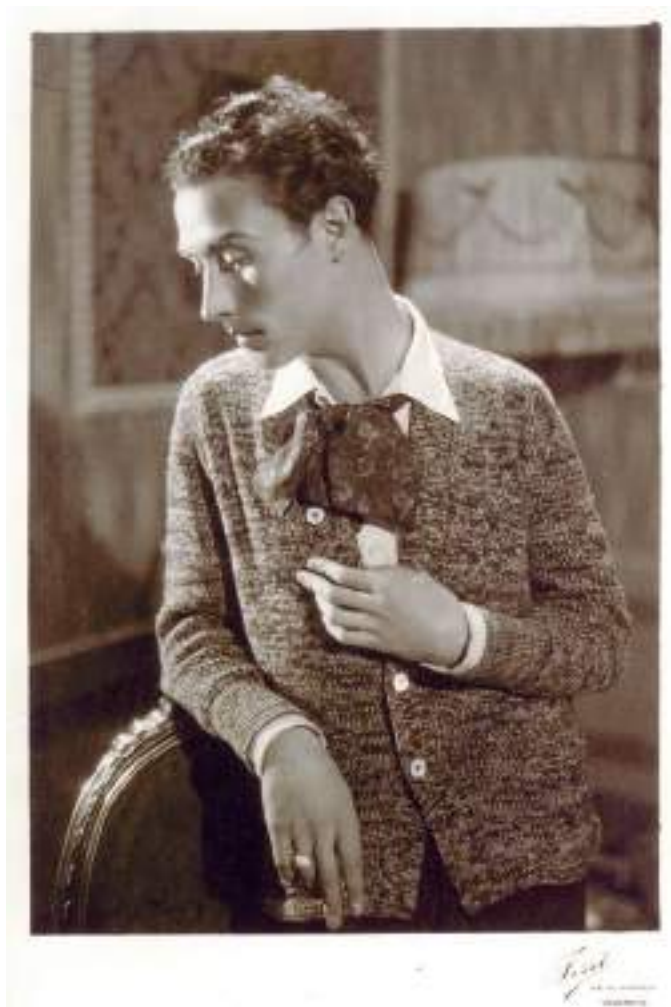
Fig. 7.- Juan Gil Albert, 1930.

ataviada con una sofisticada pabela que sujeta con su mano derecha manteniendo en su izquierda un ramillete de flores. Este retrato fue realizado a la gran actriz en plena juventud en su estudio de la calle Pie de la Cruz, 6 a mediados de los años veinte.