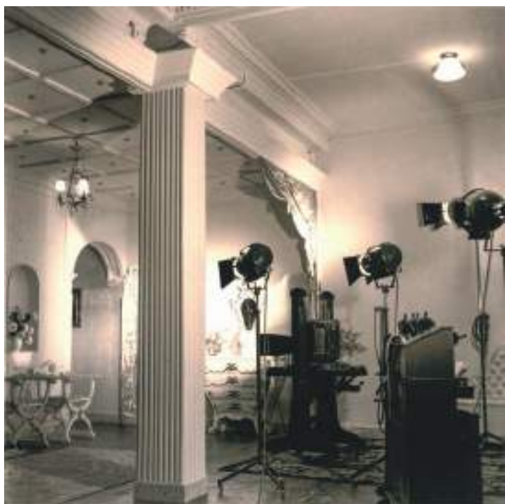
Fig. 3.- Galería del estudio de Ferri, sin fecha. Colección Andrés Giménez.