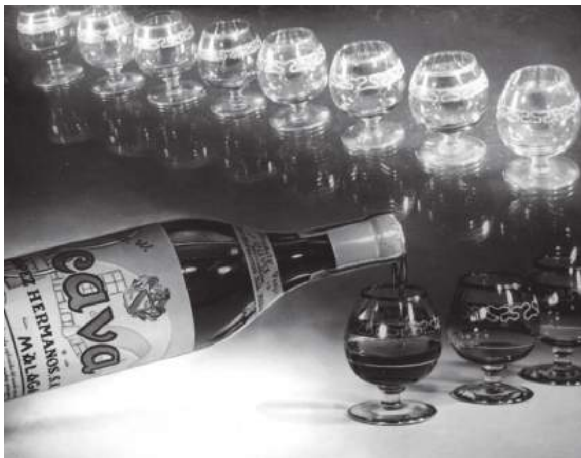
Fig. 10.- Desfile de copas. López Hermanos. Collage, 1955.

fotográfico (Kodak, Agfa, etc.) como de cámaras profesionales, utensilios y maquinaria de los laboratorios que desaparecieron casi por completo. Ferri consciente de esta situación, dio un giro a su actividad y fue decantándose a favor de la fotografía publicitaria e industrial de incipiente desarrollo en aquel tiempo, a la que se dedicó los últimos años de su vida profesional, colaborando con las agencias publicitarias más destacadas del momento como Publicidad Lanza, Canut & Bardina, Publicidad Ballesta, y Simeón Durá. Fotografó todo tipo de productos de la gran industria y el comercio. Estas empresas publicitarias le concedieron total libertad en su trabajo logrando sugestivas presentaciones para anuncios y muestrarios (Fig. 10).