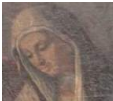
Figs. 3 y 4.- Comparativa de los rostros de Santa Ana en la obra de Luca Giordano y Genaro Sarnelli.