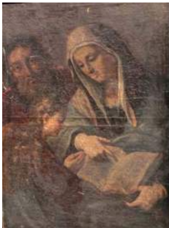
Fig. 1.- Educación de la Virgen.

A partir de este momento establecemos la metodología que se aplicará a la pintura. Primeramente realizaremos un acercamiento al artista como tal para conocer los aspectos importantes de su vida y que, posiblemente, influyan en su estilo. Seguidamente pasaremos a tratar el cuadro como tal mirando los aspectos formales de la obra. A continuación haremos un recorrido por las posibles influencias detectadas en la obra comparándola con otras. Por último trataremos el tema empleado y algún motivo por el cual se representó.