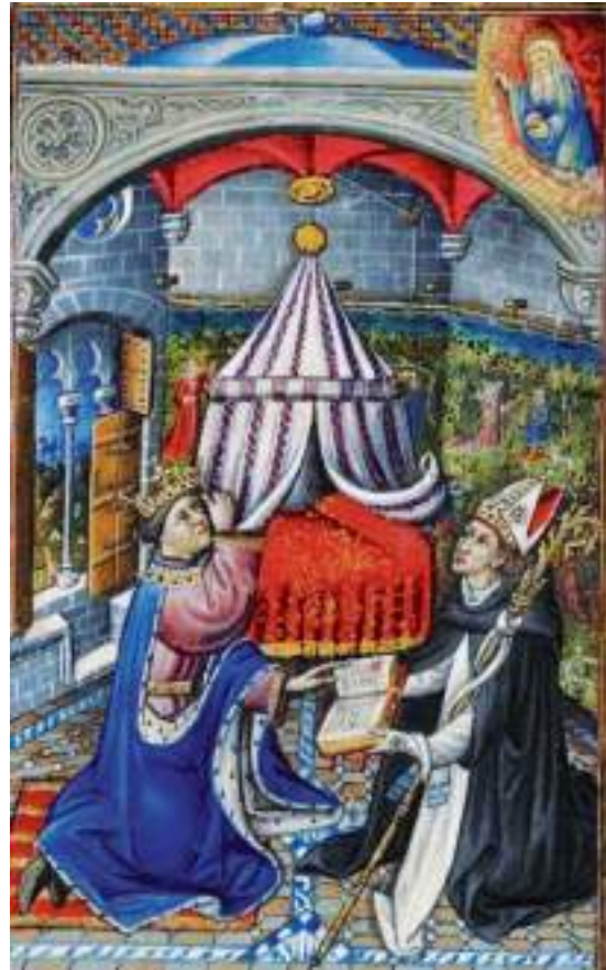
Fig. 4.- CRESPI, Lleonard: Salteri-Llibre d'Hores d'Alfons el Magnànim . British Library, ms. 28962, Londres, fol. 14v.

d'un retaule elaborat a la ciutat de València. Concretament, la Batalla del Puig del Retaule del Centenar de la Ploma (ca. 1400-1405), atribuït a Marçal de Sax, on Jaume I encapçala l'exèrcit cristià encoratjat per l'aparició de sant Jordi. Així mateix, Lleonard emprà el mateix esquema compositiu. 13 Reconegut com Alfons V, la imatge figura el concepte de miles christi . Des de jove el Magnànim freqüentà els afers bèl·lics; son pare Ferran conquerí Antequera contra els musulmans, àdhuc, ja com a rei, vers 1453, tenia en ment un projecte de croada contra el turc. 14 A més, el monarca, com els seus predecessors, confirmà els privilegis del Centenar de la Ploma, i igual que ells, va veure en sant Jordi un arquetip de cavaller medieval.