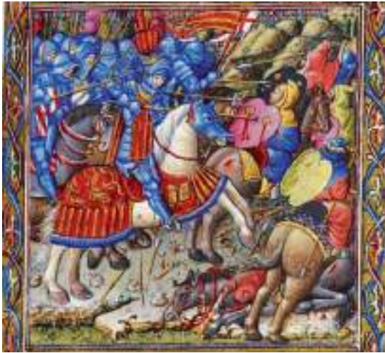
Fig. 3.- CRESPI, Lleonard: Salteri-Llibre d'Hores d'Alfons el Magnànim . British Library, ms. 28962, Londres, fol. 78r.