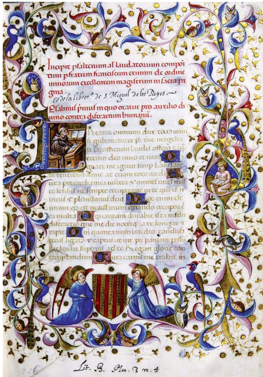
Fig. 5.- CRESPI, Lleonard: Salteri o Laudatori de Francesc Eiximenis . Biblioteca Històrica de la Universitat, ms. 726, València, fol. 1r.