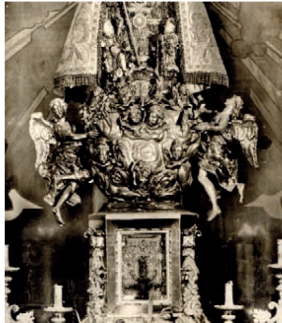
Fig. 2.- Trono y peana del platero Salvador Miquel. Foto cercana a 1920.

piEDAD de sus devotos”, anunciándole la visita al día siguiente en su domicilio para dicho propósito del marqués de la Escala, “protector de esta obra” y otros señores. 7