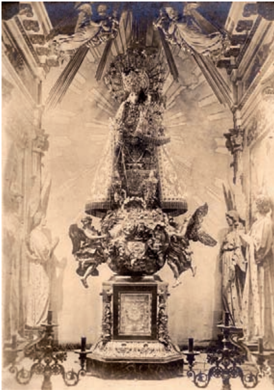
Fig. 1.- La Virgen de los Desamparados sobre el trono dieciochesco, girada hacia el camarín y con la corona de perlas anterior a la de la coronación de 1923.