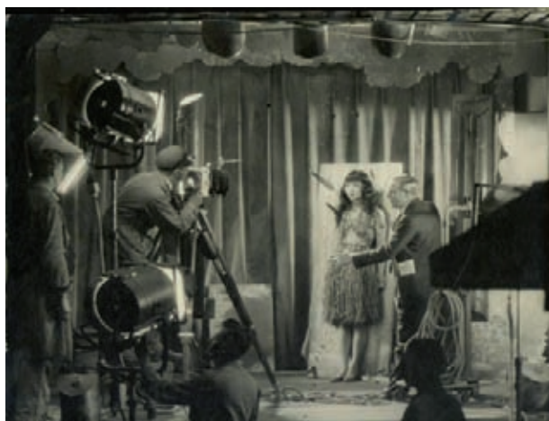
Fig. 4.- Rodaje de una secuencia de lanzamiento de cuchillos en los estudios de la UFA (Alemania, años veinte)

Kracauer empieza De Caligari a Hitler (1947) formulando la tesis central del libro, a saber, que «pueden revelarse, por medio de un análisis del cine germano, las profundas tendencias psicológicas dominantes en Alemania de 1918 a 1933». 8 El adjetivo «psicológico» no se ha de tomar al pie de la letra, puesto que no se refiere a la necesaria actividad mental que relaciona el sistema narrativo y el sistema estilístico de cada película. 9 Lo psicológico se refiere aquí a un factor que va más allá de las explicaciones históricas en términos «de los cambios económicos, de las exigencias sociales y de las maquinaciones políticas». 10 Se trata de un factor que ya había sido buscado por otros investigadores de la Escuela de Fráncfort (él cita explícitamente a Franz Neumann y Erich Fromm) y que Kracauer formula apelando al «secreto», como en el caso de su biografía de Offenbach, puesto que «existe una historia secreta que abarca las tendencias íntimas del pueblo alemán». Por ello, «las películas de una nación reflejan su mentalidad», y lo hacen de una manera más directa que otros medios artísticos por dos razones: primero, porque las películas son siempre una obra colectiva y, segundo, porque «se dirigen e interesan a la multitud anónima», es decir, a la masa. 11