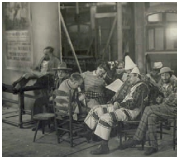
Fig. 6.- Un descanso en el rodaje en los estudios de la UFA (Alemania, años veinte).

Las espejeantes aguas del charco reflejando un trémulo paisaje urbano (lo físico y lo social). Igual que en De Caligari a Hitler tenemos que ser cautos con el uso que hacía Kracauer del término «psicológico», aquí también hemos de tomar precauciones para no incurrir en una lectura precipitada del carácter «fotográfico» del cine. No se trata solo de que las películas retraten la realidad, sino más bien que «se adhieren a la superficie de las cosas», 27 al «tembloroso mundo de arriba en el charco turbio». Mientras que la pintura, la literatura, el teatro, etc., «incluyen a la naturaleza», el cine la representa de una manera que podríamos llamar «táctil». En el trasfondo de lo expuesto en el libro hallamos esbozada una teoría sobre el «tacto», que aparece explicitada en su libro póstumo.