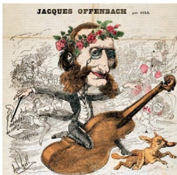
Fig. 5.- Caricatura de Jacques Offenbach (1819-1880).

Pero además, en su libro sobre Offenbach, Kracauer apuntaba a un asunto nuclear en el establecimiento de una Teoría Crítica y su concepto de praxis, a saber, la formulación de un mecanismo por el cual no solo se interpreta el orden social vigente, quedando en evidencia y patente su secreto, sino que también se explica su transformación. Veamos un ejemplo: