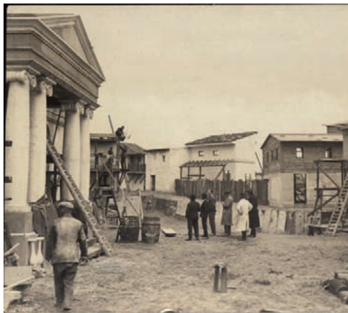
Fig. 2.- Decorados de los estudios de la UFA (Alemania, años veinte), Fotografía anónima. Archivo Life.

Es menester recordar que el cine nació en 1895 por obra de Lumière como género documental, estrechamente emparentado por ello con la práctica de la fotografía documental y monocroma de la época (paisajista, costumbrista, periodística, etnográfica, etc.). En cierto modo, la producción documental de Lumière puede considerarse como una prolongación cinética de la práctica fotográfica documental de finales del siglo XIX [...] La tradición historiográfica ha convertido a Méliès en fundador, maestro y modelo estilístico del llamado «teatro filmado» [...] Hombre de teatro y prestidigitador, el francés Georges Méliès ha pasado a la historia como el inventor del nuevo estatuto del cine inmediatamente posterior a Lumière, gracias a su triple invención: la puesta en escena, el cine narrativo, el cine concebido como espectáculo popular. 7