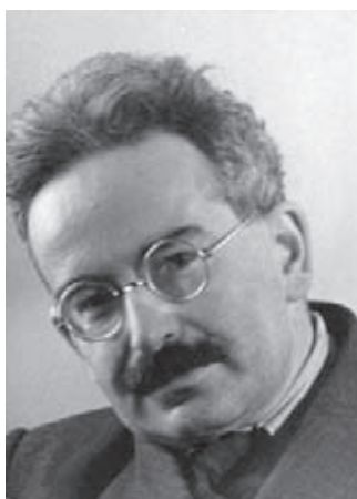
Fig. 1.- Walter Benjamin (1892–1940).

Y es en esa misma línea, pero en una dirección radicalmente opuesta, que Walter Benjamin considera el cine no como el séptimo arte , sino como la instancia técnica que pone en tela de juicio la vigencia del gran arte, del arte aurático en general. Para él, como para Kracauer, la idea de que la fotografía y el cine son artes se suele imponer a costa de la autonomía misma de la fotografía y el cine.