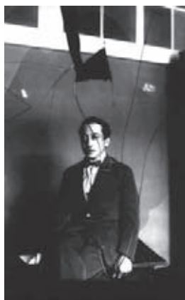
Fig. 7.- Kracauer a través del espejo.

El principio «lado-a-lado» que he propuesto aquí se aplicará entonces tanto a las relaciones entre lo atemporal y lo temporal como a aquellas entre lo general y lo particular. 30