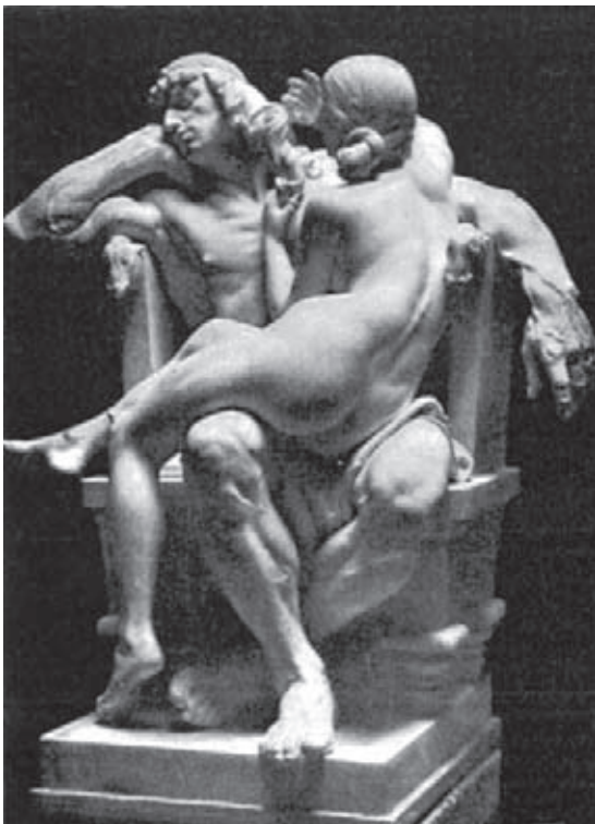
Fig. 6.- ALSINA, A.: Astucia y Fuerza , Medalla de Oro en la Exposición Internacional de París de 1900.