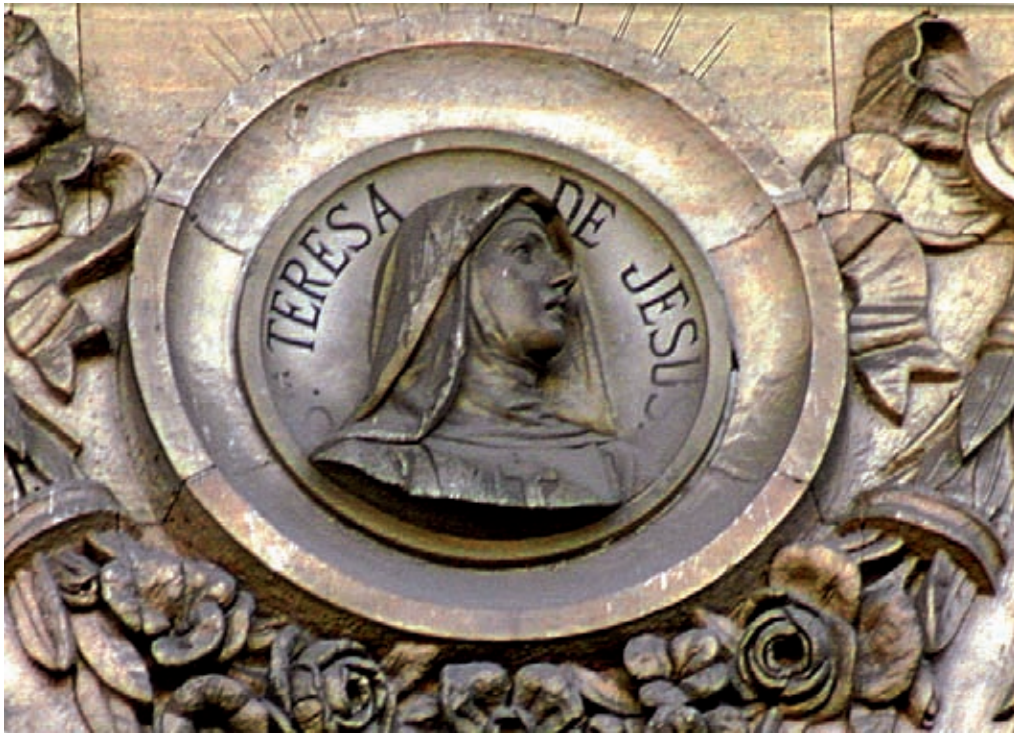
Fig. 3.- ALSINA, A.: Medallón de Santa Teresa de Jesús , fachada principal de la Biblioteca Nacional de Madrid