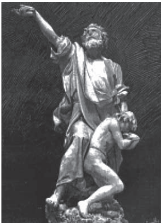
Fig. 1.- ALSINA, A.: Sacrificio de Isaac , 1887

conjunto contrastado por la figura joven, tierna y obediente de Isaac, y la robusta y enérgica del anciano Abraham, que pleno de fe y con tristeza y gran dolor se dispone a descargar el golpe mortal sobre su único hijo. El niño arrodillado junto a los pies de su padre, y tomando con ambas manos la de este, para besarle cariñoso, dobla resignada la cerviz, para recibir el golpe mortal. El anciano padre alza sus ojos al cielo y blandiendo con la mano derecha el cuchillo de su martirio. Si la composición es buena, la