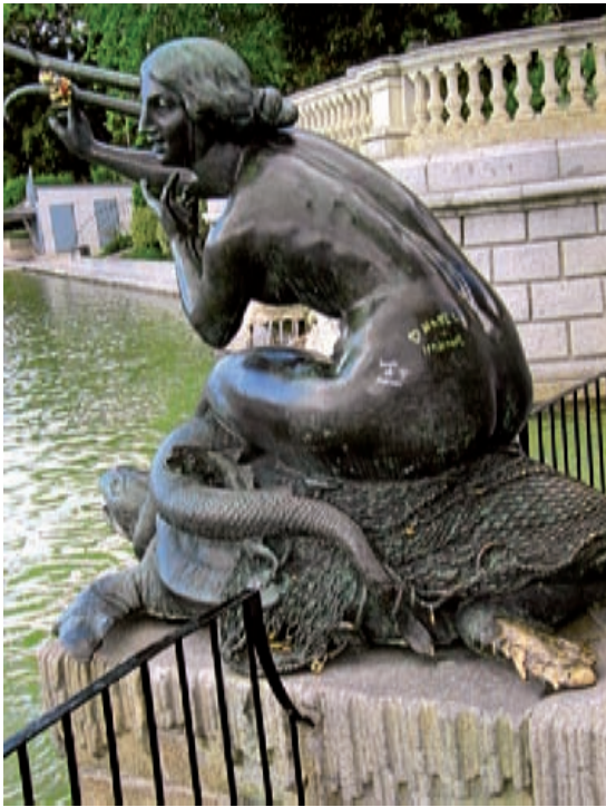
Fig. 7.- ALSINA, A.: Sirena . Bronce. Monumento al rey Alfonso XII en el parque del Retiro de Madrid