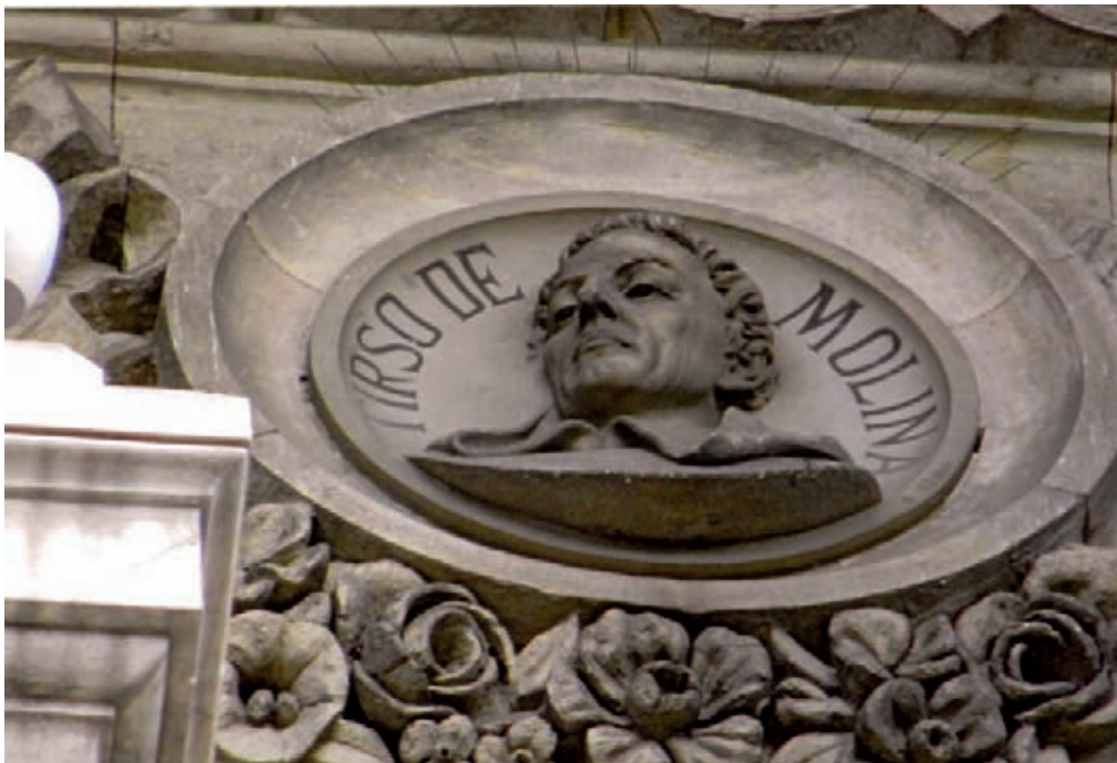
Fig. 4.- ALSINA, A.: Medallón de Tirso de Molina , fachada principal de la Biblioteca Nacional de Madrid