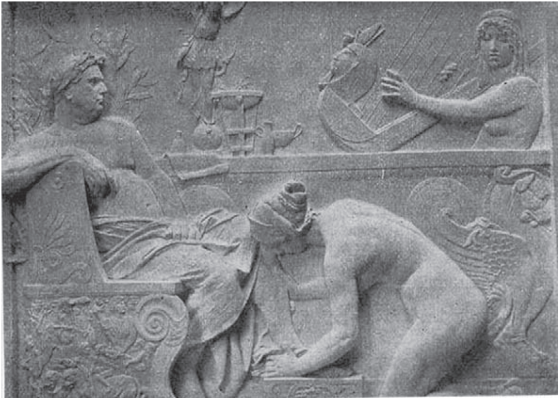
Fig. 5.- ALSINA, A.: Imperio Romano , bajo relieve en yeso, 1898.