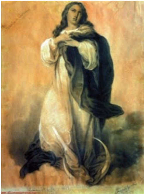
Fig. 4.- Concepción de los Venerables, 1879.