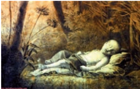
Fig. 5.- Niño dormido, 1879.

De cada una de las asignaturas habían una serie de premios de primer, segunda y tercera clase., que los iba otorgando las Escuelas gracias a las donaciones de los socios y entidades que honraban con sus regalos de forma filantrópica y humanitaria. En estos años que estuvo en las citadas Escuelas, obtuvo los siguientes premios: