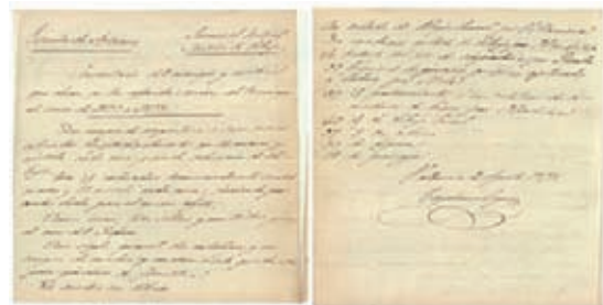
Fig. 6.- Inventario del aula de dibujo, 1878. 3

Cayetano Capuz dispuso de una amplia aula de dibujo en el viejo edificio llamado Na-Monforta, situado en la Plaza de las Barcas de Valencia, tal y de la cual conocemos su disposición gracias al inventario del año 1878, que adjuntamos a continuación: