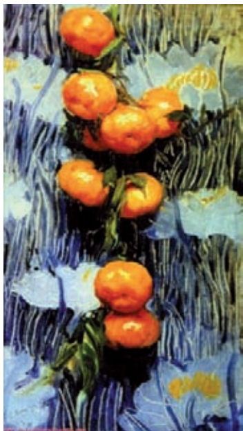
Fig. 9.- Ramillete de mandarinas, 1904.