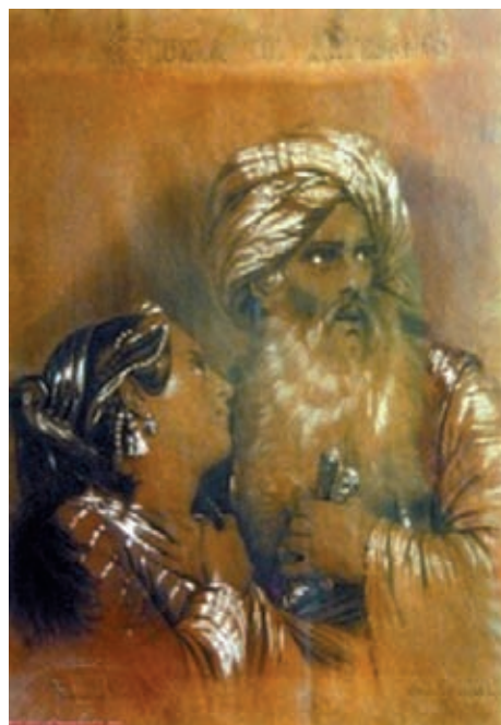
Fig. 3.- Pareja de árabes, 1878.