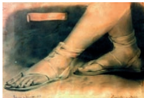
Fig. 2.- Estudio de Pies, 1878.

Este periodo de tiempo y como consecuencia de sus prácticas, realizo numerosas pruebas, dibujos y trabajos, de los cuales se conservan cuatro esplendidas obras, conocidas como “Principios de Sorolla” (Estudio de pies, Pareja de árabes, Concepción de los Venerables y Niño dormido) que se conservan en las mencionadas Escuelas de Artesanos.