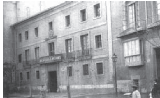
Fig. 1.- Fotografía de la Sede Central de las Escuelas de Artesanos a finales del siglo XIX, en la calle de las Barcas.

Con respecto a la enseñanza, España, parece que estaba señalada con una línea negra en el mapa del adelantamiento intelectual de Europa y era preciso un esfuerzo heroico para salir de este deshonoroso estado y a Valencia le cabe la honra de haber iniciado el movimiento que haría que naciera la ilusión para que nos pusiéramos a nivel de las naciones más civilizadas.