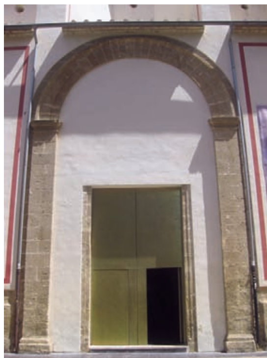
Fig. 5.- Portada del siglo XVIII (imagen del autor)

paredes colgaban Veinte , y un Lienzos de diferentes Ymagenes, Echuras, y guarniciones , a la vez que nos informa de la presencia de Nueve Confesionarios Cerrados, de Madera de Pino de una misma Echura, Diez, y seis bancos del mismo material , así como de Un Canzel de la mesma Madera en la puerta de la iglesia. Por último, el inventario nos permite datar también la pequeña espadaña existente en la actualidad que debió ser ejecutada al concluir la iglesia y, en todo caso, antes de la expulsión de 1767, haciendo referencia a la Campana principal de la Yglesia del Colegio colocada en su Arco, enzima de la mesma . El recubrimiento original del templo