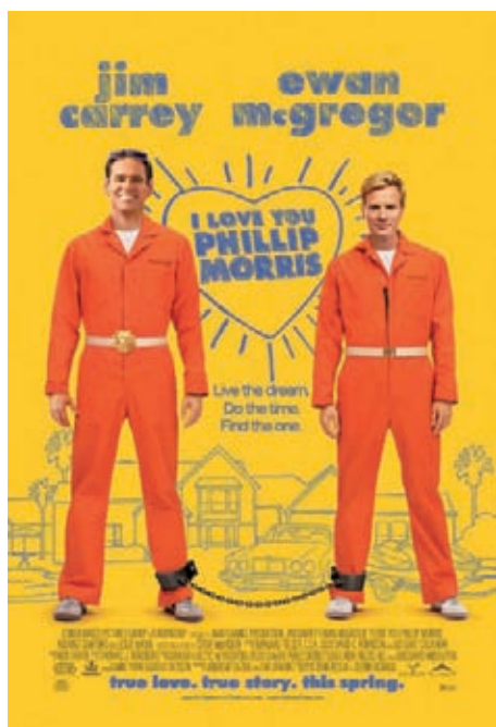
Figura 4. Cartel de la película que responde a los cánones estéticos iniciales marcados por los creativos gráficos.

internacional y también tuvo una razonable aceptación por parte de la crítica. Lo que nos llama la atención es la disparidad de factores visuales que la ha acompañado en su periplo por los diversos países en los que se ha difundido, así como los constantes cambios de imagen, incluso en su trayectoria anglosajona.