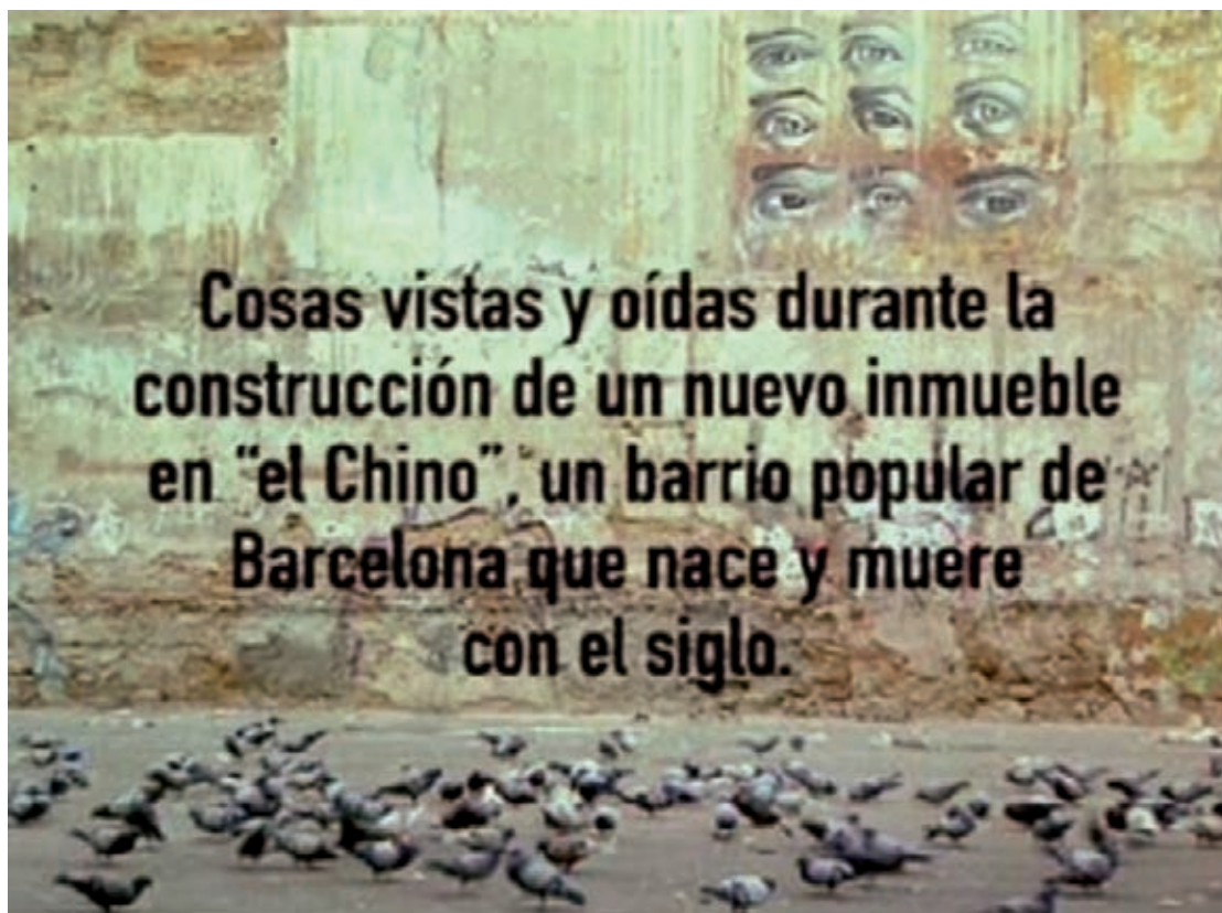
Figura 8. Frase con la que se inicia la película documental En construcción .

El inicio del film es un fondo negro en el que van apareciendo con letras blancas los nombres de las entidades que han colaborado en la producción. Tras esta concesión lógica vemos un montaje documental con imágenes en blanco y negro en el cual se repasa, en pocos minutos, todo un siglo de tradición: el ambiente del Raval barcelonés en los inicios del siglo XX; la zona de prostitución en imágenes de los años 1950 y 1960, y un recorrido de un cámara persiguiendo a un marine norteamericano que deambula zigzagueando por la zona final de las Ramblas y finalmente desaparece en una calle del Raval. Esta deliciosa introducción da paso a una imagen fija de una pared (todo el film es una sucesión de planos fijos de gran empaque visual) sobre la cual aparecerá el título de la película, el nombre del director, y posteriormente un texto introductorio, tal y como lo vemos en la figura 8 .