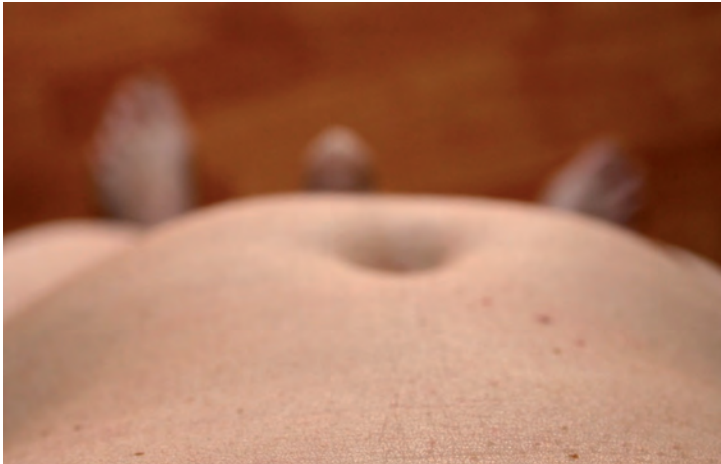
Fig. 4.- ¿NO YO? Desnudo para fotografia#01 , Benifato (Alacant), 2009