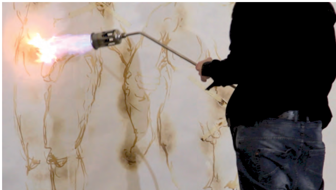
Fig. 11.- Tres gracias trans, Projecte ¿NO YO? El artista, Vídeo-performança, 9 Abierto de Acción, ARTJaén, Jaén, 2013