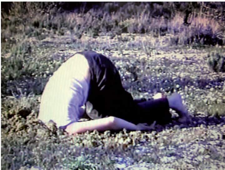
Fig. 6.- Avestruz , Vídeo-performança, Benifato (Alacant), 2001 (Fotograma de vídeo)