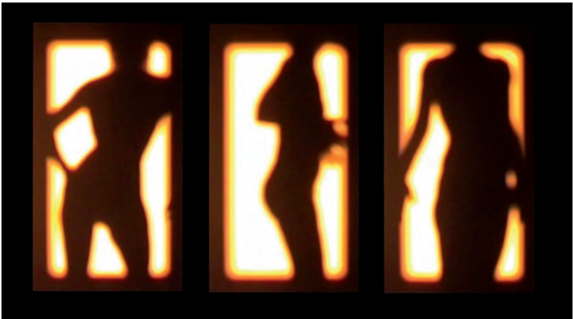
Fig. 2.- Tres siluetas , Video-permança, Benifato (Alacant), 2009 (Fotograma de vídeo)