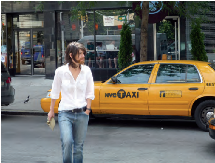
Fig. 5.- ¿NO YO? NYC_#3 , Nova York (U.S.A.), 2011