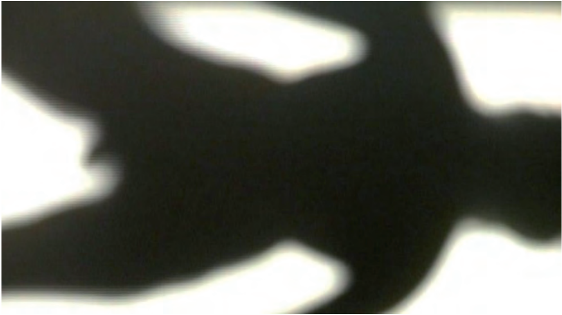
Fig. 1.- Siluetta flotante , Video-permança, Benifato (Alacant), 2009 (Fotograma de vídeo)