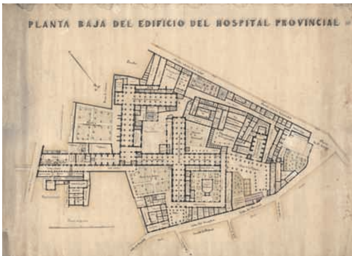
Fig. 1. Plànol Hospital, s. XIX (MuVIM).

posterior reglament de 14 de maig de 1852, la corporació va assumir les competències de beneficència. En conseqüència, passaven a la Diputació com a establiments provincials de beneficència la Casa de la Misericòrdia, la Casa de la Beneficència i l'Hospital General, amb les seues institucions depenents: Teatre Principal i Plaça de Bous de València.