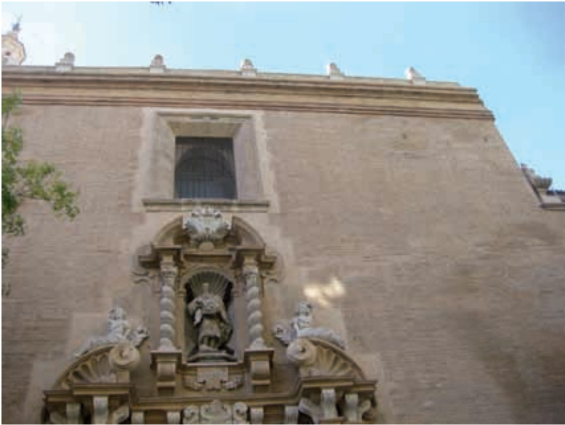
Fig. 1. Fachada de la antigua iglesia parroquial de San Andrés.

detenidas más de dos décadas, las obras se reanudan en 1622 6 , siendo acabadas en 1631 con la ejecución de transepto y cabecera 7 .