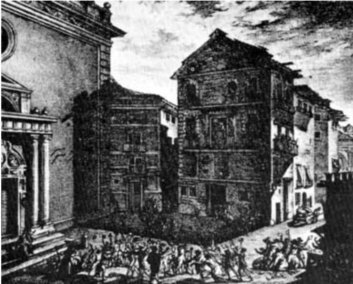
Fig. 4. Casa Profesa de Valencia a principios del s. XIX (grabado coetáneo de Vicente L6pez).