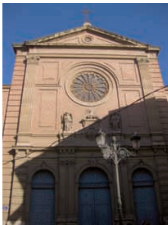
Fig. 3. Fachada de la actual iglesia de la Compañía.

Las líneas medievalizantes de la fachada de la iglesia de la Casa Profesa de Valencia se combinan con el tratamiento desornamentado del testero con pilastras de orden dórico, tal y como recrea el grabado del s. XIX atribuido a Vicente López 9 . Se trata del único documento gráfico que, hasta la fecha, había permitido restituir la apariencia del imafronte de la desaparecida iglesia. Las antas que perfilan el