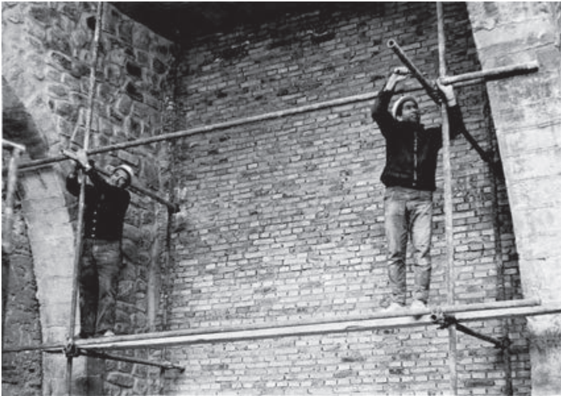
Fig. 4.- En esta fotografía podemos apreciar los dos arcos diafragma que restan de la planta primera de la torre-iglesia-fortaleza, actual sacristía, durante los trabajos de restauración en el siglo XX.

gado a la derecha del arco diafragma central de la actual sacristía, un vano en forma de arco de medio punto con dovelas de rodano, que quedó cegado en alguna de las reformas. Debía servir para controlar y defender la zona este, al estar situado en la planta con más altura.