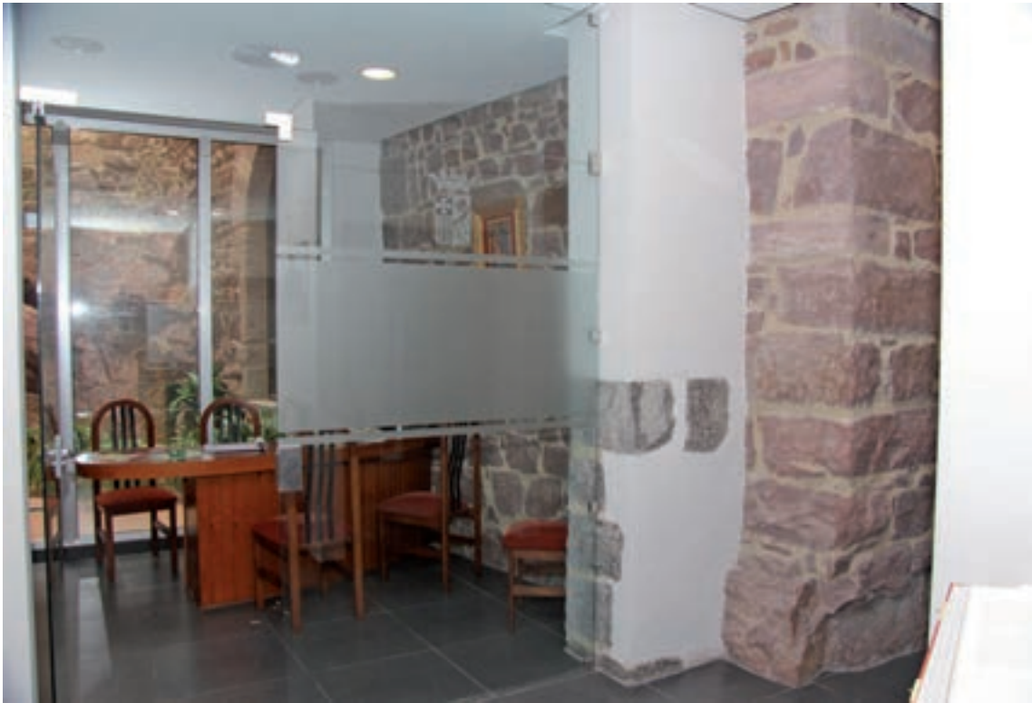
Fig. 7- Podemos percibir la esquina noroeste de la torre-iglesia-fortaleza, destacando sus potentes sillares de cerramiento de la esquina, para reforzar la estructura del edificio, asentados sobre el rodeneo nacido, y también vemos todo el muro norte con el arco de acceso a la planta baja de la torre-iglesia-fortaleza.

Son “de carreu mitjà, no gaire regular, però ben aparellat a trencajunt i amb cadenes cantoneres” 30 , con hiladas isódomas.