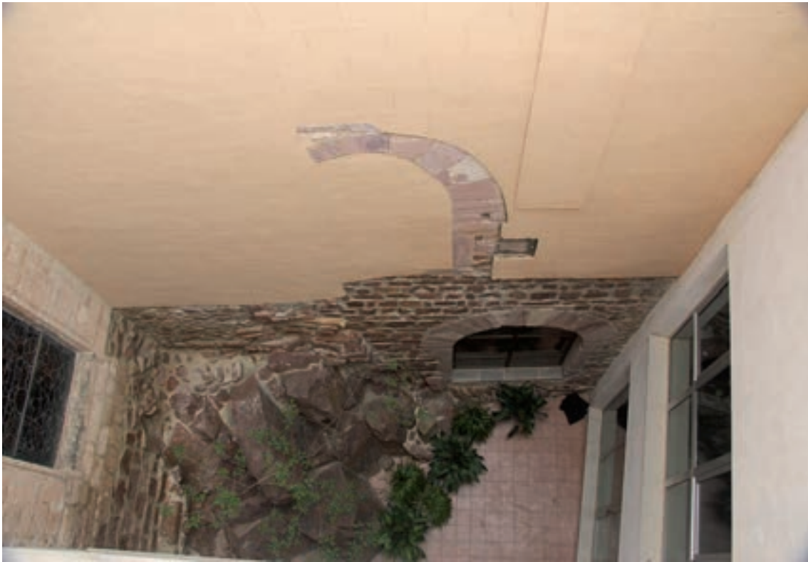
Fig. 6- Aquí vemos el muro norte con los accesos a la planta baja y a la primera planta de la torre-iglesia-fortaleza. Cabe señalar los arcos de medio punto, los arranques de piedra para fijar un cadalso o paseo de ronda y cómo el muro queda integrado con la roca nacida.

del P. Sanchís, por amenazar ruina, se conservó “únicamente el antiquísimo tapiel del lado norte, previamente consolidado” 15 .