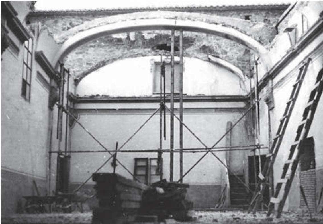
Fig. 5- Restauración del antiguo coro, que se ubicó en la parte demolida de la primera planta de la torre-iglesia-fortaleza. Podemos observar a la izquierda como se está cegando la puerta de acceso original, fosilizada en el muro norte que se decidió conservar y reforzar.