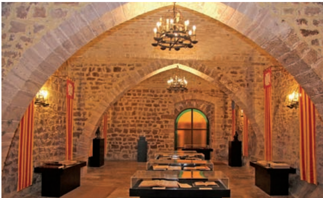
Fig. 3.- En esta fotografía podemos contemplar la planta baja de la torre-iglesia-fortaleza, actual Salón gótico. Destacan los arcos diafragma, las bóvedas escarzanas de ladrillo, los muros de mampostería, la puerta y la roca nacida de la montaña sobre la que se asientan los arcos.

Estamos ante una torre-habitación-fortaleza que también se utilizó como iglesia. Se trata de una estructura prismática de planta rectangular de unos 8,70 m (Este-Oeste) y unos 15,20 m. (Norte-Sur) de base. Debió tener unos 11 m. de altura. Toda ella está realizada utilizando como cantera la piedra de rodano de la misma montaña sobre la que se asienta. En la actualidad resta la planta baja y el primer piso. Con toda probabilidad, tal como ocurre con todas las fortalezas de este tipo, debió poseer una terraza almenada,