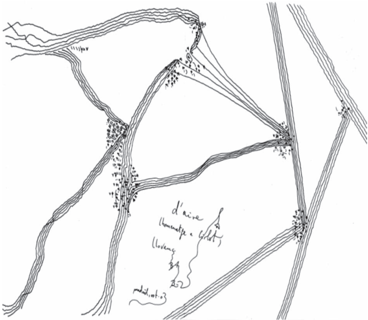
Fig.1.- Homenaje a Juan Eduardo Cirlot