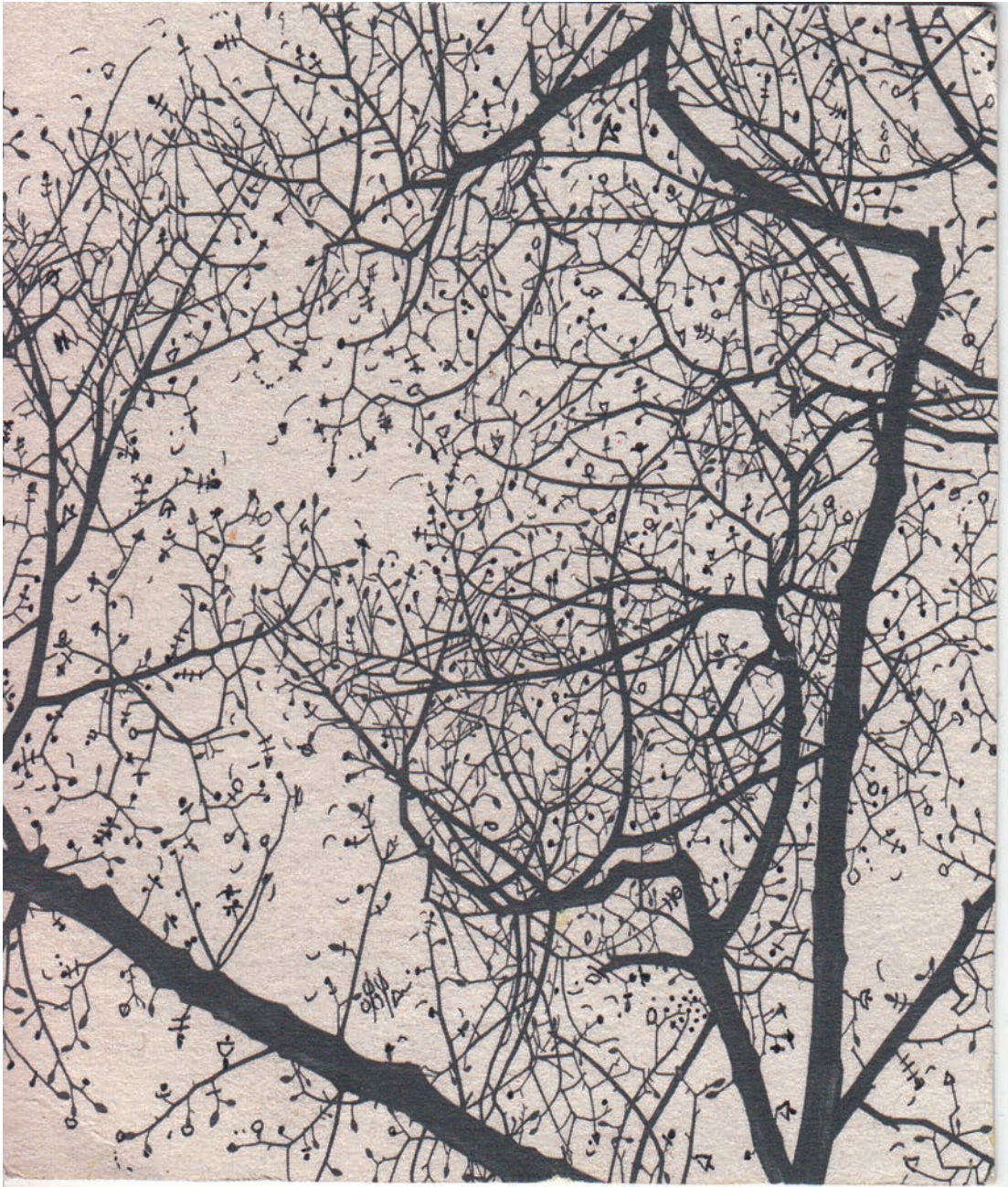
Fig.4.-Para cargar las pilas sónicas