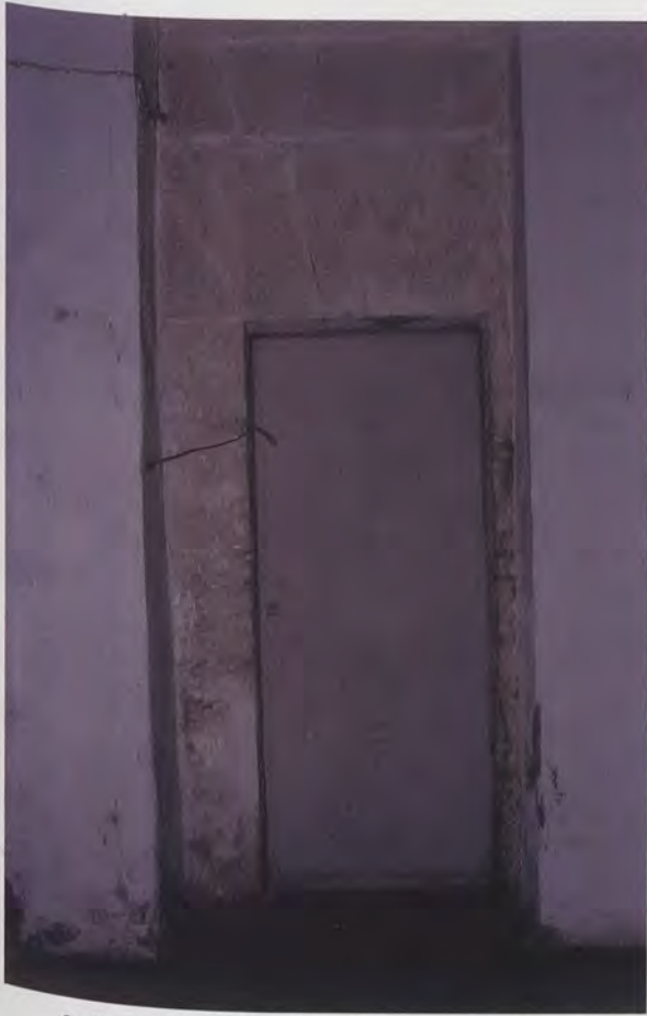
3.- Possible entrada al primitiu campanar medieval.

a cada lateral amb altres històries dels esmentats sants orientals, així com un banc corregut en la part inferior amb set pintures (sis relatives als miracles dels mateixos i, enmig, la Pietat). Finalment, es fa al·lusió a les polseres (les mesures de les quals seran de dos pams) que protegiran el retaule de la brutícia, deixant la responsabilitat de l'elecció de les imatges allí representades al criteri del pintor.