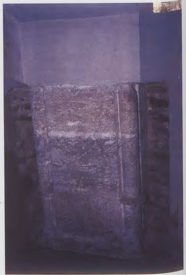
2.- Contrafort motlurat del primitiu temple.

en compte que únicament teniem notícia de la contractació del retaule major per part de Gonçal Peris el 1414 i d'un retaule d'ànimes que sembla existí, així com d'una pica baptismal gallonada que encara es conserva al cementeri municipal (bé és cert que com a improvisat pedestal de la creu que hi ha en la part vella) 6 .