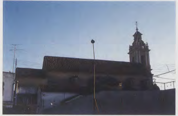
4.- Vista exterior del temple barroc des de ponent.

S'insisteix en què el predomini del daurat serà manifest, tant en l'estructura com en els fons de les escenes i, particularment, en la data en què s'entregarà l'encàrrec –un any i mig després en l'esmentat temple– i el cost total (seixanta lliures: vint de les quals se li faran efectives en el moment de les capitulacions, les vint següents es satisfaran a l'hora de daurar el retaule i les restants es liquidaran quan estiga definitivament assentat en la capella).