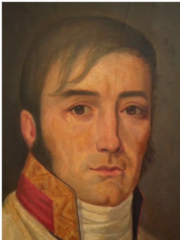
Fig. 5.- Detall del rostre