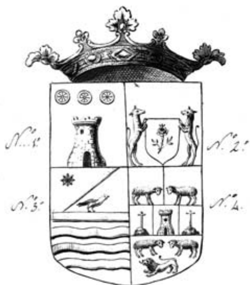
Fig. 3.- Escut de Vicente Rodrigo a l'AHN: 1) Rodrigo, 2) Ros, 3) Dassio, 4) Puigmoltó