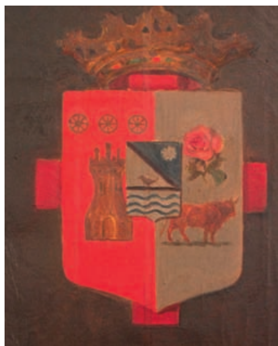
Fig. 4.- Detall de l'escut pintat al quadre