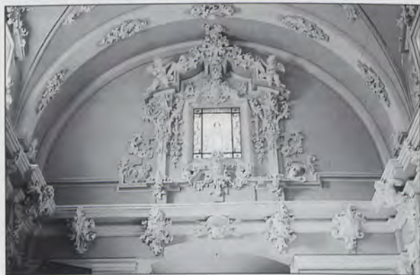
Detalle de la nave central, s. XVII.

Posteriormente, en los años 1692 y 1693, las anotaciones del Libro de Fábrica refieren diversos pagos destinados a la cubrición del mismo (14) y a la extracción de la tierra movediza anexa a la construcción, tarea que no se completará hasta el año 1696 (15) . Probablemente el templo se hallara totalmente cubierto al finalizar el año 1693 una vez elevados los machones, construido el cerchado y elaborada la bóveda tabicada con lunetos, ya que durante 1694 y 1695 se registran trabajos diversos en la sacristía (16) .