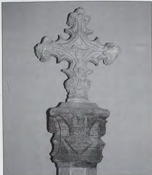
Cruz votiva, s. XV.