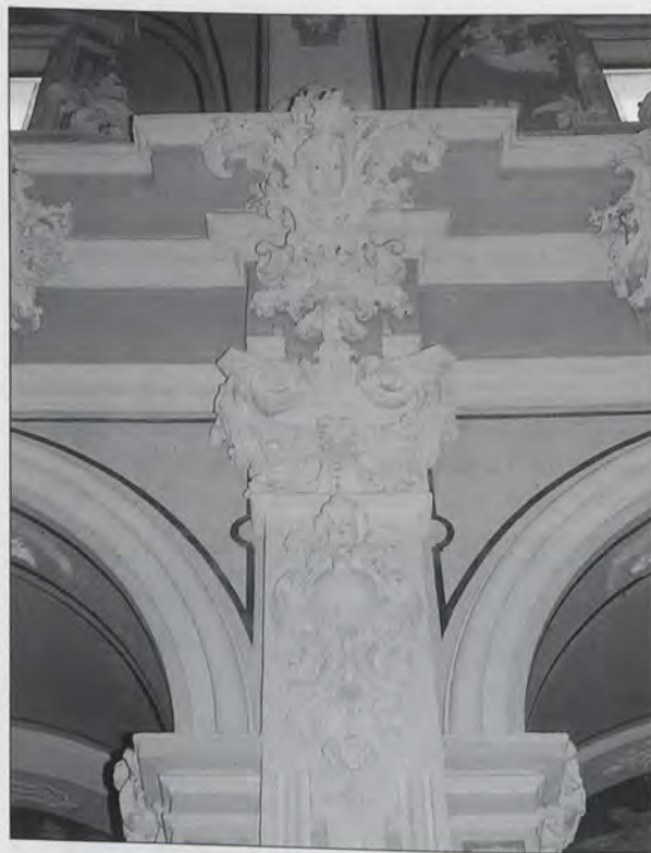
Detalle de la nave central, s. XVII

A mediados de siglo, bien por el aumento demográfico o necesidades de índole diversa, la junta de fábrica reparó en la conveniencia de dotar al templo de una prolongación. Se creyó oportuna su construcción en el lado del Evangelio, dado que el de la Epístola limitaba con la