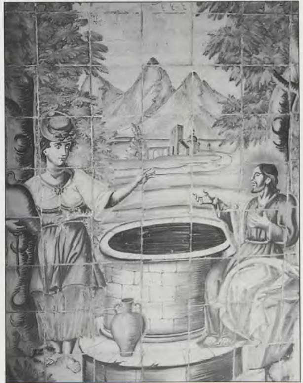
Zócalo con azulejos representando a Jesús y la Samaritana, s. XVIII.

afinidades estilísticas que lo relacionan con otras parroquias vecinas (24) .