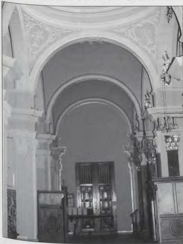
Capilla de comunión, s. XVIII

Fruto de este ímpetu renovador se pueden considerar también la apertura de una plazoleta en la portada de los pies del templo, para lo que la junta de fábrica mercó una casa limítrofe (22) , así como la cubrición de los zócalos del edificio con azulejería que aunque en su