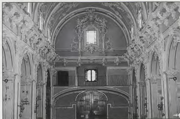
Nave central, s. XVII

La fecha de inicio de las obras tuvo lugar el día 18 de septiembre de 1690 (9) , pues durante el resto del año se construyó el coro. Durante 1691 se cambió de ubicación el órgano, se realizaron trabajos de renovación de