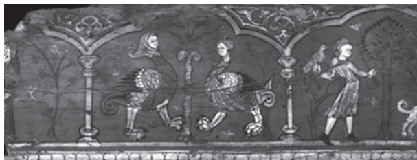
Tabla pintada del techo de la iglesia de la Sangre de Liria.

Viernes, 28 de junio de 2024. BENISSANÓ Y LLIRIA