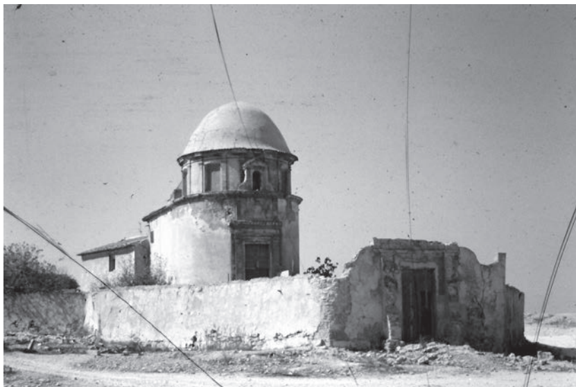
Fig. 1.- El Panteón funerario de los Guijarro y las cercas perimetrales. Estado hacia 1980.

De sus obras construidas destaco la Puerta de San Francisco en la muralla de Alicante y el Panteón de los nobles Guijarro (Fig. 1) que fue mandado edificar por D. José Guijarro y Espinosa, destinado a mausoleo funerario familiar. Alguna referencia en la bibliografía consultada indica 1799 el año de comienzo de las obras; cuya construcción se prolongó algún tiempo, hasta su conclusión durante 1803. Estos datos se contradicen con la fecha de 1804 escrita en las láminas con los dibujos de Vicente Ramón.