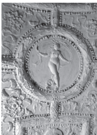
Entrevigado de yeso del castillo de Benissanó.