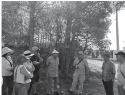
Recorriendo las ruinas de València la Vella con el arqueólogo Albert Ribera.