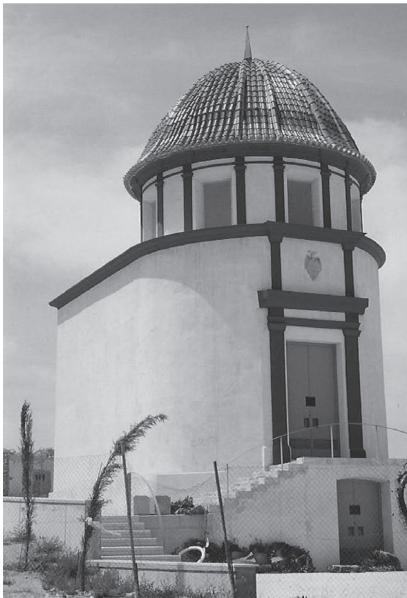
Fig. 4.- Alzado principal tras la restauración en 1998-1999.