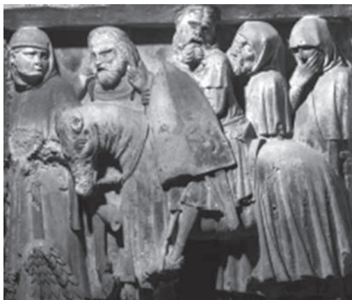
Sepulcro de los Boil. Ceremonia de Correr las armas.