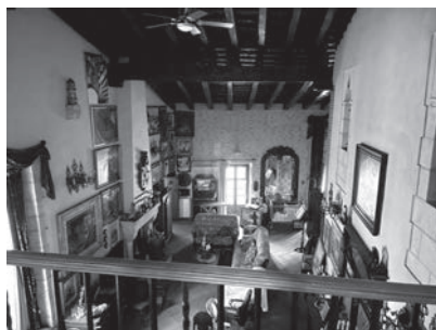
Casa señorial de Xirivella.