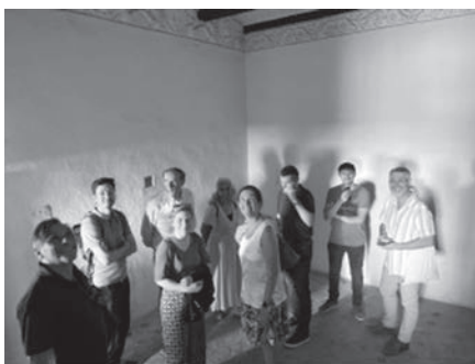
Visitando el castillo de Benissanó.