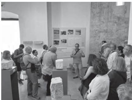
En el Museo visigodo de Plá de Nadal, de Ribarroja.