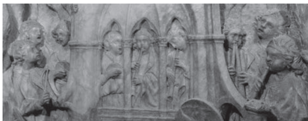
Coronación de la Virgen. Detalle. Guliano Nofri. Antiguo trascoro de la catedral de Valencia.