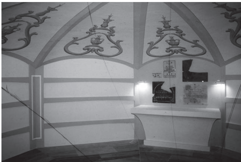
Fig. 6.- Bóveda de la cripta tras la restauración, 2000.