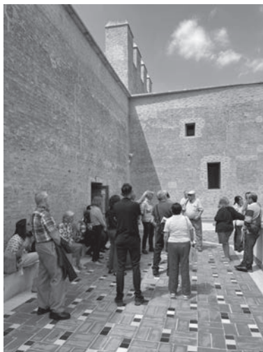
Recorriendo el Castell d'Alaquàs.