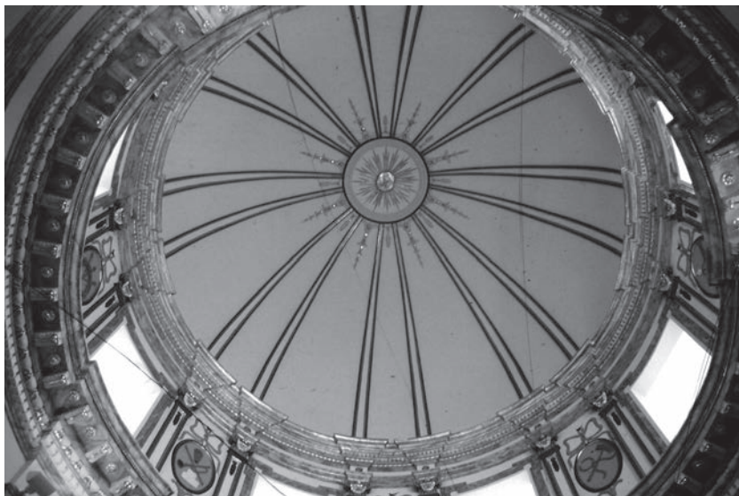
Fig. 5.- Aspecto del interior de la cúpula tras quedar restaurada, 1998-1999.