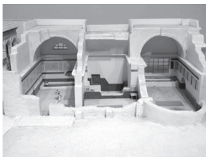
Reconstrucción de las termas de Mura en Llíria. Museo Arqueológico de Llíria.