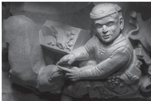
Cantero dando de comer a un perro, Maestro “A” del taller de escultura de Pere Compte, del se- gundo taller de la catedral de València.