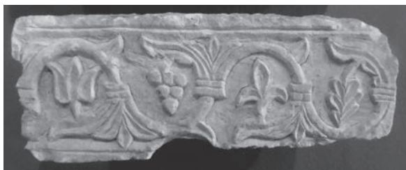
Friso visigodo de Plá de Nadal. Museo visigodo de Plá de Nadal, de Ribarroja.