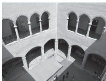
Recorriendo el Castell d’Alaquàs.