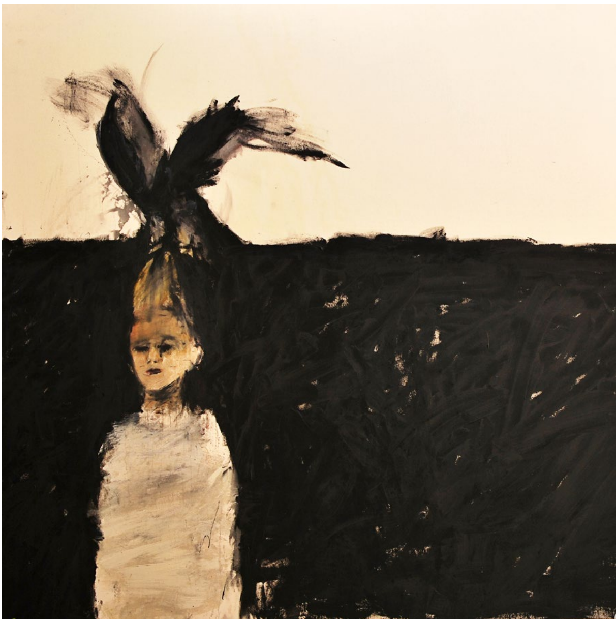
OMNIA IN SUBLIMI SUNT Acrílico sobre tela 200x200 cm.