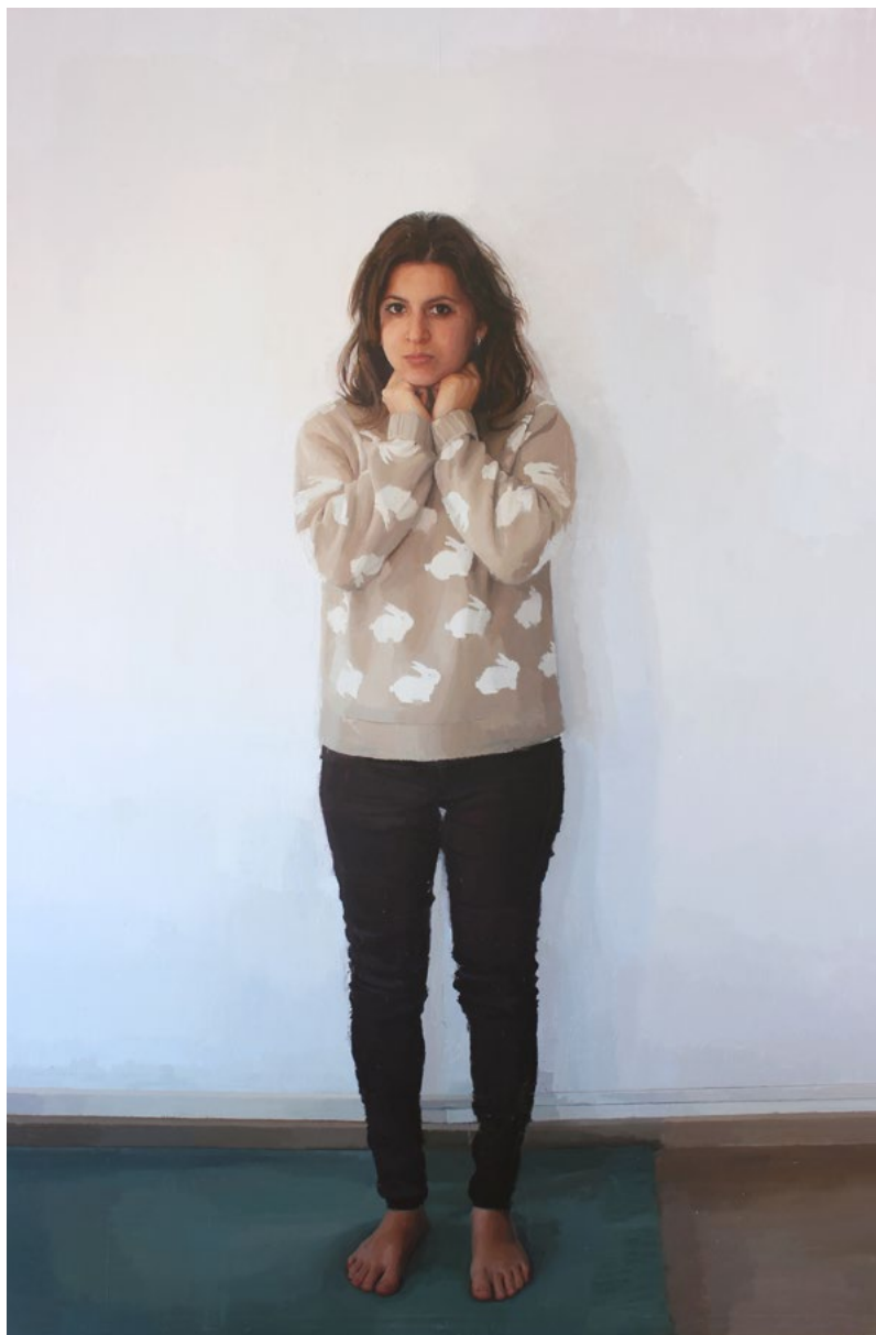
MUJER EN SOMBRA ANTONIO LARA LUQUE Óleo sobre tela 195x130 cm.