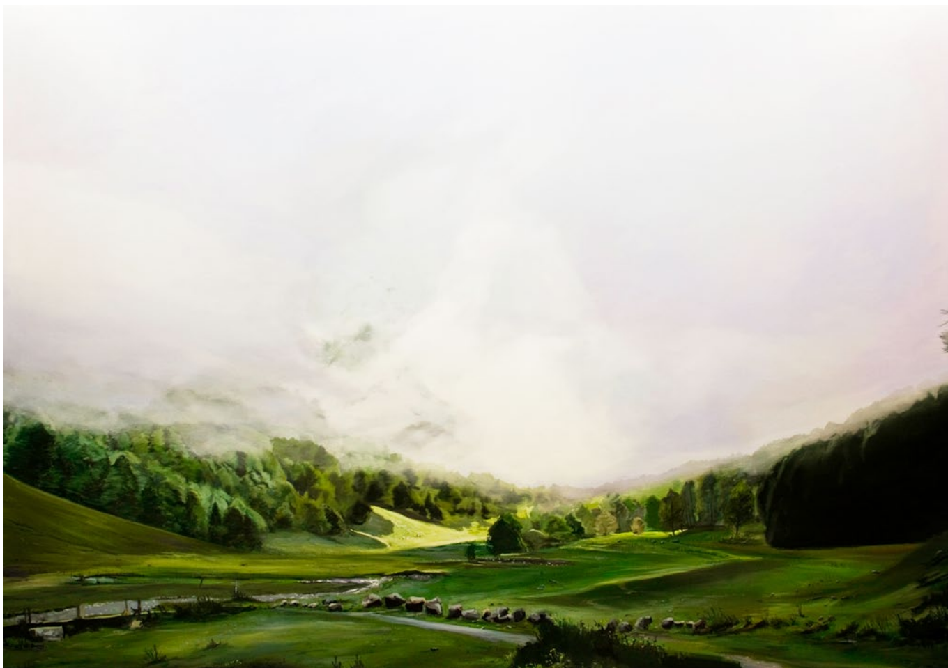
NIEBLA SOBRE ARTIGA DE LIN ALBERTO BIESOK Óleo sobre lienzo montado sobre tabla 135x195 cm.