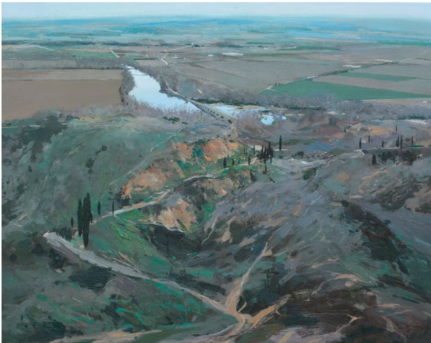
DUERO Óleo sobre lienzo 114x146 cm.