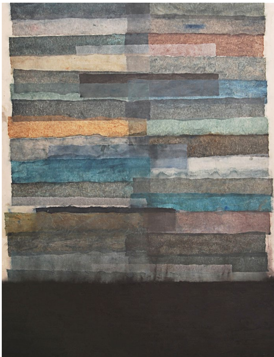
LEVITAS Técnica mixta sobre tabla 195x150 cm.