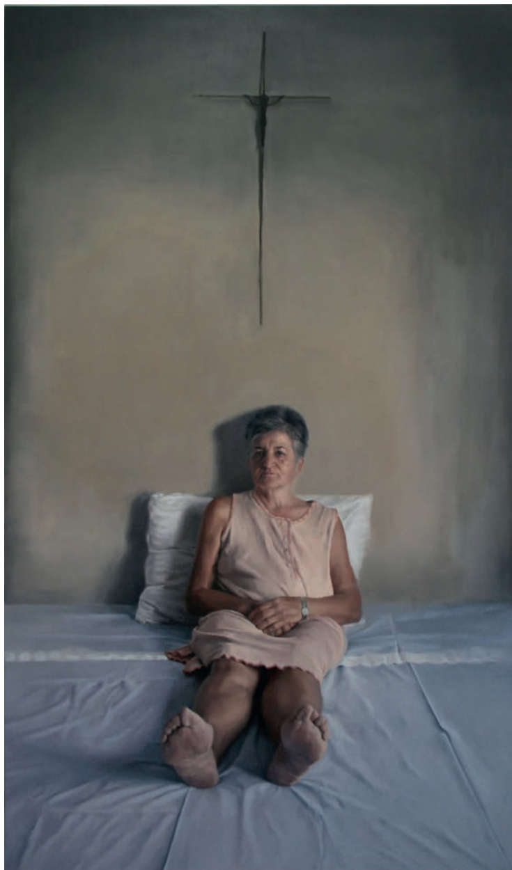
MADRE María Carbonell 170x100 Óleo sobre tabla