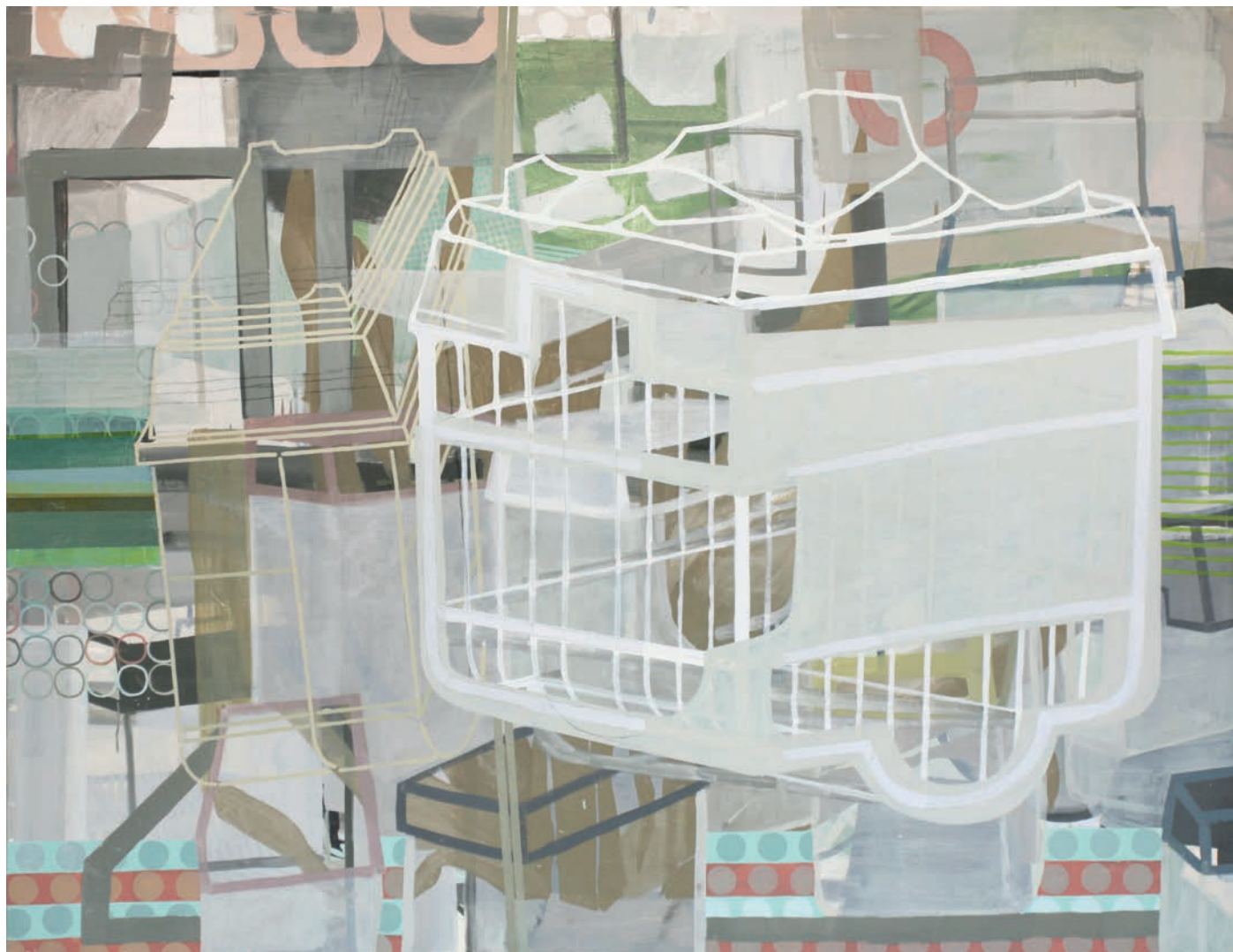
PAJARERAS Cristina del Campo 150x195 Óleo y esmalte sobre tela