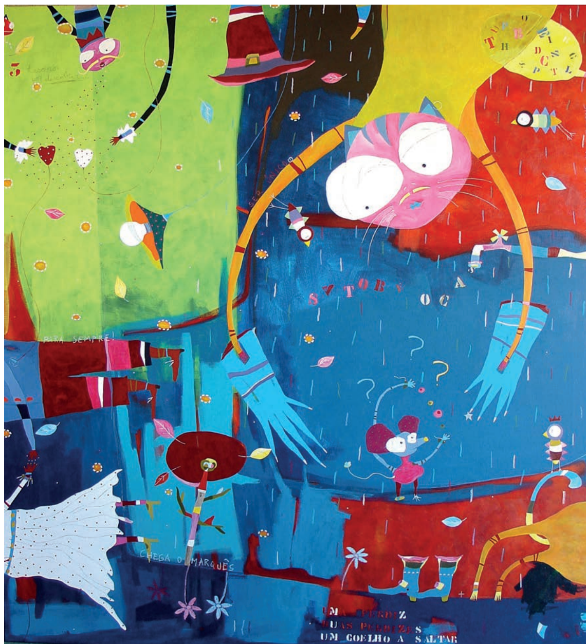
UM TESOURO POR DESCOBRIR Rui Gomes 190x170 Mixta sobre tela