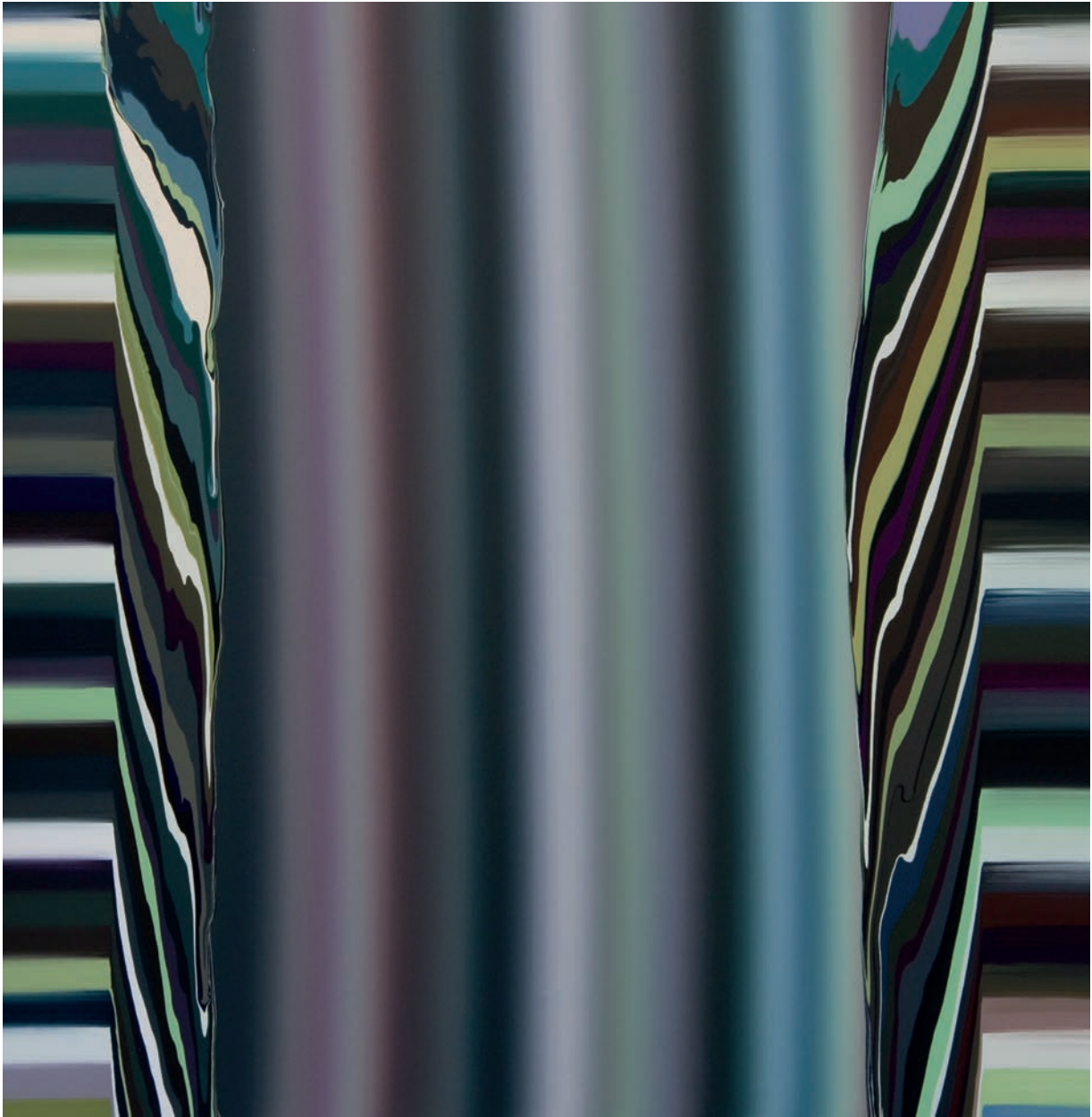
TEMPLO 180x180 Acrílico sobre lienzo