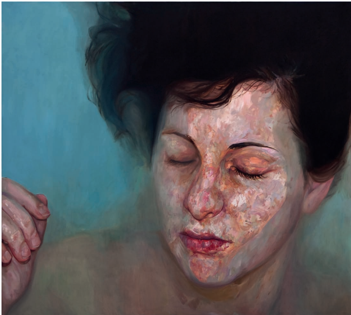
EMERGIENDO XVIII. LAURA 170x190 Óleo sobre tela