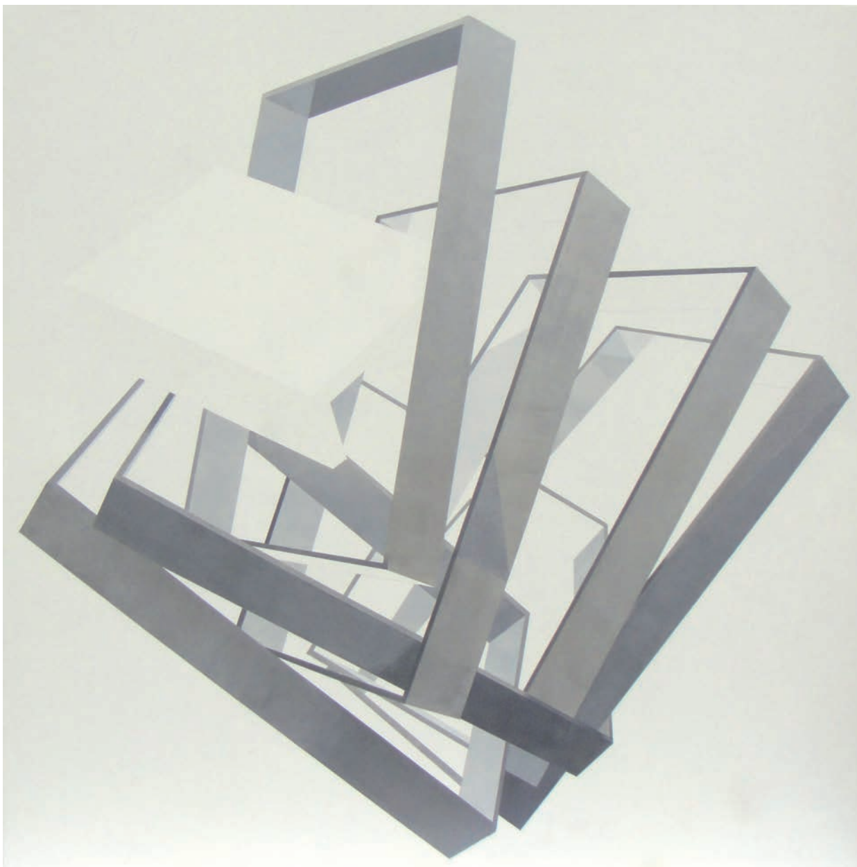
ARQUITECTURA EFÍMERA N° 9 Carolina Valls Juan 150x150 Acrílico sobre tela