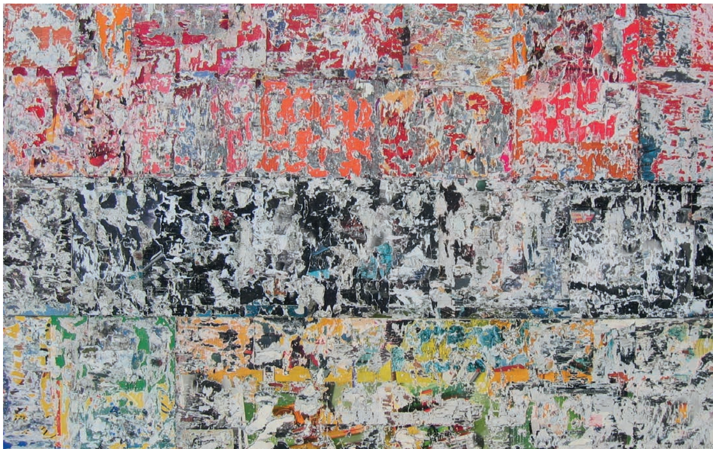
INTRAMUROS Alberto Cea 100x178 Papel sobre madera