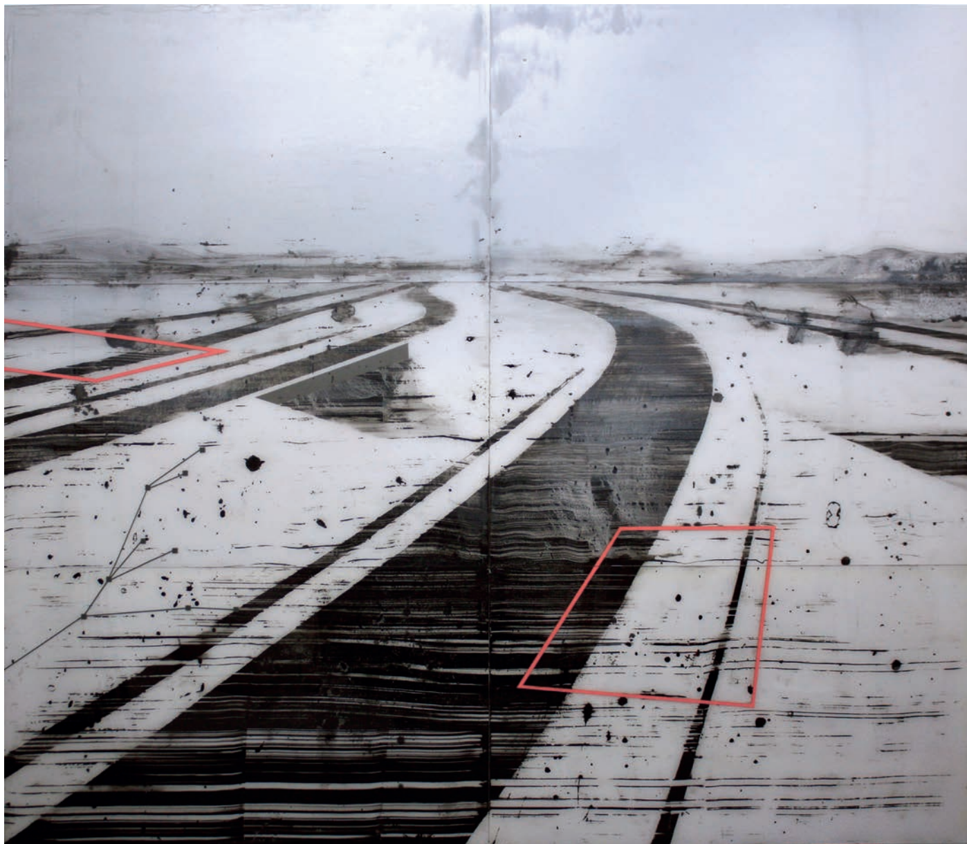
TRAFFIC CAM #1-80 BIG SPRINGS 174x200 Acrílico, vinilo y spray sobre policarbonato