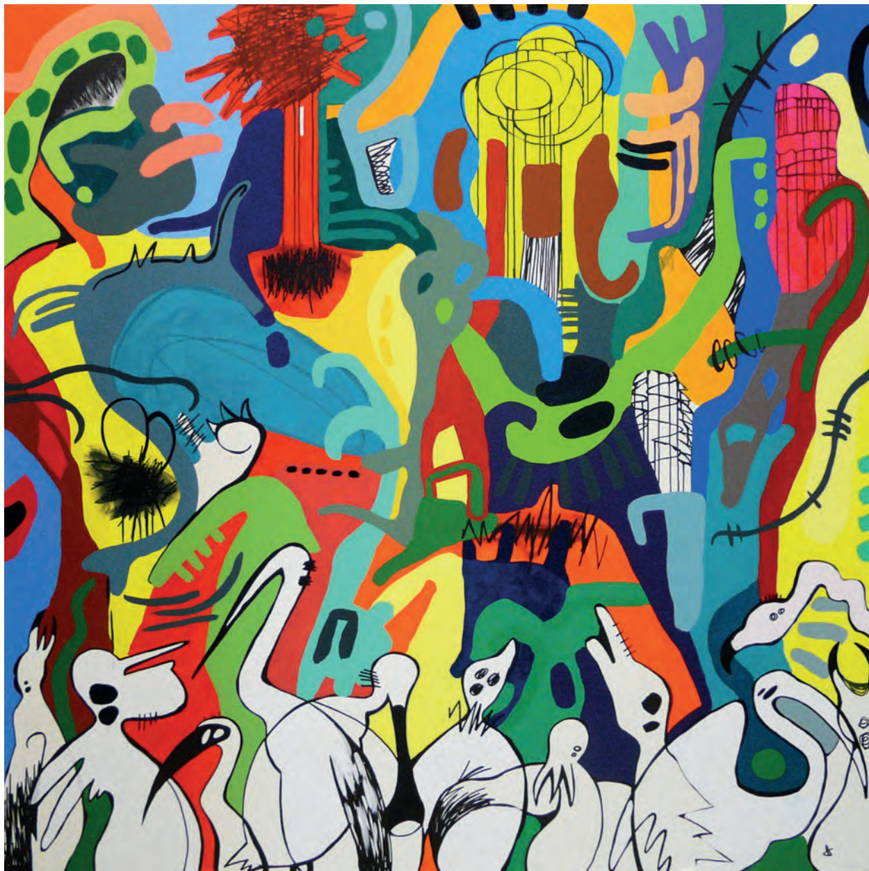
LA CAÑADA DE LOS PÁJAROS Rafa López Mixta sobre tela 200x200