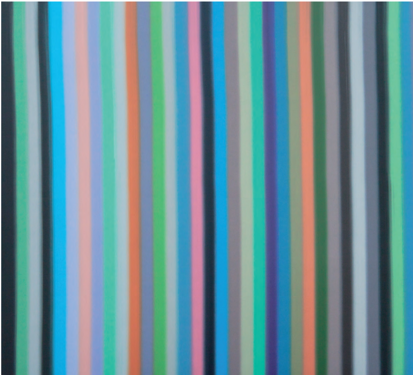
TEMPLO Ferran Gisbert Acrílico sobre lienzo 180x200