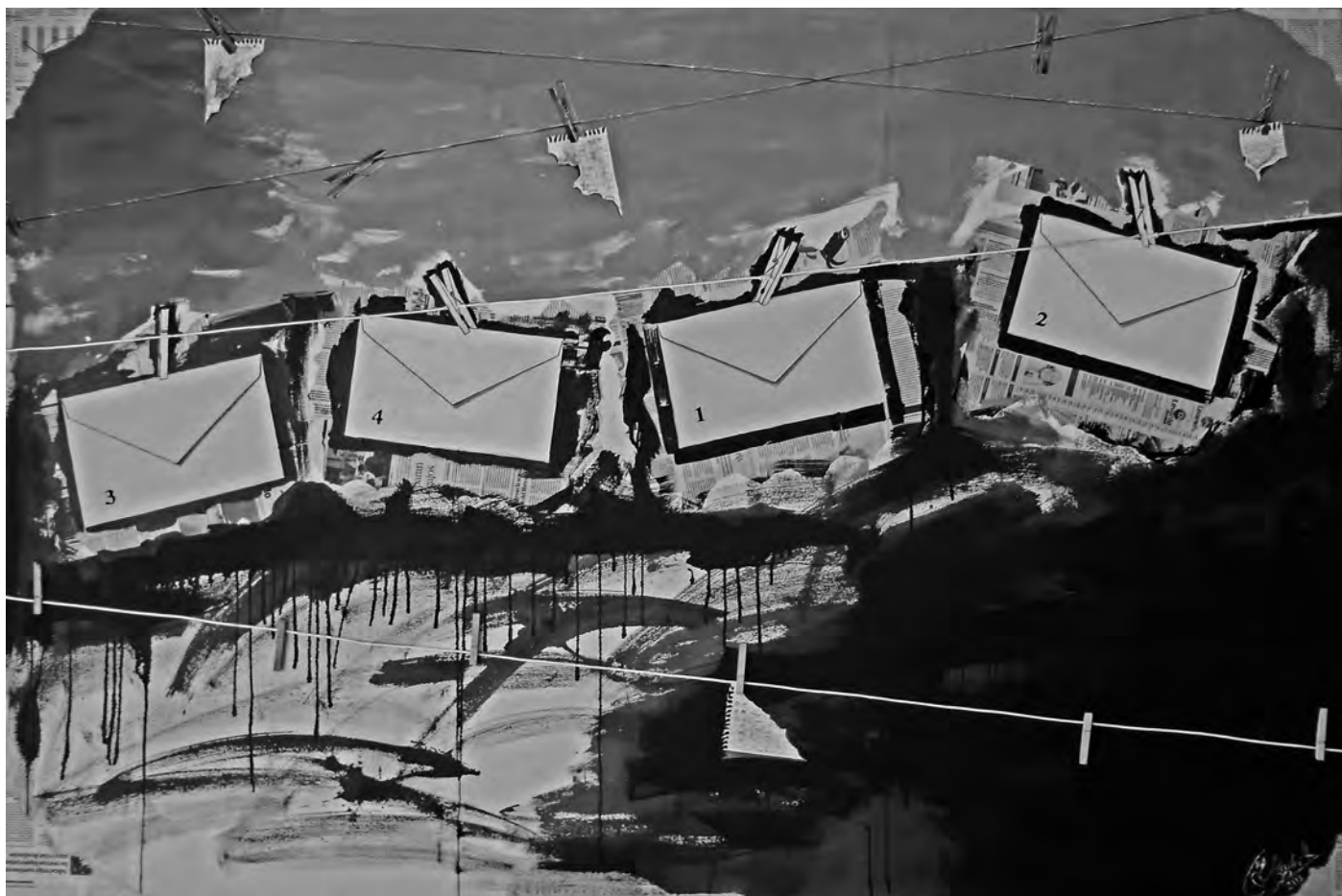
EL BÁRCENAS GATE Nabil El Hadri Acrílico-mixta sobre lienzo 200x130