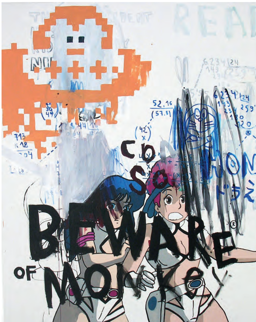
BEWARE OF MONKEY Eduardo P. Salguero Acrílico sobre tela 190x150