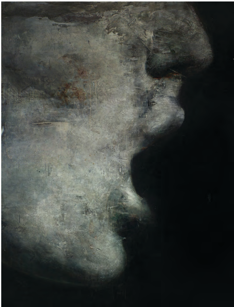
EL HABLANTE Óleo sobre lienzo 200x150