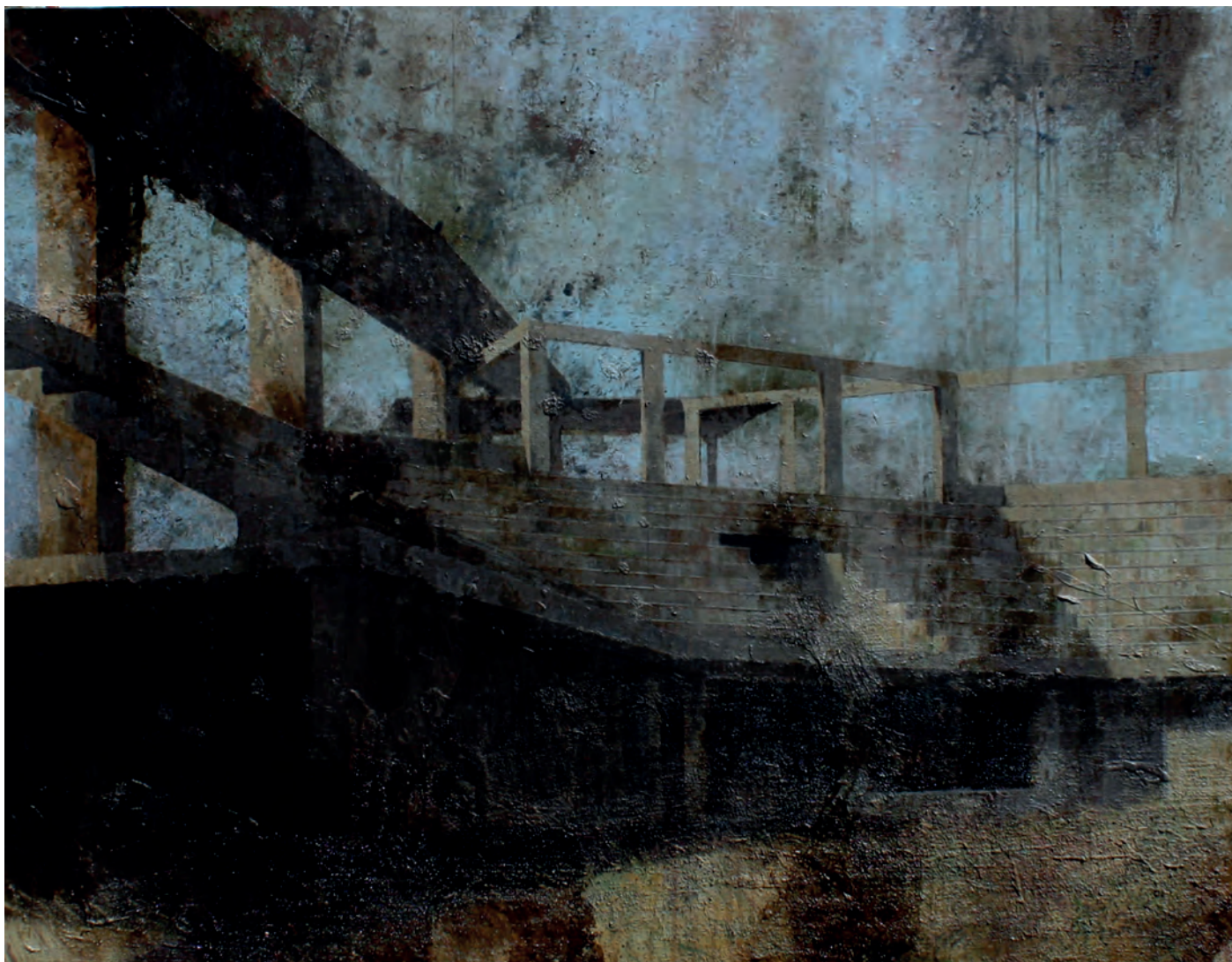
GAME OVER Guillermo Masedo Mixta sobre tabla 114x146