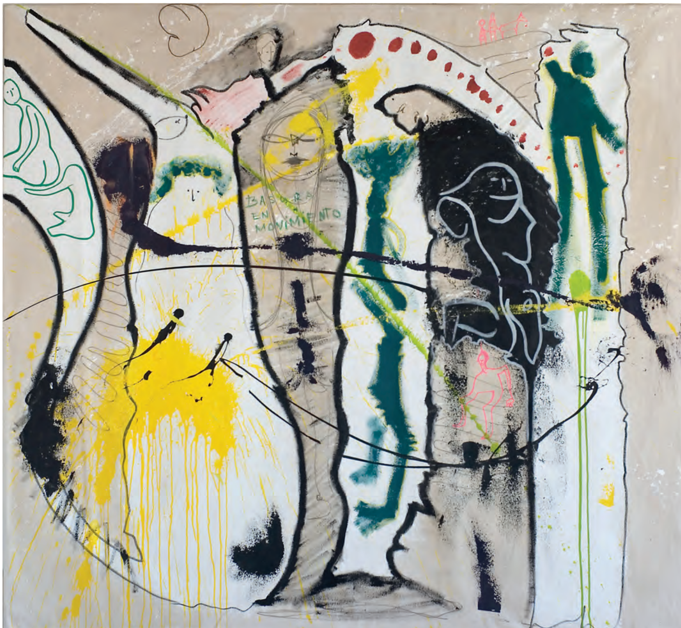
BASURA EN MOVIMIENTO Lidia Toga Acrílico y rotulador de acrílico sobre lienzo 184x200