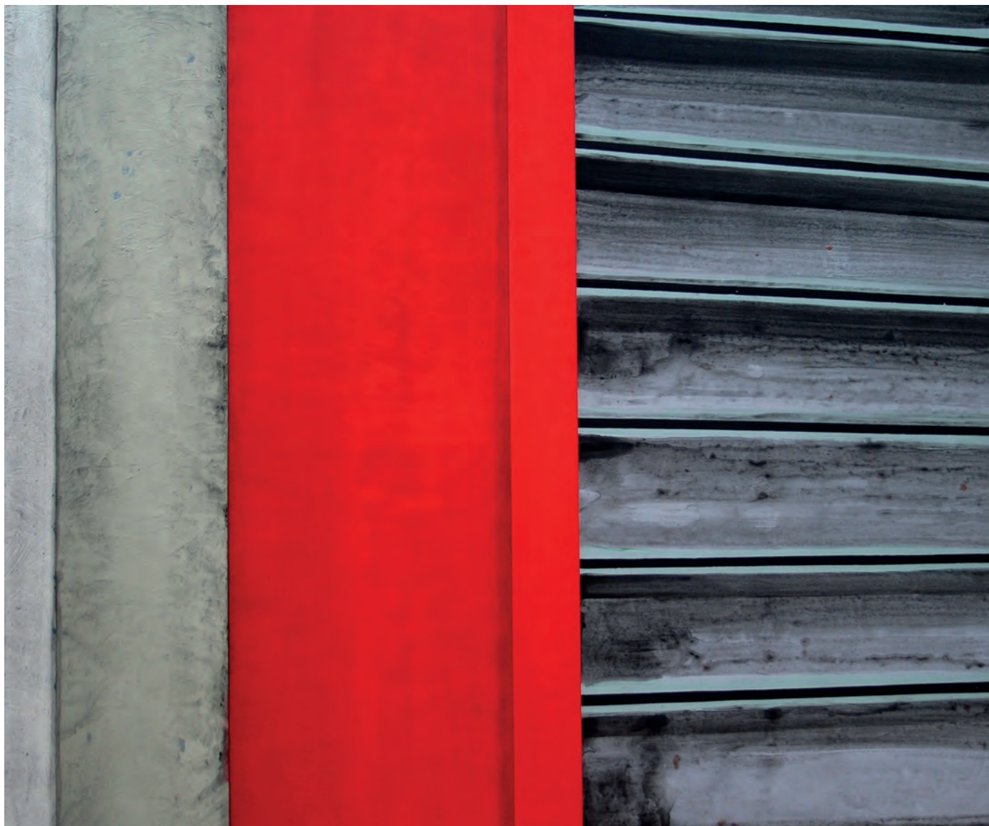
DISTORSIÓN 22 Carolina Maestro Acrílico sobre tabla 150x180