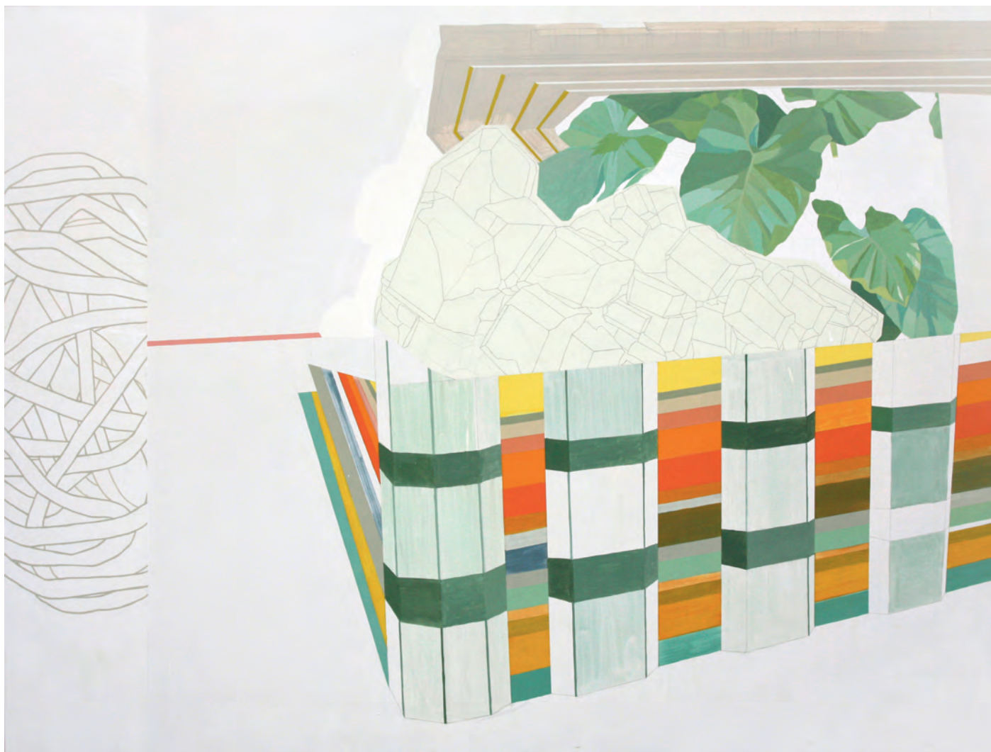
S/T SERIE ENTORNOS Cristina del Campo Óleo y grafito sobre tela 150x200