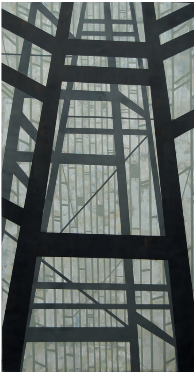
S / T José Antonio Picazo Acrílico sobre tabla 180x100