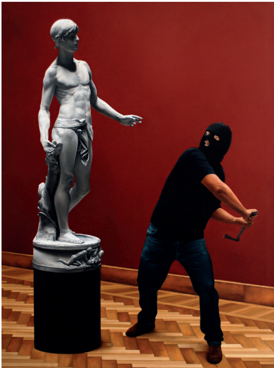
ACCIÓN DE ASALTO AL ARTE N° 10, AMBERES 2008 Óleo sobre lienzo 200x150