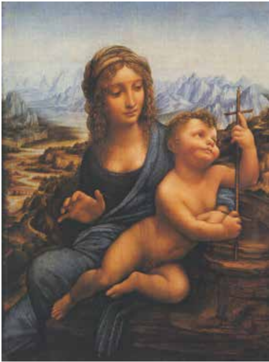
Fig. 6.- Leonardo da Vinci y taller (¿), Madonna con el Niño ( Madonna Buccleuch ). Edimburgo, National Galleries of Scotland (Buccleuch Living Heritage Trust).