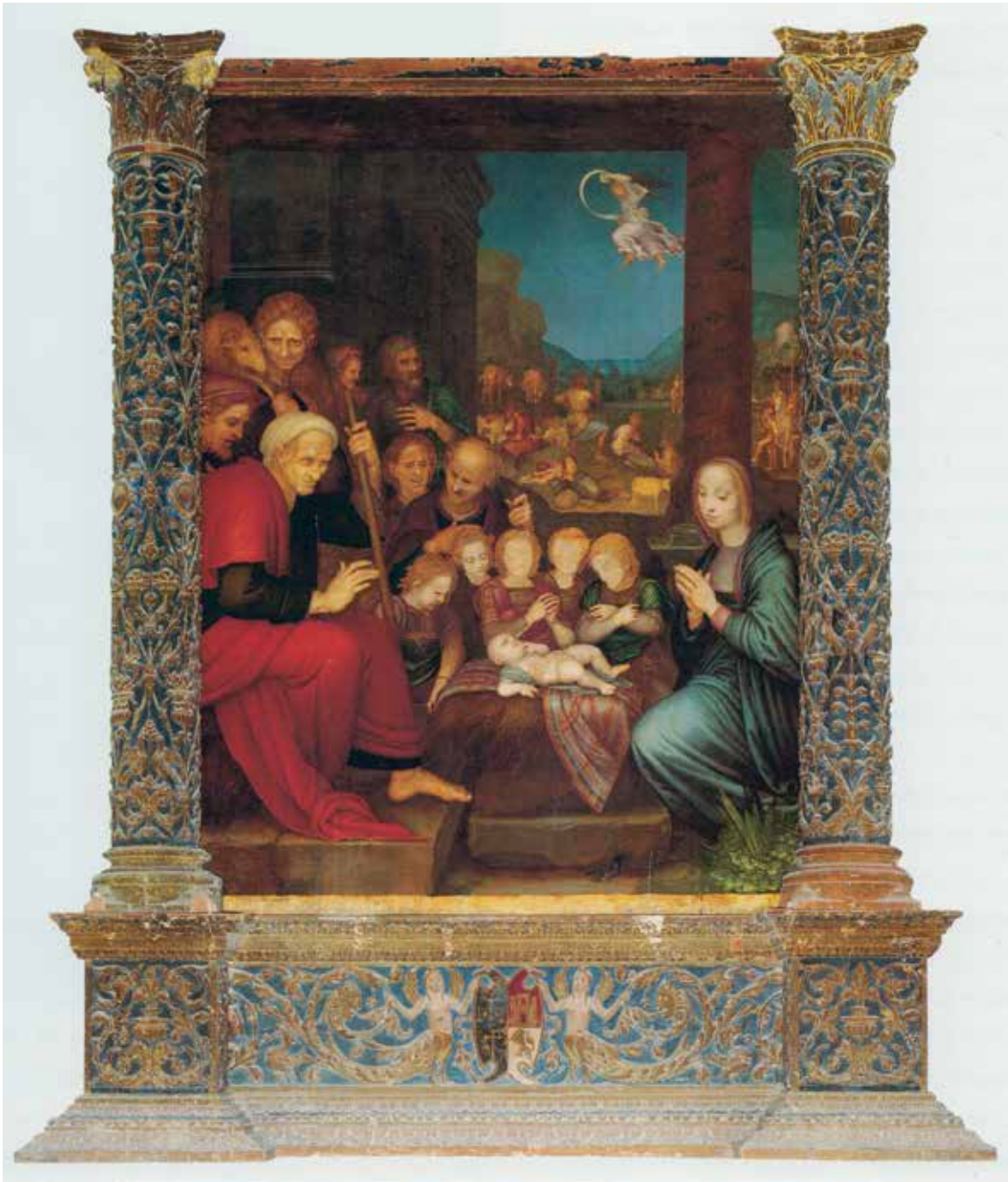
Fig. 4.- Fernando Yáñez de Almedina, Adoración de los Pastores , después de 1525. Cuenca, catedral de Santa María y San Julián.