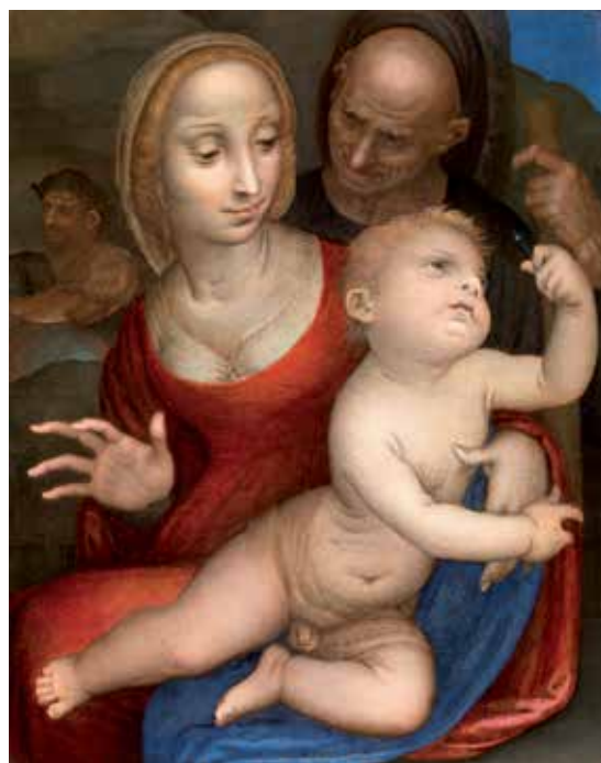
Fig. 5.- Fernando Yáñez de Almedina, Sagrada Familia , 1523. Colección particular.

[fig. 5] Esta sugerencia, la única que puede justificar el dictado de la inscripción, está confirmada por el descubrimiento de una otra tabla de dimensiones muy cercanas a la que ya se encontraba en la colección Grether, 23 cuya composición responde a la de la pintura publicada por Post, excepto por la presencia, detrás de la Sagrada Familia, de un par de personajes masculinos, atrapados en un juego de poses convergentes. La obra en cuestión, generalmente en buen estado (a excepción de algunos pasajes en la parte inferior de la tabla, como la mano derecha del Niño Jesús o los pliegues que caen del brazo izquierdo de la Virgen), encaja en una deslumbrante gama cromática, compuesta de rojos