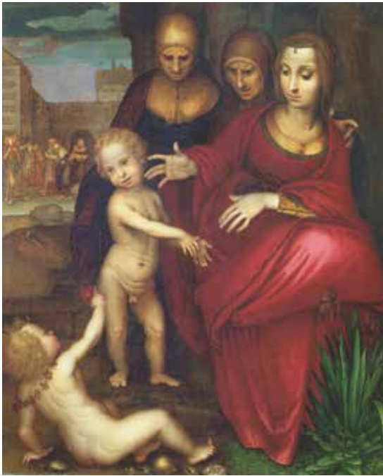
Fig. 1.- Fernando Yáñez de Almedina, Santa Generación , hacia 1524. Madrid, Museo del Prado, inv. P002805.

en el catálogo a él atribuido, que sin embargo enriquece la geografía artística antes mencionada con etapas adicionales. De hecho, aparte de las pruebas musealizadas (como las tablas del Prado, incluido el ejercicio luminístico y prospectivo de la Santa Catalina , de procedencia incierta), los testigos que aún se encuentran in situ se reflejan con facilidad en este cronograma, sugiriendo algunas incursiones provinciales, en relación directa con las ciudades metropolitanas habitadas por Yáñez: es el caso, por ejemplo, del retablo