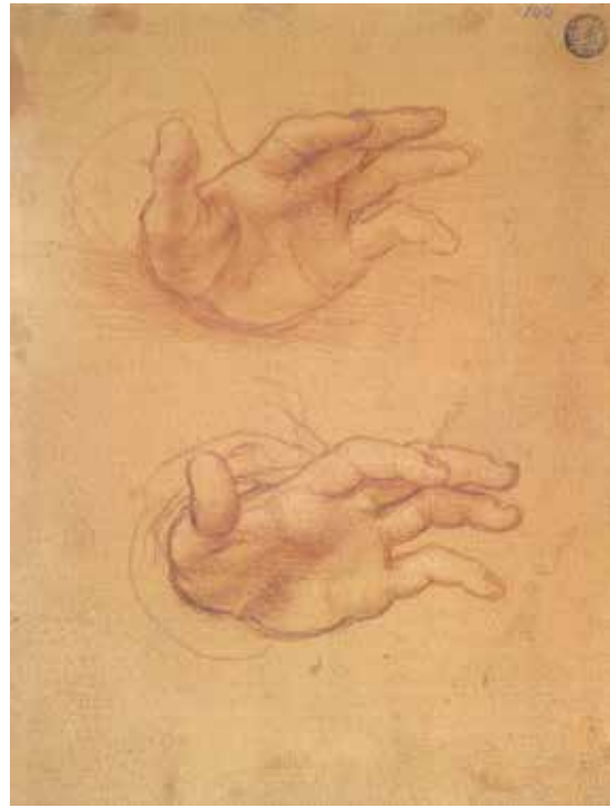
Fig. 7.- Fernando Yáñez de Almedina (attr.), Estudio de manos . Venecia, Gallerie dell'Accademia. Inv.

En relación con los afectos de los que se carga la figura de María, no es completamente indiferente, por ejemplo, la estilización exasperada a la que está sometida la mano derecha, abierta en una sorpresa mayor que el arpegio natural al que se adaptan los dedos en las dos obras antes mencionadas; y es digno de mención que una tensión similar se encuentra en uno de los dos estudios de manos, trazados en una hoja de las Gallerie dell'Accademia de Venecia, a menudo atribuida a Yáñez [fig. 8]. 27 Este énfasis sentimental se justifica por el mayor desequilibrio de