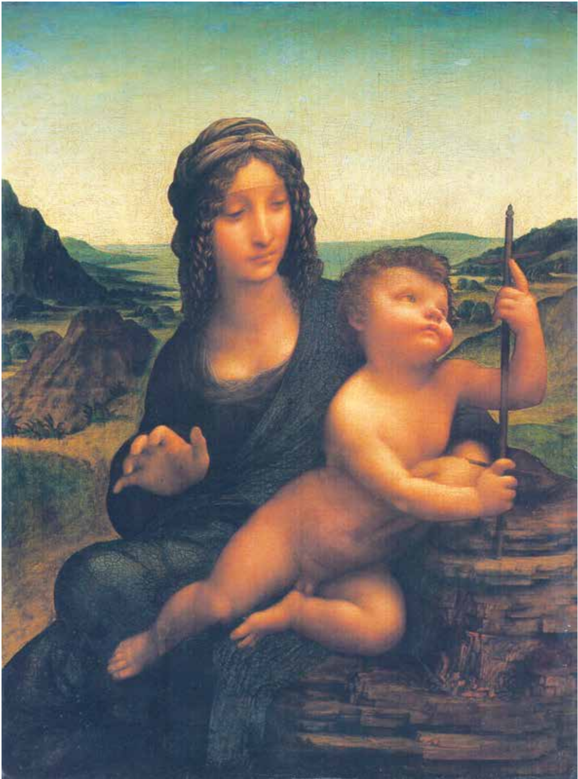
Fig. 8.- Leonardo da Vinci y taller (¿), Madonna con el Niño (Madonna Lansdowne) . Colección particular.