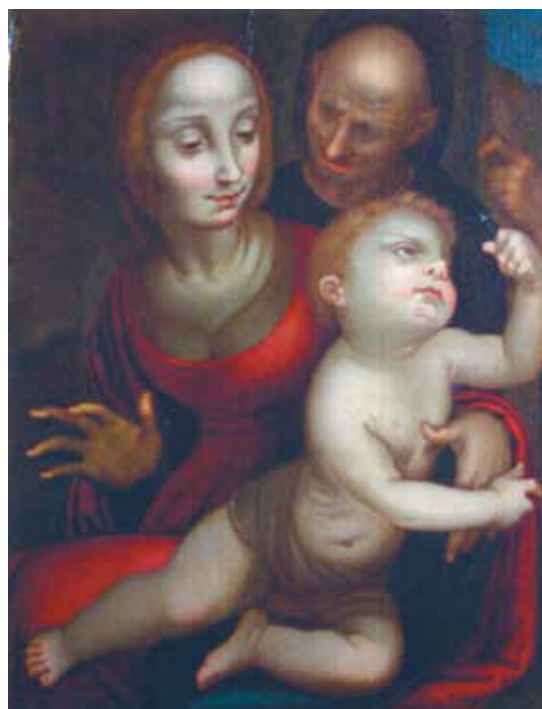
Fig. 3.- Copia de Fernando Yáñez de Almedina, Sagrada Familia , después de 1523. Colección particular.

[fig. 3] Ya en 1999, respaldado por la referencia cronológica a 1523, Ibáñez Martínez –de acuerdo con la propuesta de autografía expresada por el Post– había señalado cómo tal cronología imponía de considerar la obra un producto extremo de la estancia almediniense del pintor, antes de sus trabajos para Cuenca (que datan desde 1525). En su opinión, el aspecto oscuro de la escena se adapta bien al estilo tardío del Yáñez, inclinado a una consistencia más sustancial del claroscuro: por lo tanto, autoriza su colocación en una de las fases de articulación concluyentes de su parábola creativa. 20 Además, para el historiador, la misma composición confirma su pertinencia en vista de tal lectura. De hecho, si el grupo de la Virgen y el Niño testimonia de la duradera pasión del artista por Leonardo, el rostro del decrepito San José, no menos influenciado por el naturalismo analítico del maestro toscano, sería reutilizado para una de las figuras de contorno en la Adoración de los pastores , reali-