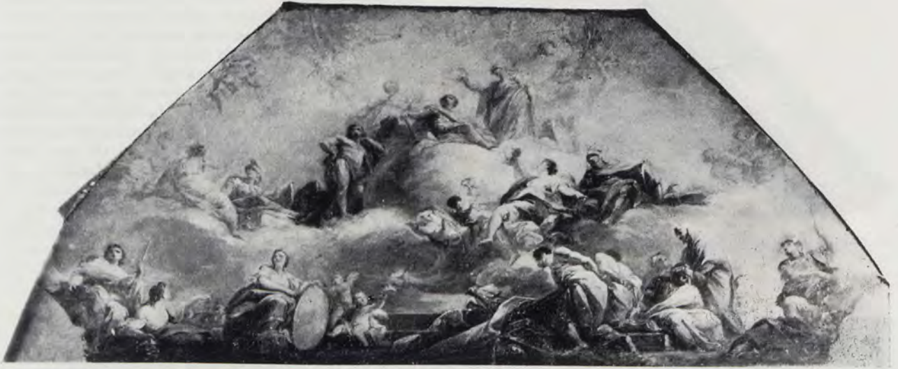
Fig. 4.—Escena principal del boceto «La apoteosis de Adriano»

En el Diccionario geográfico, histórico y estadístico , al hablar del Palacio Real y describir sus bóvedas, dice lo siguiente en relación con ésta: «Bóveda 8. a : Maella (D. Mariano): Fachada de mediodía: Adriano, cuya apoteosis representa este fresco, se ve sentado sobre un globo, acompañado de Minerva, la Magnanimidad y el Heroísmo. Un arco triunfal está formado con palmas, y