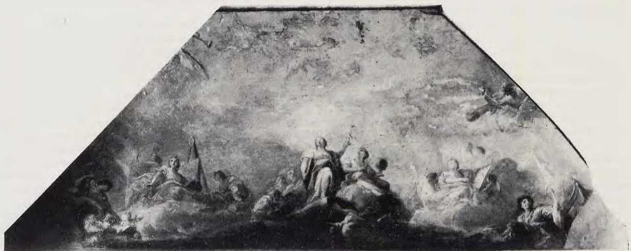
Fig. 5.—Representación de las Nobles Artes en el boceto de Maella

El boceto tiene en su conjunto un sabor bastante italiano, aunque no manifestado directamente, y nota-