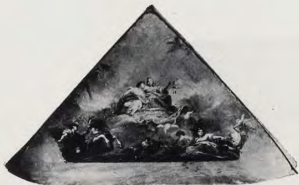
Fig. 2.—Panel lateral del «Borrnquito»: Representación de la Agricultura y Comercio.

Vivía en Madrid desde los once años, aunque no hemos podido averiguar el motivo de esta deslización