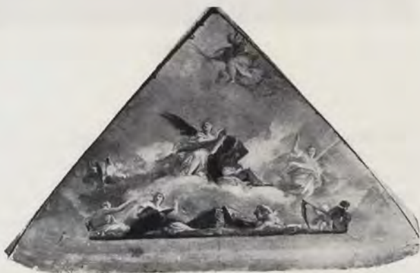
Fig. 3.—Panel pequeño lateral; a la izquierda de Adriano, el Tiempo y otras alegorías.