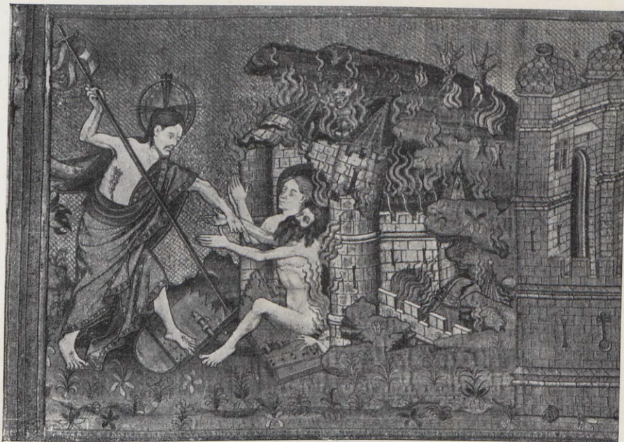
6.—Jesús en el Limbo; otro detalle del frontal llamado de la Resurrección.

Es de mucha importancia el estudio de este inventario para la historia del bordado en Valencia en el período medieval, antes de 1418, pues son de gran interés, ade-