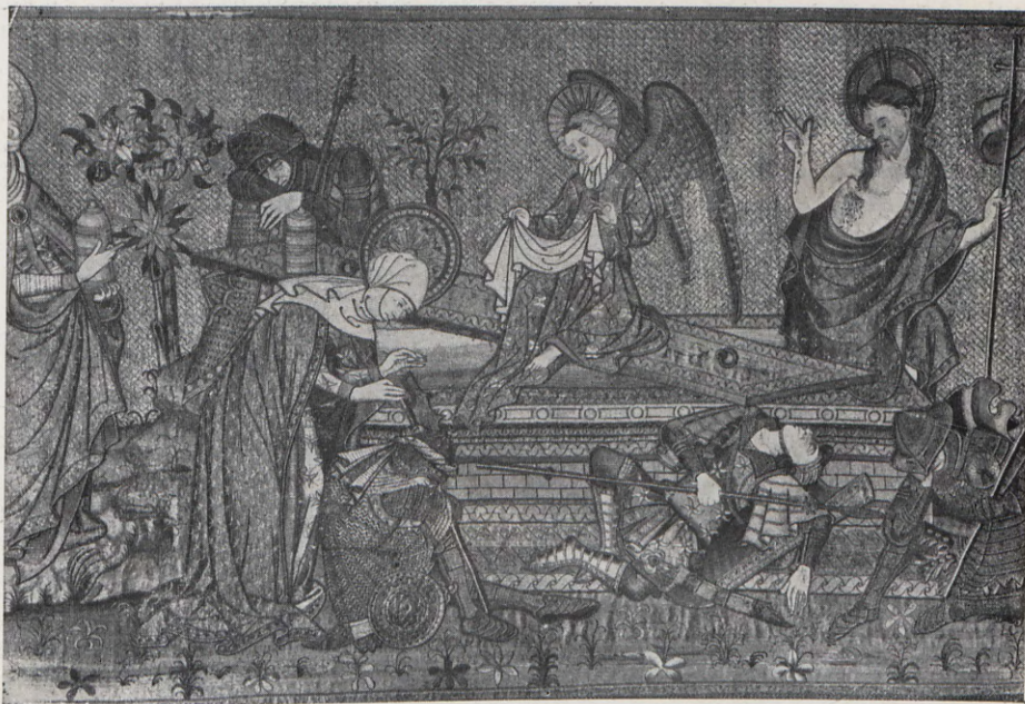
4.— La Resurrección del Señor , detalle del frontal llamado de la Resurrección , de la misma procedencia, bordado en oro y sedas.

Item, huna capa de domasqui blau ab savastres mitganers, forrada de tela blava.