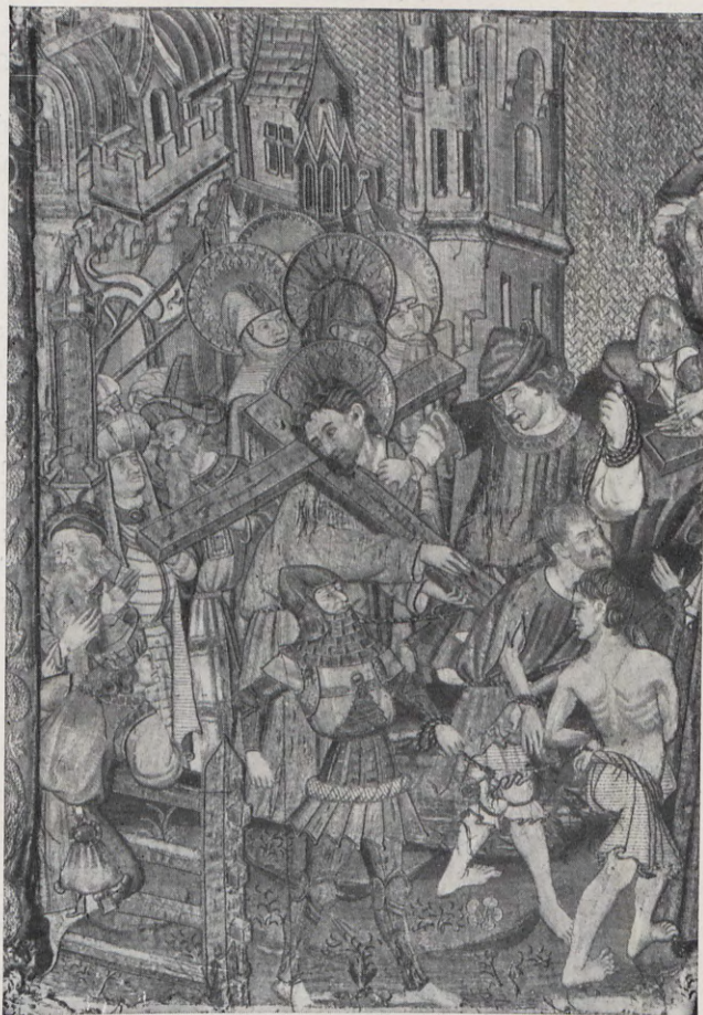
2.— Jesús con la cruz a cuestras , detalle del frontal llamado de la Passión , regalado por el canónigo Vicente Climent en 1474 a la Catedral de Valencia, bordado en oro y sedas.

Item, huna capa de vellut vermell de grana, brodada de brots de roses blanques e grogues, ab fresadura de ymatges, forrada de cendat vert ab senyals de huna banda groguà en camp vermell e de arbres verts per hun hull de mola blancha en camp vermell.