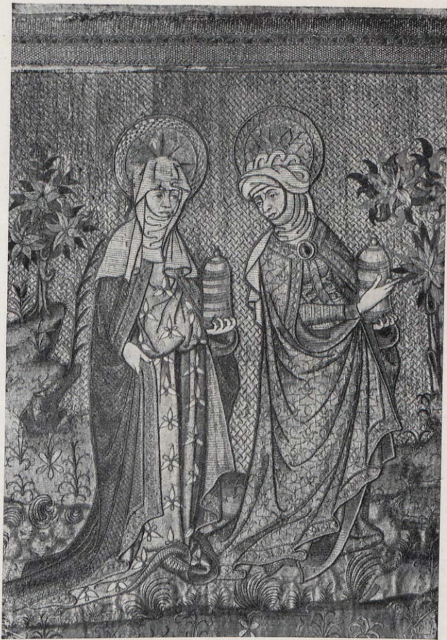
5.— Las Santas mujeres dirigiéndose al sepulcro, otro detalle del frontal llamado de la Resurrección.

Son fetas per la tresoreria e ajustada al present inventari una casulla de vellut negra, nova, ab la fresadura de la casulla, de la qual se fa mencio de... que son fet un sitial, fo-