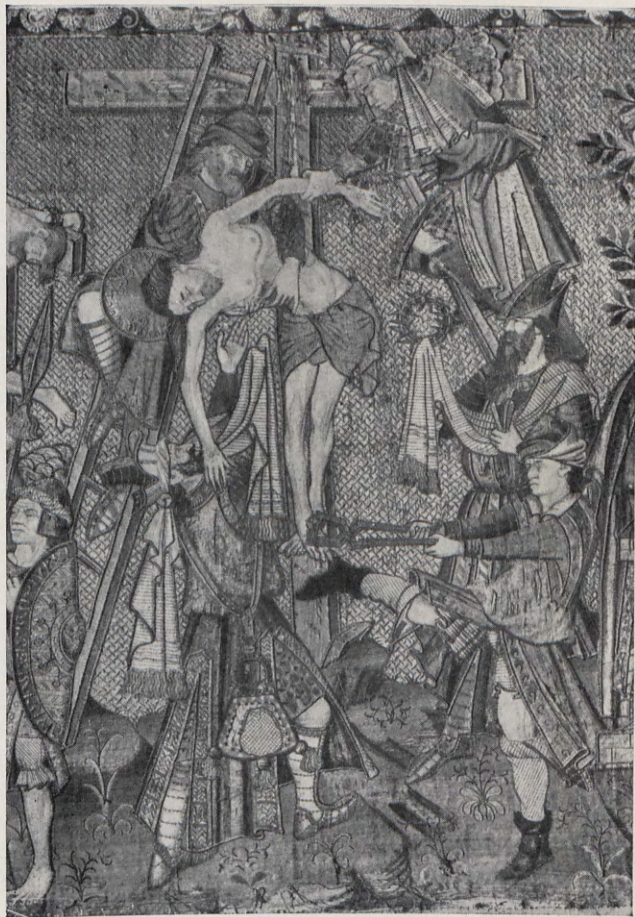
3.— El Descendimiento , otro detalle del frontal llamado de la Pasión .

Item, huna capa de cendat vert, reforçat, ab fresadura de ymatges forrada de tela vert, e huna casulla, dues dalmatiques, tres maniples, dues stoles guarnides de savastre, ab flocadura vermella del damunt dit drap, e forradura.