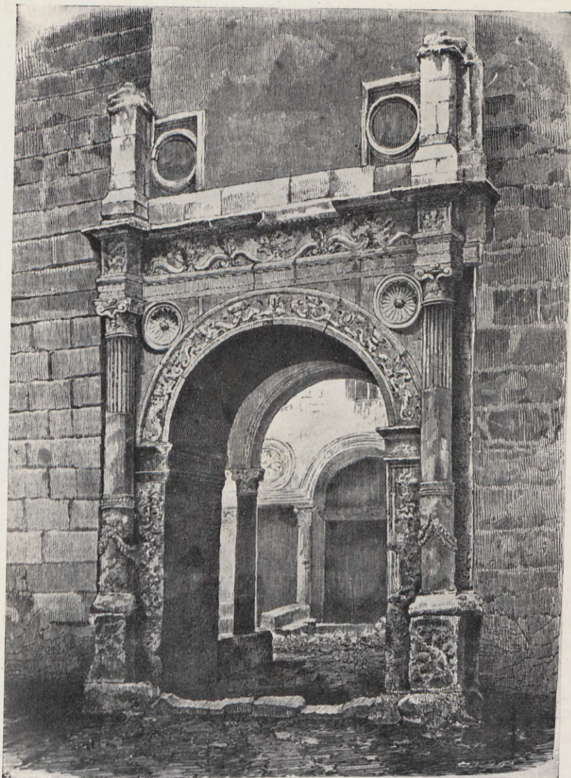
2.—Portada del derruido palacio del Embajador Vich. Los arcos y columnas, en el Museo de Valencia. (De un grabado en madera publicado en «El Fénix»).

vez pintado, y los pisos embaldosados con ladrillo ordinario o cubierto por una capa de mortero endurecido.