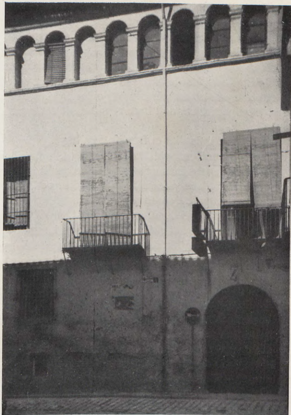
11. - Fachada de la casa núm. 4 de la calle de En Sendra.

Ítem, tres cofrens grans pintats ab titols e flames de foch, ab panys e claus, dins la hu dels quals foren trobades les coses següents, ço es, dos vanones grosses, la huna ab mostra de pechines, e laltre ab mostra de cadenes, ab les cares de cotonia de la terra e les sotanes de lli, mig usades.=Ítem, un parell de llançols de lli prims, de tres teles cascu, nous.=Ítem, dos capdels de randes de fil pera cortinatge.=Ítem, un lançol de lli de tres teles, mig usat.=Ítem, un parell de lançols de almeria, ab bores de seda, de tres teles cascu, ja usats.=Ítem, un devantal de lli rextat...=Ítem, dos tovalles scacades de fil,, en un peçol.=Ítem, unes tovalles de coto scacades noves.=Ítem, dos tovalles de lli scacades, noves, en un peçol.=Ítem, altres tovalles de coto scacades, noves.=Ítem, un parell de tovalles de bristo usades.=Ítem, nou alnes de torquaboques de lli, pallolets, nous, en un peçol.=Ítem, cinch alnes de torquaboques de coto scacats, en un peçol.=Ítem, onze alnes de torquaboques de lli scacats en un peçol.=Ítem, quatre tovalles scacades de stopa pera companya, noves.=Ítem, dos tovalloles de lli pera mans, noves.=Ítem, una dotzena de torquaboques de bristo, mig usats.=Ítem, tres tovalloles de tot seda ab randetes dor, ja usades.=Ítem,