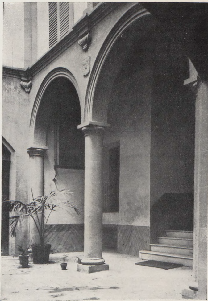
6.—Patio porticado de la casa núm. 3 de la calle de la Concordia.

Manises , p., núms. 3 y 6.—Casa señorial con los blasones de Boil. Consta de dos cuerpos, de casi igual elevación en las fachadas; el cuerpo en que se abre la