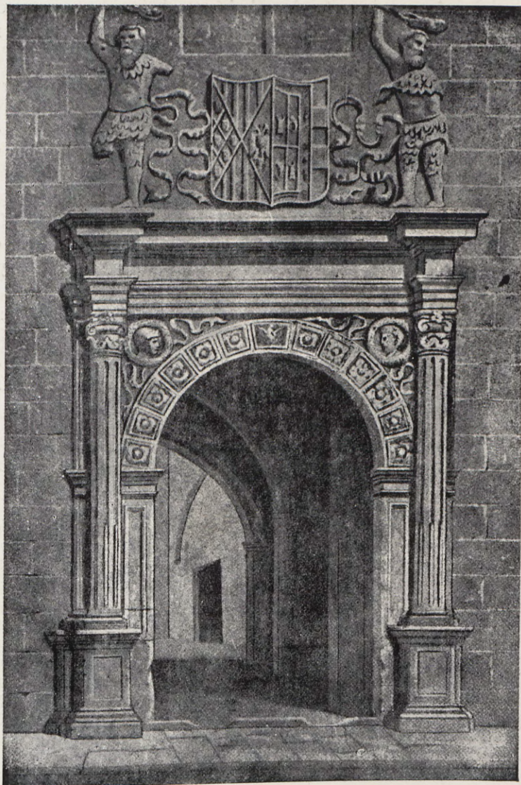
1. —Portada del derruido palacio de los Duques de Mandas. Se halla instalada en el Museo de Valencia. (De una litografía antigua).

sobre ella había un gran ventanal de madera que ventilaba y daba luz a la habitación del piso alto. Estas casas eran habitadas unas por industriales, que tenían el taller o