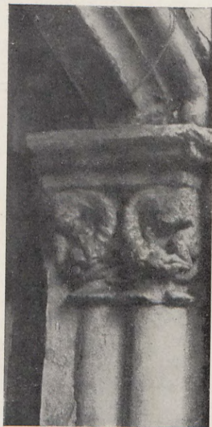
10.—Capiteles del patio de la casa núm. 11 de la calle de Eixarchs.

Item, un basalant e un maniers del dit defunt.