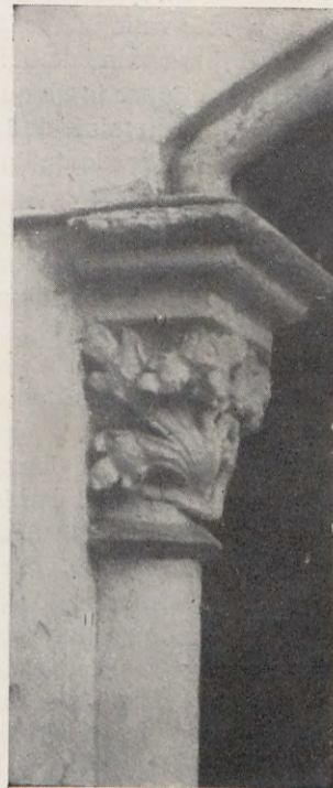
9.—Capitel y arranque del arco del patio de la casa núm. 11 de la calle de Eixarchs.