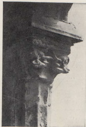
5.—Fuste y capitel (detalle), del patio de la calle de Calatrava, núm. 6.

Cadisers , c., núm. 5.—Casa burguesa, cuya puerta, de medio punto, ha sido modernizada. En el patio hay arcos deprimidos, es descubierto y muy capaz, y en él tiene principio la escalera de sillería que da acceso al piso alto. En un principio tuvo la característica serie de ventanas en el desván.