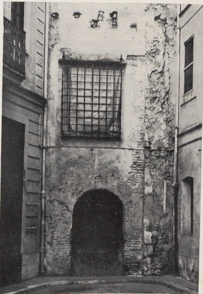
3.—Casa plebeya, en la calle del Almirante, hoy Maestro Chapí, núms. 12 y 14.

días que el rey Felipe III estuvo en Valencia con motivo de su casamiento (1). Parece increíble la esplendidez, grandeza y magnífico ornato de estas casas. Los techos