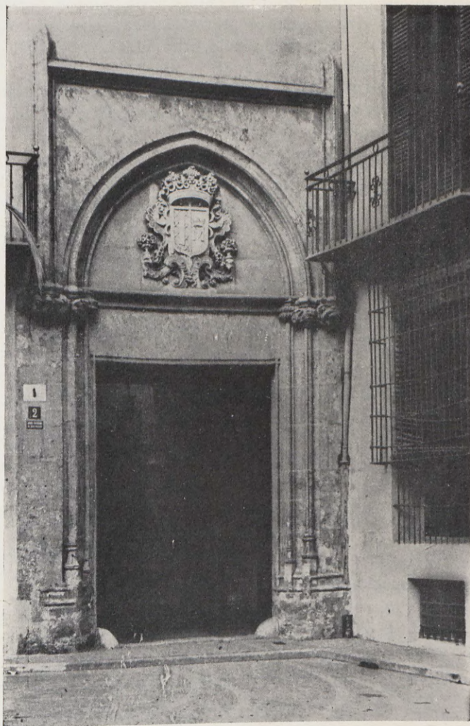
14.—Fachada de una casa gótica, en la plaza de San Luis Bertrán, núm. 2.

Item mes, ha a tornar a cobrir les dues cases que seran una ab dues jacenes, e a pay-