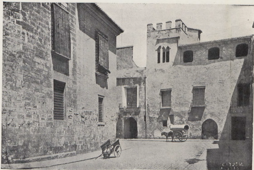
4.—Aspecto de la plaza de la Almoyna a mediados del pasado siglo. (De una fotografía antigua).

Jardines, c., núms. 2 y 4. —Son dos casas contiguas, modernamente construídas, una más antigua que otra, y constan cada una de planta baja y piso único: el plan y el área de cada uno son distintos.