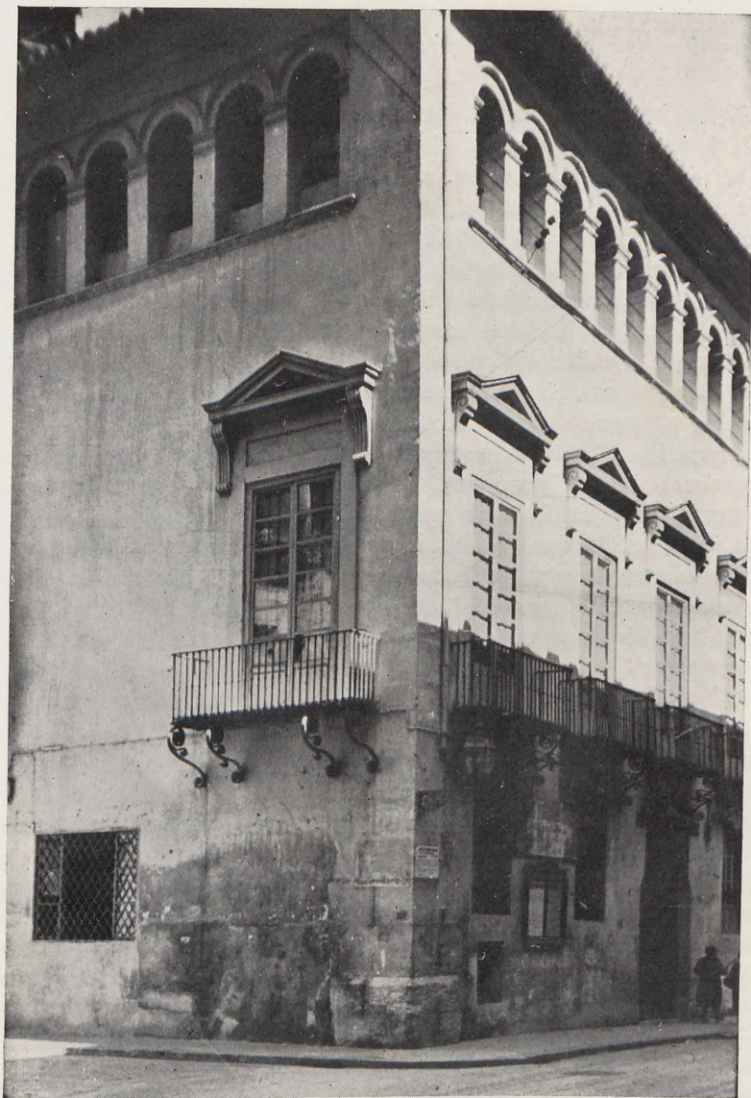
13.—Casa de los Valeriola, en la calle del Mar.

Item, una post e una raiera rexada. Item, un canalobre ab lo peu de fust per tenir brando. Item, un pages de fust, e una stora vella despert. Item, un drap saranesch. Item, unes graelles e un rall de ferre. Item, uns alambrians e un banquet de tenir ciris sobre fosses. Item, tres cresols. Item, una carrega de lena e una sarria de carbo. De les gallines e gall, amplolles e cantes e scudelles e talladors, non fon feta mencio de voluntad del dit Cardona.