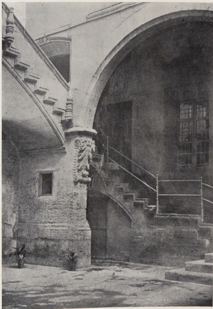
12. -Interior del patio del palacio del Marqués de la Scala, en la plaza de Manises.

habitación de las criadas. En otro hueco, junto a la escalera, el amasador o sitio para guardar la harina. Viene después el studi major o sala donde se guardaban en unos cajones los papeles de la familia. En esta habitación había dos cuartos o alcobas, lo primer retret