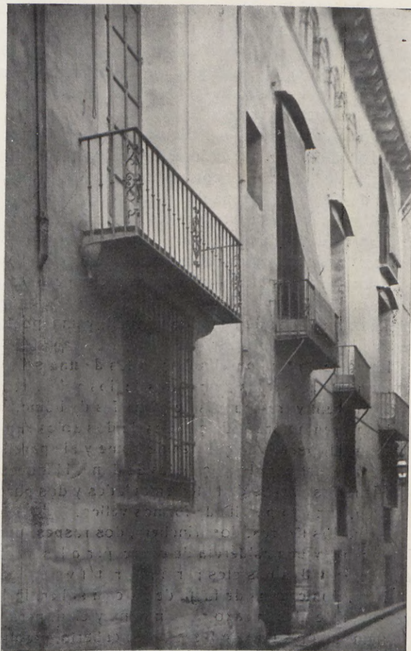
8.—Fachadas de las casas núms. 3 al 11 de la calle de Eixarchs.

A fin de tener más elementos de conocimiento para formarse idea del interior de aquellos edificios, su distribución, menaje, indumentaria de sus habitantes y otras particularidades de vida interna de aquellos tiempos, creemos oportuno transcribir algunos inventarios de los objetos que llenaban las casas de los plebeyos, artesanos, burgueses y señores. Son documentos muy curiosos, cuya lectura nos hace adivinar la clase de personas que habían sido los habitantes de las casas a que se refieren.