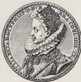
66-67.—Medalla de las bodas del Archiduque (Anv. y Rev.) Núm. 50 del Catálogo.

bante, Conde de Flandes, Holanda y Zelanda).—Busto del Archiduque a la derecha, con coraza, gorguera y toisón. CON. BLOC. F.