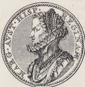
62-63.—Medalla de las Bodas de Felipe III (Anv. y Rev.) Núm. 48 del Catálogo.