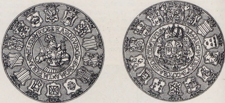
48-49.—Medalla de Carlos V (Anv. y Rev.) Núm. 39 del Catálogo.

Rev.—DA - MICI - VIRTVT - CONTRA - HOSTES - TVOS.—Escudo cimado de corona imperial con águila de dos cabezas cargada en el pecho de un escudete partido de Austria y Borgoña antiguo con el collar del toisón y dos leones por tenantes del pavés. Alrededor del todo trece escudos de varios reinos y ciudades. Entre el primero y el último blasón dos columnas, y entre ellas dos cintas en sotuer con PL - VS - OVLTRE y encima 1532.