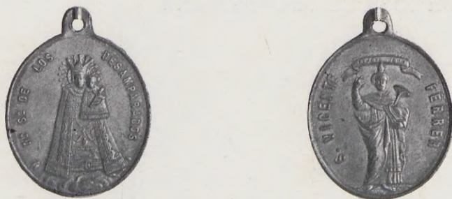
105-106.—Medalla de los Patronos (Anv. y Rev.) Núm. 71 del Catálogo.

71. —A.—N a S a DE LOS DESAMPARADOS.—Su imagen.