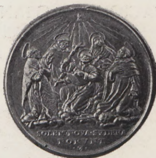
92-93.—Medalla de la Canonización de San Francisco de Borja, San Luis Bertrán y otros Santos. (Anv. y Rev.) Núm. 63 del Catálogo.

Cobre. 39 mm. Colección del autor. Variante. El Pontífice con birrete.