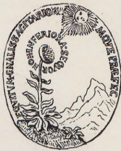
86-87.—Medalla de D. Baltasar Marradas (Anv. y Rev.) Núm. 60 del Catálogo.

Oro. Mod. 39 por 23. Peso, siete ducados. Rodeada de un marco oval esmaltado. Monetario Imperial de Viena.