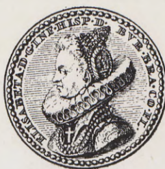
72-73.—Medalla de las bodas del Archiduque Alberto (Anv. y Rev.) Núm. 53 del Catálogo.