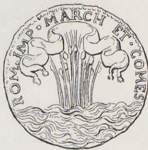
55-56.—Medalla de Vespasiano Gonzaga (Anv. y Rev.) Núm. 43 del Catálogo.

Rev.—ROM. IMP. MARCH. ET COMES.—Surtidores de agua saliendo del mar y una cinta ondulada terminada en borlas.