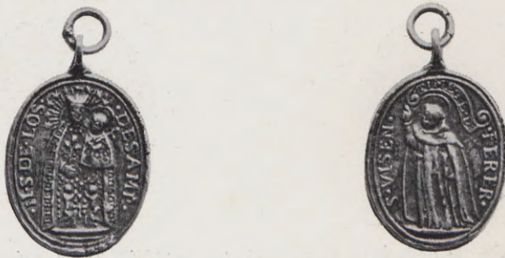
101-102.—Medalla de los Patronos (Anv. y Rev.) Núm. 69 del Catálogo.