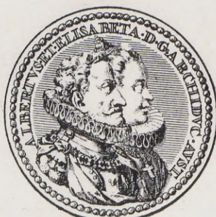
68-69.—Medalla de las bodas del Archiduque (Anv. y Rev.) Núm. 51 del Catálogo.

En figla circular inferior el nombre del autor. MONF. F.