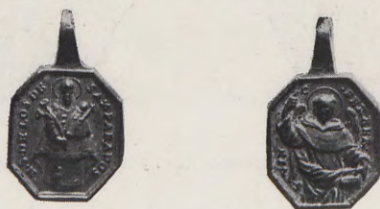
103-104.—Medalla de los Patronos (Anv. y Rev.) Núm. 70 del Catálogo.

70. —A.—N. S. DE LOS DESAMPARADOS.—Su imagen.