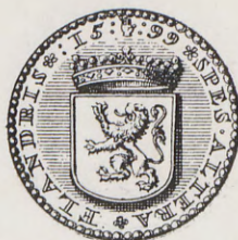
78-79.—Medalla de las bodas del Archiduque Alberto (Anv. y Rev.) Núm. 56 del Catálogo.

Rev.—SPES. ALTERA. FLANDRIS (Nueva esperanza para los flamencos). 1599. Armas de Flandes. 27 mm. «V. Loon», t. I, pág. 511.