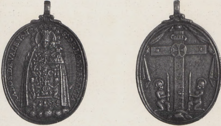
107 108.—Medalla de la Cofradía de la Virgen de los Desamparados (Anv. y Rev.) Núm. 72 del Catálogo.

72.—A.—Su imagen.—N a S a DE LOS DESAMPARADOS DE VALEN a .