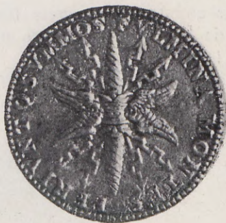
53-54.—Medalla de Vespasiano Gonzaga (Anv. y Rev.) Núm. 42 del Catálogo.

Vespasiano Gonzaga Coloma, Duque y Príncipe de Sabioneta desde 1541, nació en 1531, juró el cargo de Virrey de Valencia el 15 de marzo de 1575 y falleció en 1591.