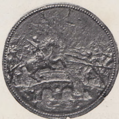
57-58.—Medalla del Marqués de Mondéjar (Anv. y Rev.) Núm. 45 del Catálogo.

Cobre 48 mm. Autor, Juan Melún. V. y Q., núm. 13865. El ejemplar que reproducimos es del Mus. Arq. Nac.