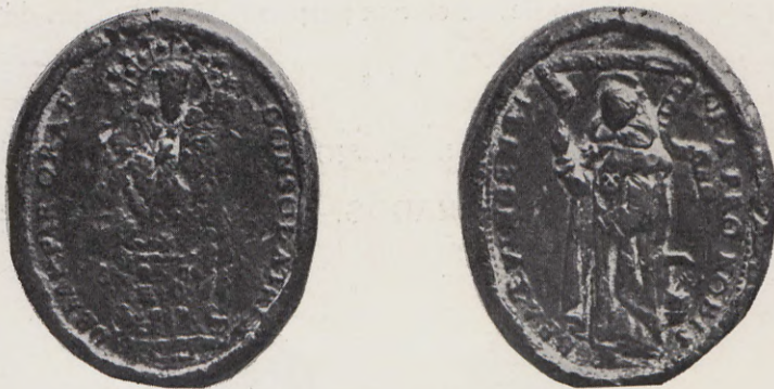
99-100.—Medalla de los Patronos (Anv. y Rev.) Núm. 68 del Catálogo.