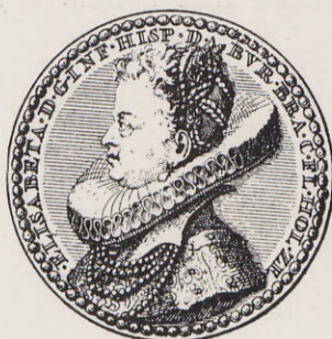
70-71.—Medalla de las bodas del Archiduque Alberto (Anv. y Rev.) Núm. 52 del Catálogo.

Gratia, INFans HISPaniarum Dux. BURgundie. BRAbantieque; Comes FLandrie HOLlandie ZElantieque). Plata. 39 mm. «V. Loon», t. I, pág. 511.