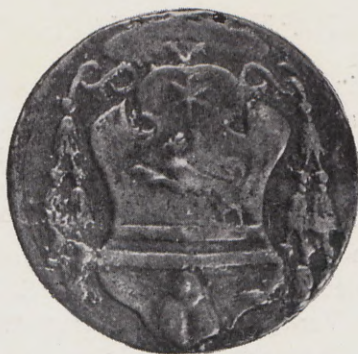
42-43.—Medalla del Cardenal Casanova. (Anv. y Rev.) Núm. 36 del Catálogo.

Cobre. Mód. 46 mm. Mus. Arq. Nac. Armand. II, 137. 12.