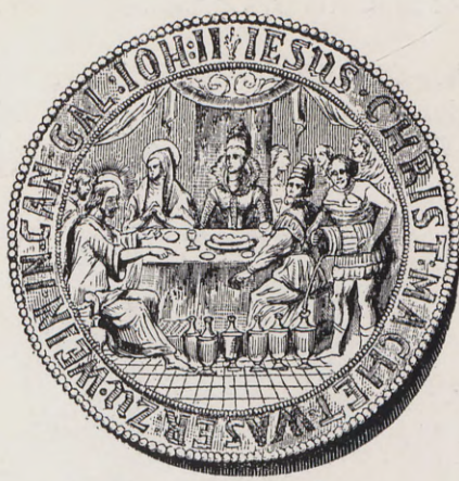
64-65.—Medalla de las bodas del Archiduque Alberto (Anv. y Rev.) Núm. 49 del catálogo.

Rev.—JESUS. CHRIST. MACHET. WASER. ZU. WEIN. IN. CAN. GAL. IOH. II. Una mesa rodeada de comensales entre los que se encuentra el Redentor y que representa las bodas de Canaan.