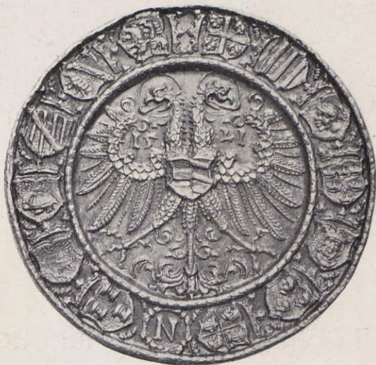
47.—Medalla de Carlos V (Rev.). Núm. 33 del Catálogo.

Rev.—En el campo el águila imperial de dos cabezas nimbadas, llevando en el pecho el escudo partido de Austria y de Borgoña antiguo. Entre las alas 15 — 21. Alrede-