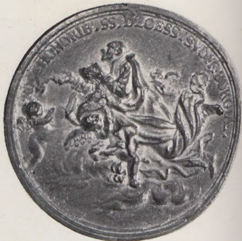
1091.—Medalla de la Canonización de San Francisco de Borja (Anv. y Rev.) Núm. 62 del Catálogo.

pués Presbítero, religioso de la Compañía de Jesús, su Comisario General de España y de las Indias y el III Preósito General de ella, nació en Gandía en el Palacio Ducal de sus ilustres antepasados el 28 de octubre de 1510, fué beatificado por el Pontífice Urbano VIII en 23 de noviembre de 1624 y canonizado por la Santidad de Clemente X el 12 de abril de 1671 (1).