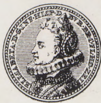
74-75.—Medalla de las bodas del Archiduque Alberto (Anv. y Rev.) Núm. 54 del Catálogo.