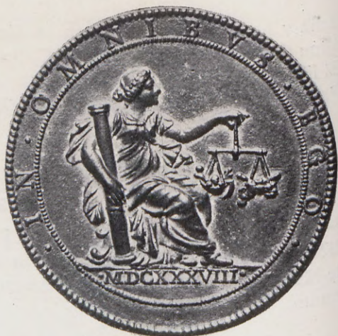
84-85.—Medalla del Duque de Montalto (Anv. y Rev.) Núm. 59 del Catálogo.

Rev.—IN OMNIBUS EGO. (Yo contra todos).—Matrona sentada abrazando con la diestra una columna y empuñando con la siniestra una balanza. En el exergo MDCXXXVIII.