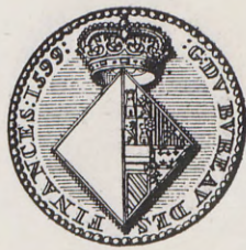
76-77.—Medalla de las bodas de la Infanta Isabel de España con el Archiduque Alberto (Anv. y Rev.) Núm. 55 del Catálogo.

Rev.—G. DV. BVREAV. DES FINANCES. 1599.—Escudo en losanje y partido; 1.º vacío o campo de plata, y 2.º armas de España. Corona real. 27 mm. «V. Loon», t. I, pág. 511.