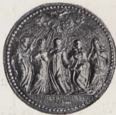
95.—Medalla de la Canonización de San Francisco, San Luis y otros Santos (Rev) Núm. 65 del Catálogo.

Rev.—Los cinco Santos. En el exergo, PLENA EST OMNIS TERRA GLORIA EORVM. (Toda la tierra está llena de su gloria).