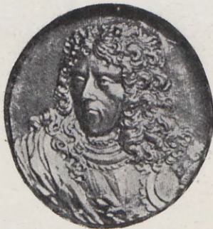
96.—Medalla del Gran Maestre Perellós (Anv.) Núm. 66 del Catálogo.