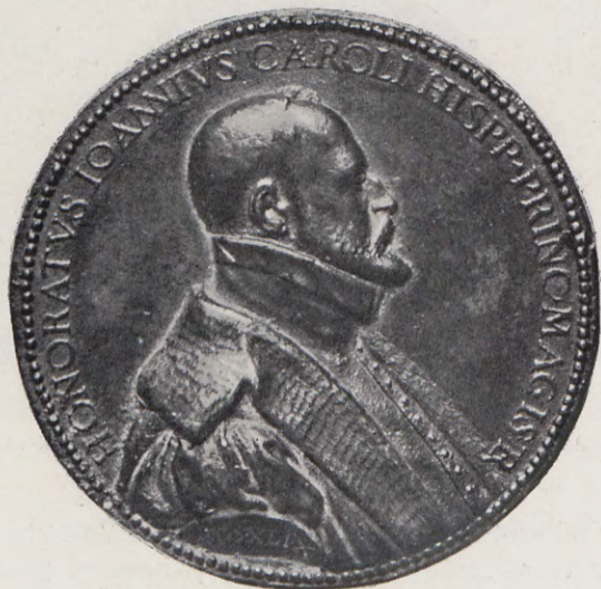
51.—Medalla de D. Honorato Juan (Anv.) Núm. 41 del Catálogo.

Rev.—Una matrona hacia la que levanta la cabeza una culebra y una lápida con la inscripción SPE. FI. NIS.