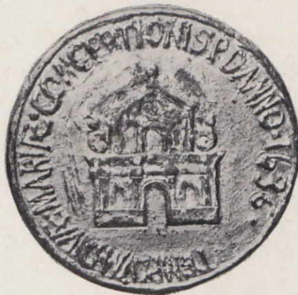
82-83.—Medalla del Duque de Montalto (Anv. y Rev.) Núm. 58 del Catálogo.

Rev.—TEMPLVM DIVE CONCEPTIONIS. P. DANNO 1636. En el centro portada de un templo.