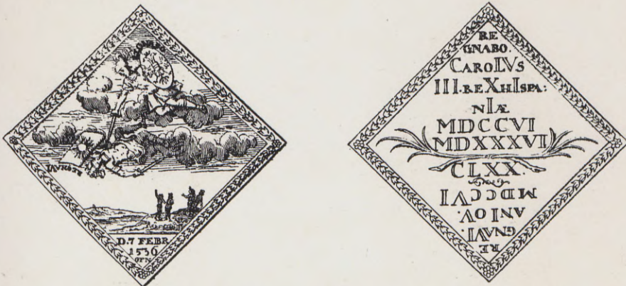
109-110.—Medalla de la Guerra de Sucesión (Anv. y Rev.) Núm. 73 del Catálogo.

73.—A.—Sobre nubes dos guerreros peleando uno con escudo con una águila y el letrero «Je regnerai», vencedor, y el vencido con un escudo que lleva un sol y el lema «J' ai regné». Debajo unos hombres contemplando el combate desde unos montes. En el exergo, D. 7 febr. 1536. G. F. N.