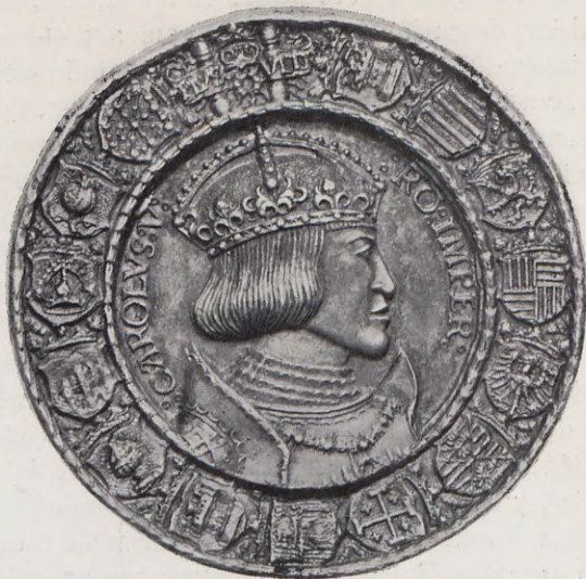
46.—Medalla de Carlos V (Anv.) Núm. 38 del Catálogo.

No incluimos en nuestro catálogo las siguientes medallas del Emperador por razón de su Soberanía, puesto que gobernó después de la unidad ibérica; el motivo es porque aparece en ellas nuestro escudo comarcal; y la inclusión está en consonancia con lo que se inserta en el epígrafe de este trabajo, donde se mencionan como pertinentes las medallas que ostentan atributos de Valencia.