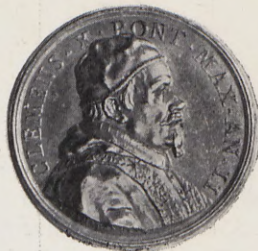
94.—Medalla de la Canonización de San Francisco, San Luis y otros Santos (Anv.) Núm. 64 del Catálogo.

64.—A.—CLEMENS. X. PONT. MAX. AN. II.—Busto del Papa Clemente X, a la derecha, con birrete.