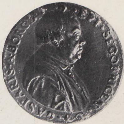
50.—Medalla de Gaspar de Borja, Obispo de Segorbe (Anv.) Núm. 40 del Catálogo.

Nació D. Gaspar en Valencia y fué Prebendado de Segorbe, Canónigo de Jérica en la misma Catedral, al mismo tiempo Arcediano Mayor y Dignidad de la Santa Iglesia de Valencia, después Arzobispo de esta ciudad electo y últimamente Obispo de Segorbe y Albarracín. Dice Bethencourt que, fallecido en 1520 el grande Arzobispo de Zaragoza, D. Alonso de Aragón, hijo natural del Rey Católico, que administraba al mismo tiempo la archidiócesis de Valencia, este Cabildo metropolitano hubo de elegirle en 28 de febrero por su Arzobispo para restaurar la tradición casi secular que