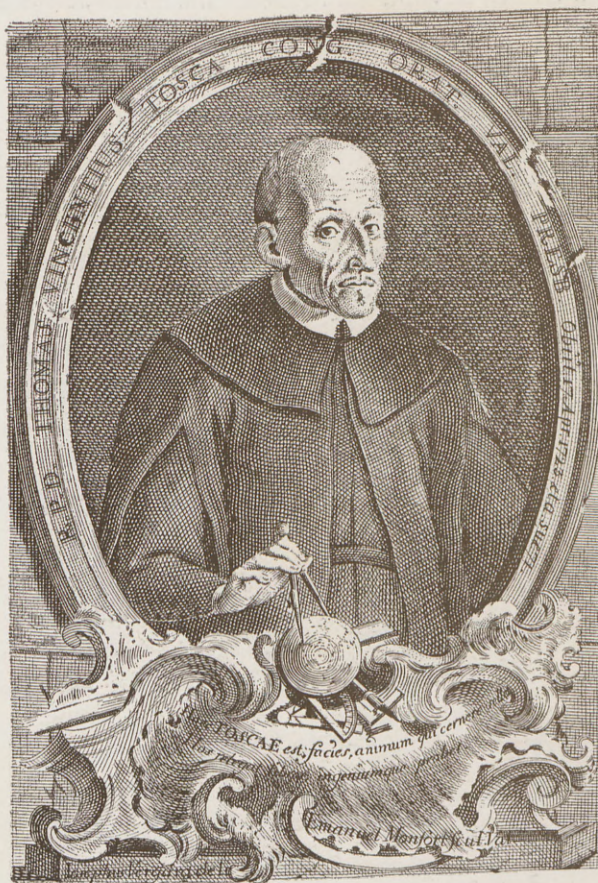
Retrato del P. Tosca, que va al frente de la tercera edición del Compendio Mathematico (1757).

obra tiene muchos puntos de contacto con la manera de grabar de Juan B. Ravanals y Tomás Planes, contemporáneos de Manuel Monfort. Peca su producción de alguna dureza; el dibujo es correcto y la técnica empleada es casi análoga a la de los grabadores valencianos de la primera mitad de la centuria XVIII.