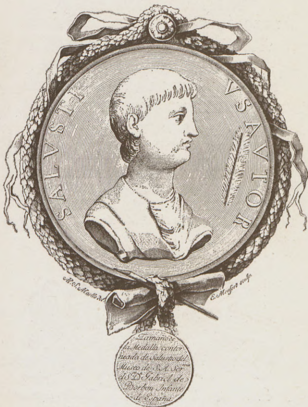
Retrato de Salustio.—Reprod. de una medalla que poseía el Infante D. Gabriel (Ed. 1772).

Los primeros años del siglo xix son para nuestro Monfort de continuado sufri-