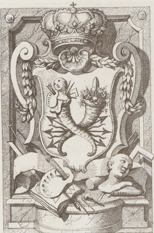
Emmanuel Monfort sculpit.

«Se vio assi mismo una carta del Excmo. Sr. Conde de Floridablanca escrita al Sr. Presidente de esta Real Academia. En ella expresa su Ex. a : «Que el Rey se ha servido nombrar a D. n Manuel Monfort Tesorero Administrador de