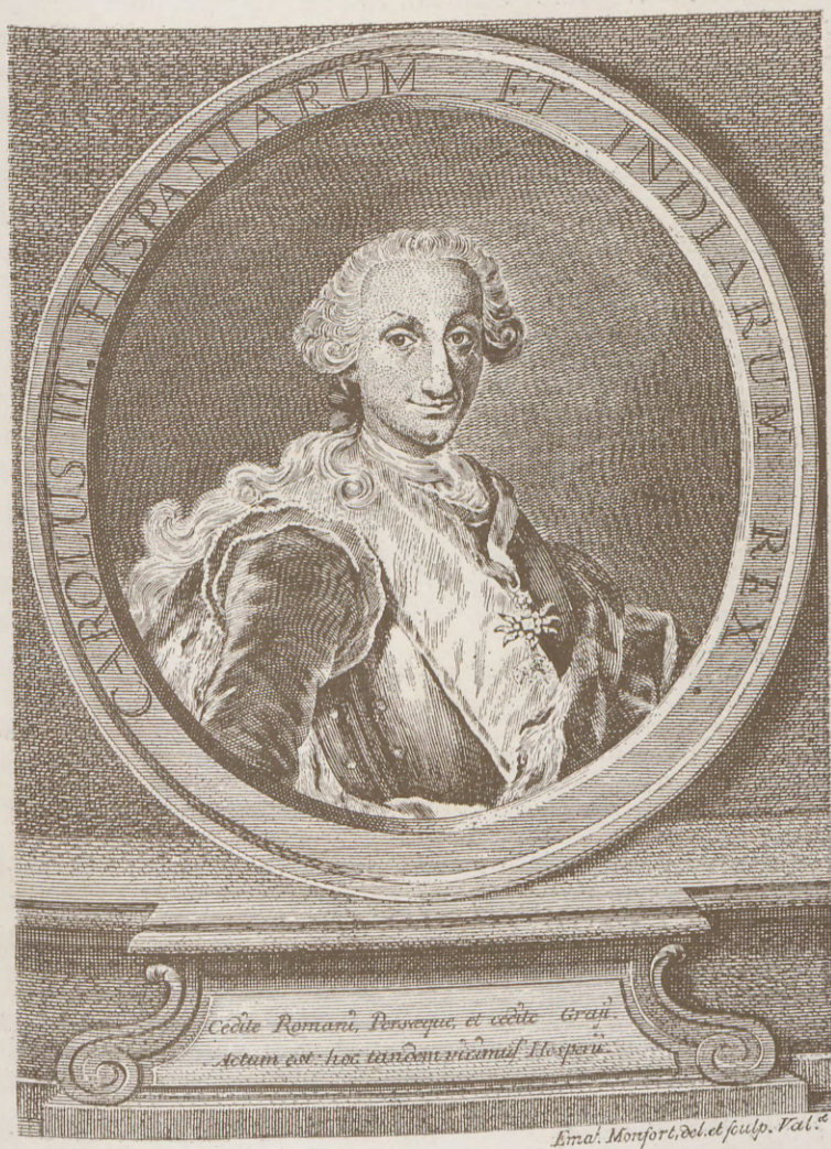
Retrato de Carlos III, que figura al frente de la tesis de D. Vicente Blasco García (1760).

esta obra a la Corporación valenciana». «La Junta—en vista de ello—acordó manifestar su gratitud, con carta para S. A., expresando el más vivo reconocimiento al aprecio y memoria que se ha dignado S. A. hacer de esta Academia, y que se dirija la