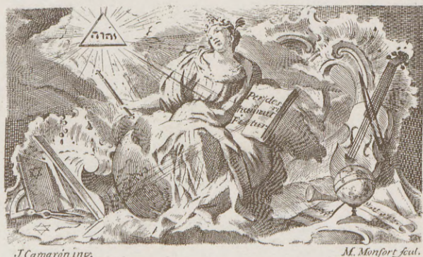
La Teología. —Viñeta alegórica que figura en la pág. 1 de la tesis de D. V. Blasco (1760).

A mediados de 1774 le hallamos otra vez en Madrid gestionando algunas mejoras de carácter económico para sus compañeros de profesorado (1). No debieron realizarse tan pronto como desearan las pretensiones de los profesores valencianos, por cuanto siguió Monfort en la Corte prolongado tiempo. Cansados, por fin, de la inutilidad del esfuerzo, le reclaman sus compañeros y hasta le amenazan con declarar vacante la cátedra de grabado (2).