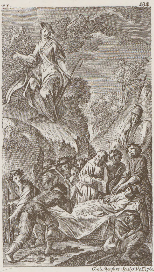
Entierro de Crisóstomo.—Ed. de Ibarra (1771).