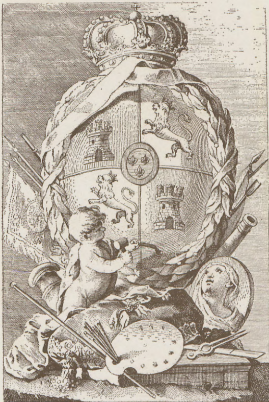
Emmanuel Monfort sculpit.

Transcurridos los años de pensión de los jóvenes valencianos e informada S. M. por D. Manuel Monfort, de la señalada aplicación de los referidos, procurando cada uno sobresalir en su arte, resolvió el Rey prorrogarles por tres años más el goce de su pensión, cuya R. O. comunicó a la Academia de San Carlos el Excmo. Sr. Conde de Floridablanca con fecha de 26 de marzo de 1782.