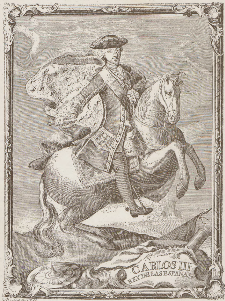
Retrato de Carlos III, con motivo de su proclamación (1759).

La Real Academia de Bellas Artes de San Fernando, queriendo rendir un tributo de compañerismo a los abnegados profesores valencianos que constituyeron la pri-